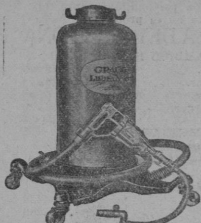
Equipo Engrase con pistola automática CRACO