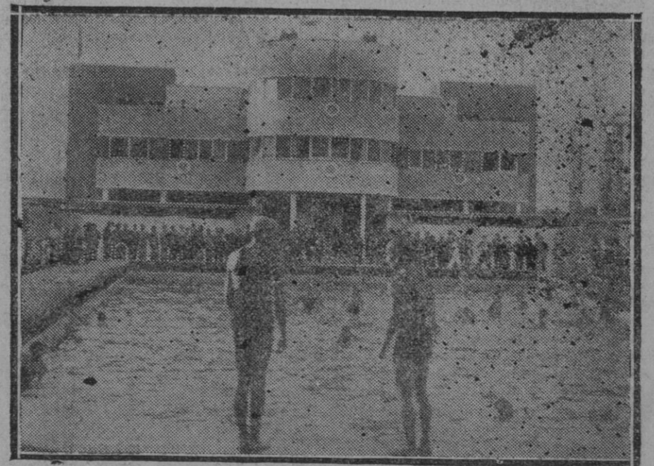
MADRID.—Inauguración de las piscinas de la Isla. Aspecto de una de las piscinas durante las pruebas de los socios del Canal Club