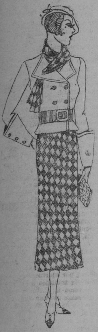
Costume compuesto, muy chic. La falda en lana fantasma a cuadros beige y marron oscuro. Chaqueta en lana beige, botones y cinturón de piel marron. Echarpe igual que la falda