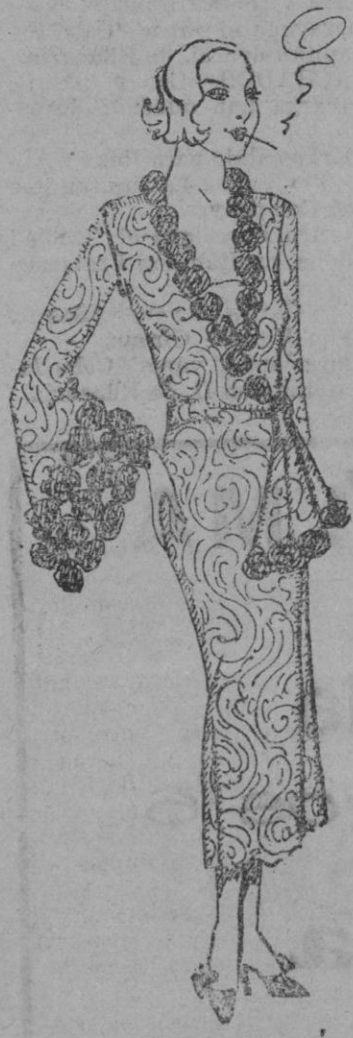
Salto de cama en satén estampado verde agua, decorado con rosa de plata

LA SRTA. DEL INSTITUTO (Prohibida la reproducción).