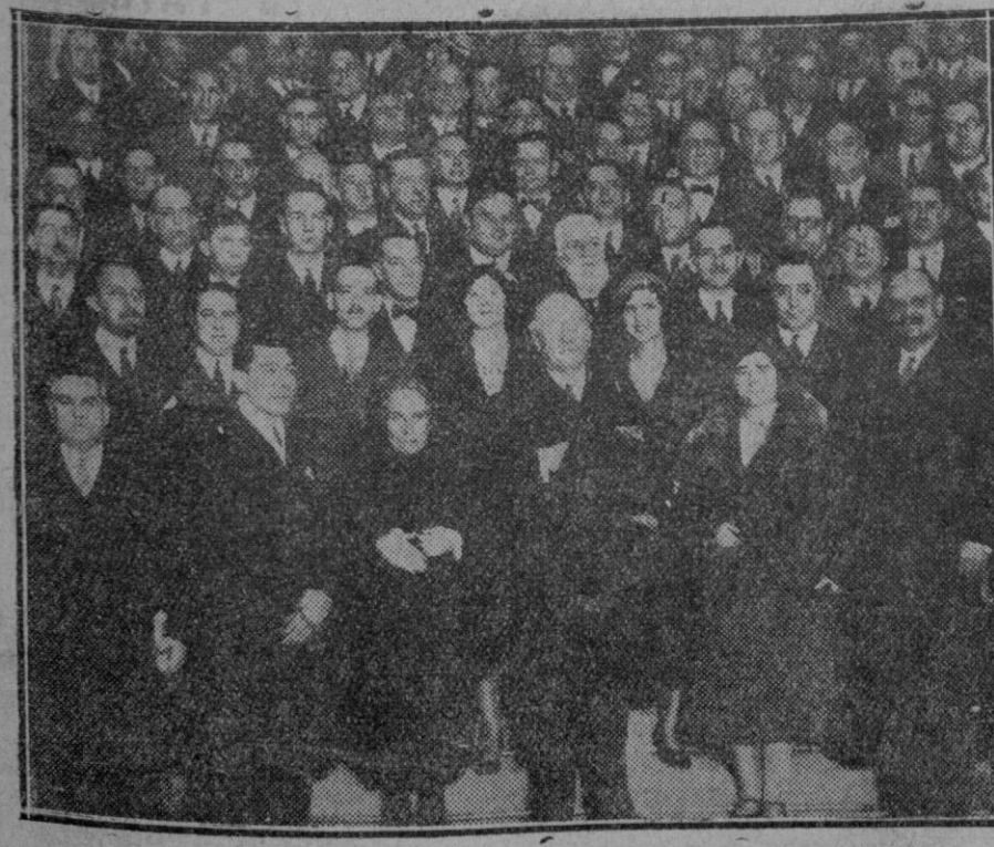
MADRID.—El Sr. Lerroux con un grupo de asistentes al banquete organizado por las juventudes Radicales.