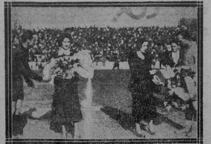
Los capitanes del Madrid y el Arenas reciben ramos de flores de las damas cubanas en el partido de ayer, cuya recaudación se dedicó, en parte a los damnificados de Santiago de Cuba, al que ganó el Madrid 4 a 0 al Arenas