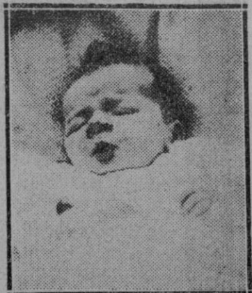
El hijo del célebre aviador Charles August Lindbergh, que ha sido raptado y por el que los secuestradores piden la suma de 50.000 dólares