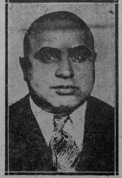
Al Capone, el famoso bandido norteamericano, actualmente preso que ha ofrecido 10.000 dólares, para el rescate del hijo de Lindbergh