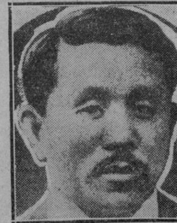
EXTRANJERO.— El embajador del Japón en Moscú que ha obtenido del gobierno soviético autorización para el paso de tropas niponas por el Este de China