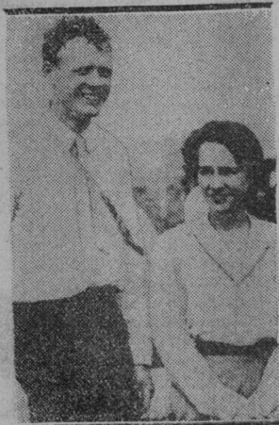
NUEVA YORK.—El matrimonio Lindbergh cuyo hijo secuestraron unos bandidos y piden un fuerte rescate

Esta permuta es sumamente beneficiosa para Palma, y por tanto débese procurar por quienes nos administran, asegurar el éxito de la gestión iniciada ya con el actual Ministro de la Guerra Sr. Azaña, cuya buena voluntad para con esta población ha sido puesta de relieve con las cesiones que ha hecho ya o que desde la Presidencia del Consejo ha apoyado.