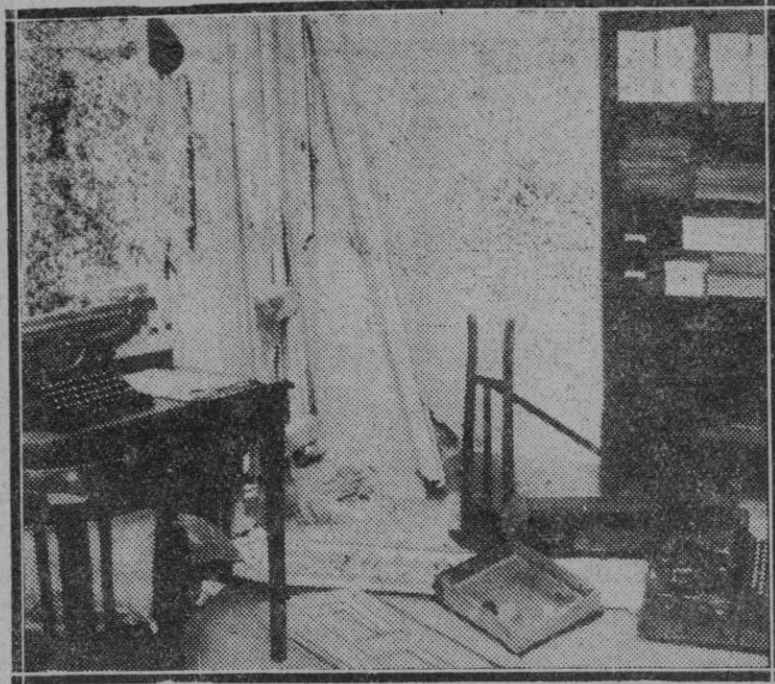
MADRID.—En las ventanas de la casa número 19 de la calle del Conde de Xiguena hicieron explosión dos bombas.—Destrozos causados por las bombas en el interior de la casa.