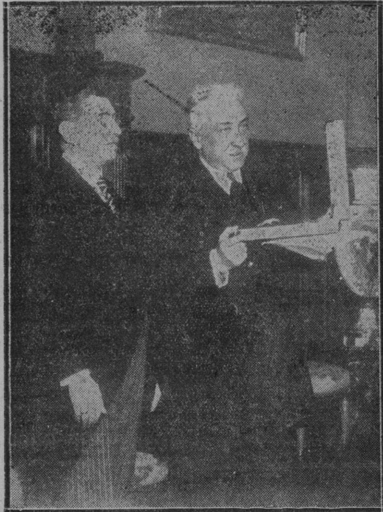
MADRID.—El ministro de Bolivia entregando al señor Alcalá Zamora, las insignias del Gran Condor