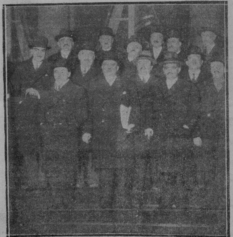
PARIS.— El nuevo ministerio francés presidido por M. Tardieu a la salida del Eliseo

Lo único que no está claro y justificado en el plan taumatúrgico del senador demócrata de Virginia, M. Carter Glass, es la esperanza puesta en el