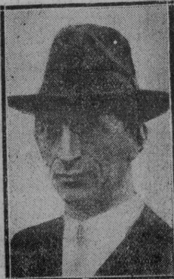
El famoso nacionalista irlandés De Valera, que cuenta con grandes probabilidades para ser elegido Presidente de la República de Irlanda