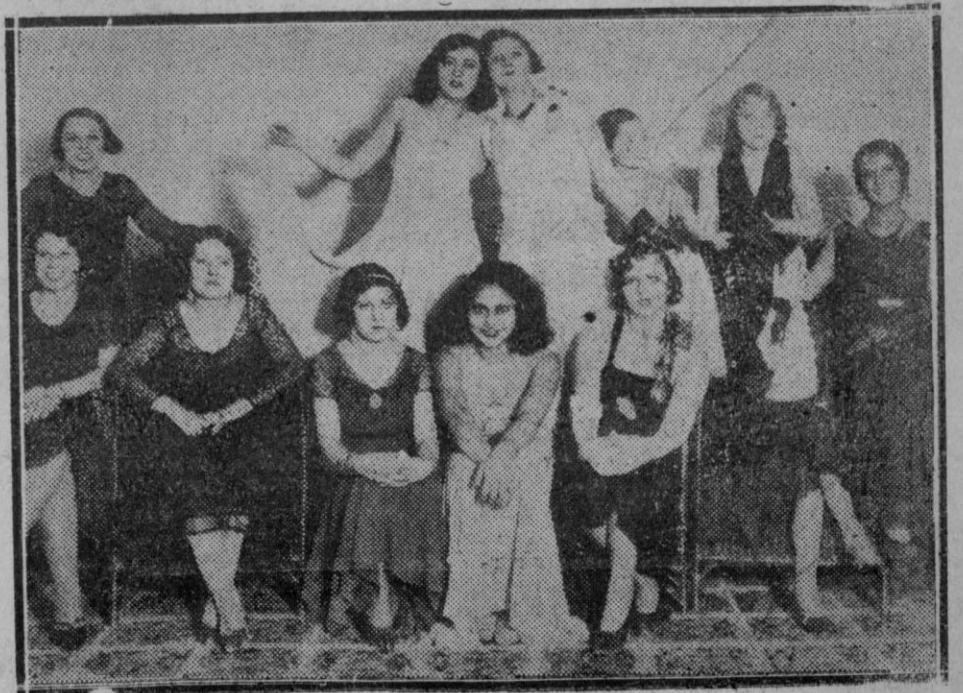
MADRID.—Grupo de señoritas que se presentaron al concurso de belleza para elegir "mis Madrid 1932".

Ya hay en la Sierra hermosos mataderos modernos y magníficas fábricas