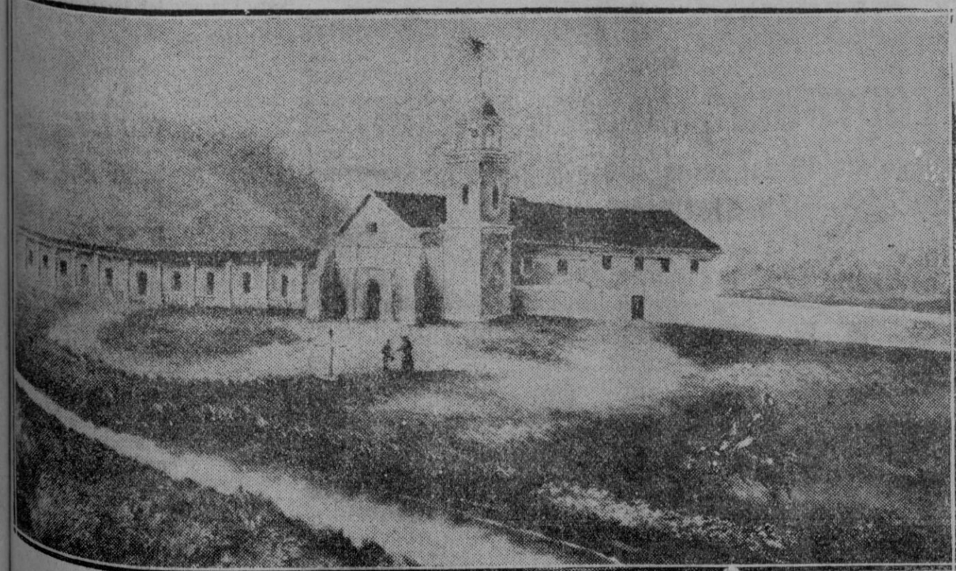
La Misión de Santa Cruz