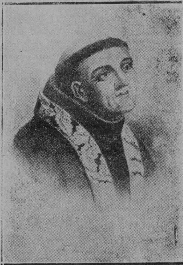
Fray Junípero Serra

Así lo interesamos en pro de los intereses de Palma, que con ello puede ver cumplidas añejas aspiraciones por las que muchas veces ha propagado.