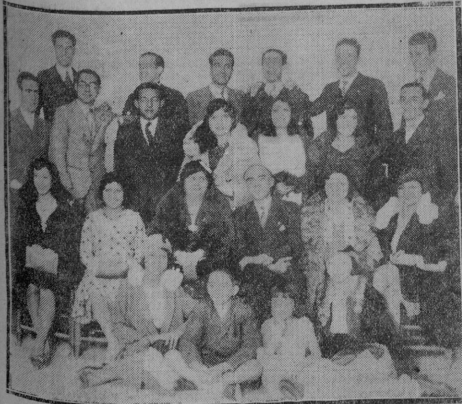
La agrupación Nacional Declamación y Canto, que ayer inauguró su segunda temporada en el teatro de la Comedia, destinando los beneficios de esta función, con los de todas las que celebrará mensualmente a la Asociación Matritense de Caridad