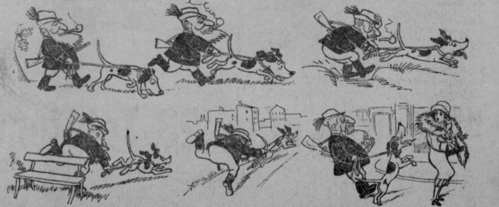
Un buen perro de caza

Y si los grandes proceden con tal egoísmo e inconsecuencia, ¿cómo extrañar que los pequeños coincidieran con los grandes y les excitaran en su odio al árbol? El modesto campesino,