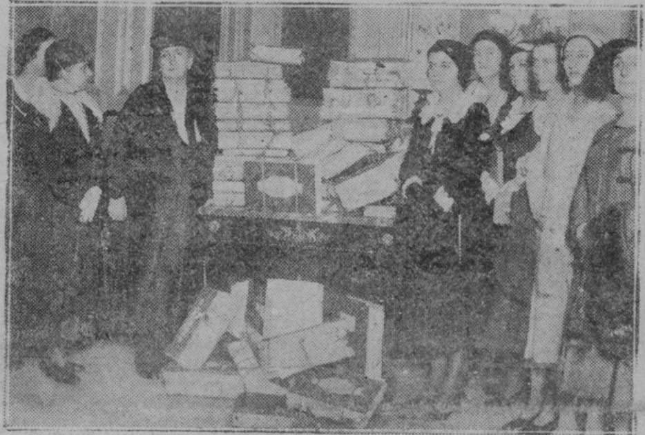
Grupo de señoras que entregaron al señor Besteiro un documento a favor de la religión firmado por un millón cuatrocientas noventa mil mujeres españolas

hoy en plena apoteosis, es el elemento destructor más temible y eficaz de las especies forestales si bien halla en su modestia o pobreza una explicación, que no podrían ciertamente invocar los grandes propietarios. Pero su odio al árbol no reconoce límites. El no quiere más que la tierra que produzca mucho trigo, mucha cebada, muchos garbanos y la limpieza de árboles y de matas dejándola como la palma de la mano, y la más ligera sombra que proyecte sobre su heredad el arbolaje no les quita el sueño y si las raíces ignorantes del sagrado derecho de propiedad, se meten en su linde, se clavan al mismo tiempo en su corazón y pueden llevarle hasta el crimen.