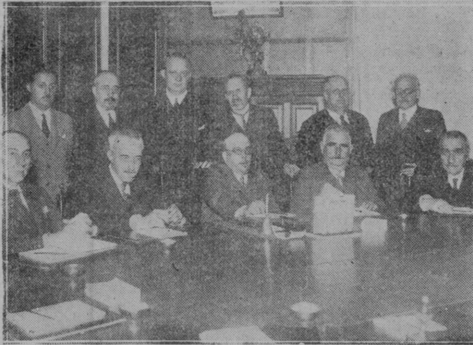
EN EL CONSEJO SUPERIOR DE FERROCARRILES.—Reunión de la Comisión de asesoramiento al Gobierno acerca de la petición de mejora de haberes de los ferroviarios y del modo de arbitrar los necesarios para ello

Los propósitos en que se anima el Gobernador señor Cajal, satisfacen plenamente los anhelos de esta región, y a no dudar encontrarán por parte de los elementos de esta provincia una entusiasta cooperación para todas las gestiones que hayan de realizarse a fin de conseguir del Estado el arreglo intenso y rápido de nuestras carreteras.