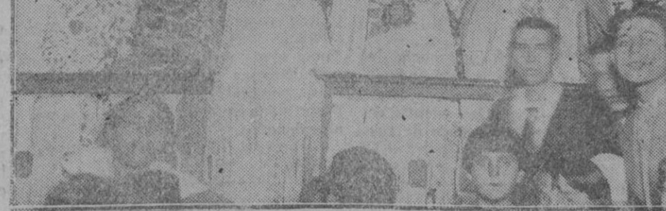
BARCELONA.—La Fiesta Mayor de la barriada de Gracia se celebró con mucha animación, siendo uno de los festejos más lucidos el concurso de mantones celebrado en la plaza del Sol

Por el camino Unamuno-Baroja está España. La verdadera Iberia.