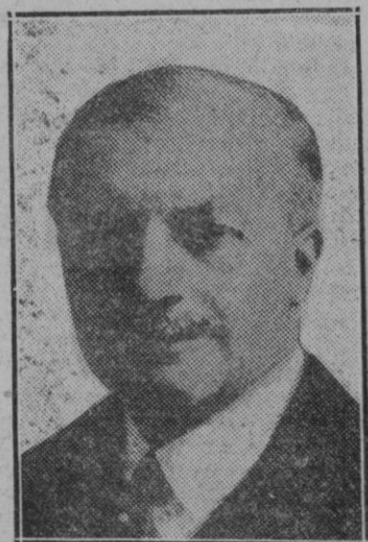
M. Maginot "Candidato a la Presidencia de la República francesa"

del precio de usura y de deudas y de tributos y de depreciación de moneda a que pagan las liberalidades de la política madrileña. Romper el cerco de los financieros y ahuyentarnos de España es una obra nacional. Será preciso para poder consumir que cada región se persuada de que su deber y su responsabilidad están en no mendigar mas al Estado y en bastarse cada una a sí misma, poniendo en el esfuerzo propio la creación de su propia personalidad.