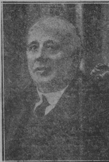
MADRID.—El prestigioso magistrado don Diego Medina designado para la presidencia del Tribunal Supremo de Justicia, por el Gobierno de la República

co de los financieros y ahuyentarnos ante España un momento de acción que pudiera llamarse histórica: demostrar, probar con hechos que estos errores económicos, viejos como el régimen, no se engendran en una incapacidad natural, indestructible del Estado unitario, del Estado centralista, del Estado acaparador de funciones, ante el que las comarcas de España se disputaban las migajas del favor: las concesiones de dinero para exposiciones, confederaciones híctas de los financieros, confederaciones híctas, etc., sin querer enterarse