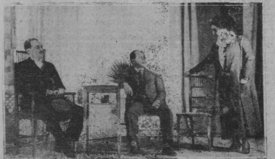
TEATRO LARA.—Una escena de la obra "Paca Féroles,"

la retirada de los créditos concedidos a Alemania por los Estados Unidos, después del colapso de 1929. Hay una crisis agrícola considerable, que reduce el poder adquisitivo de las clases campesinas; la falta de pedidos suficientes para que las grandes empresas industriales trabajen normalmente y el problema del para forzosos. Además, las restricciones impuestas por otras naciones a la mano de obra extranjera, han disminuido la emigración y, finalmente, la nacionalización de la industria ha sido llevada al límite. La con-