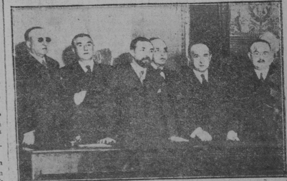
MADRID.—El ministro de Instrucción Pública Sr. Gascón Marín, en la reunión de los rectores de Universidades

Vino el Poder en efecto y vinieron después las elecciones, según es uso en nuestra democracia, y mientras los intelectuales seguían estudiando política y sociología, para su mayor cultura y lustre de su país, fueron ungidos padres de la Patria, los hijos, sobrinos y amigos de los grandes hombres que regían nuestros destinos. No sabían ni entendían de cuestiones políticas y sociales, ni de pronunciar discursos, ni de escribir libros, ni artículos de fondo; y maldita la falta que les hacía, por que es lo que ellos también se di-