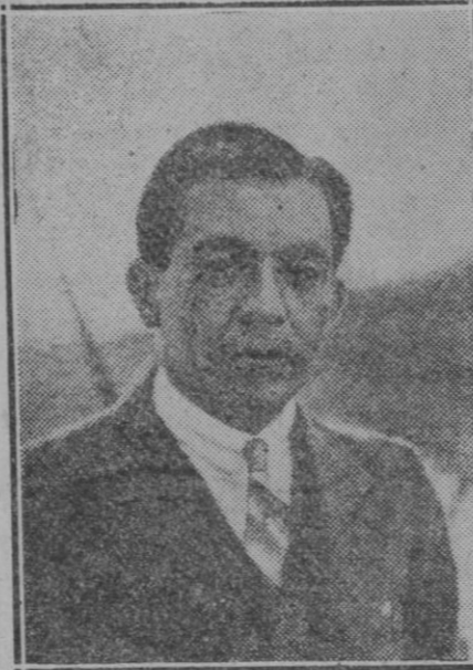
SANTANDER.— El político peruano, el hombre que arrojó del Poder al dictador de Leguía, en el barco que lo trajo a Santander

JOSE MARIA VI. O Barcelona, abril de 1931. (Prohibida la reproducción).