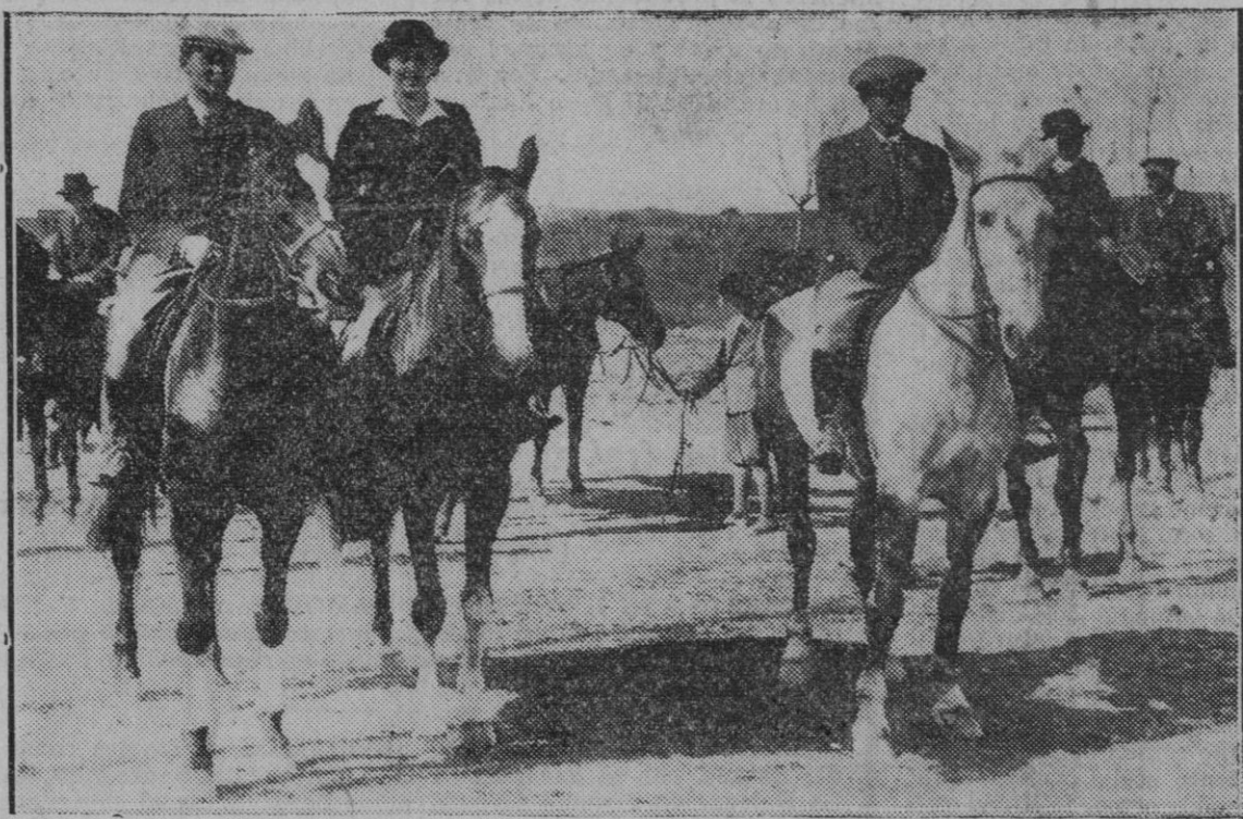
BARCELONA.—Cross Country ecuestre celebrado en las carreteras de Caldas y Mataró, organizado por el Real Jockey Club, y en el que han tomado parte distinguidos deportistas barceloneses. La salida de los concursantes.

Por ello somos partidarios de que sea organizada debidamente la feria de Ramos, no vinculándola a un lugar determinado sino en el lugar donde mejor se pueda desarrollar, proyecto este sobre el cual debería oportunamente insistir el Ayuntamiento.