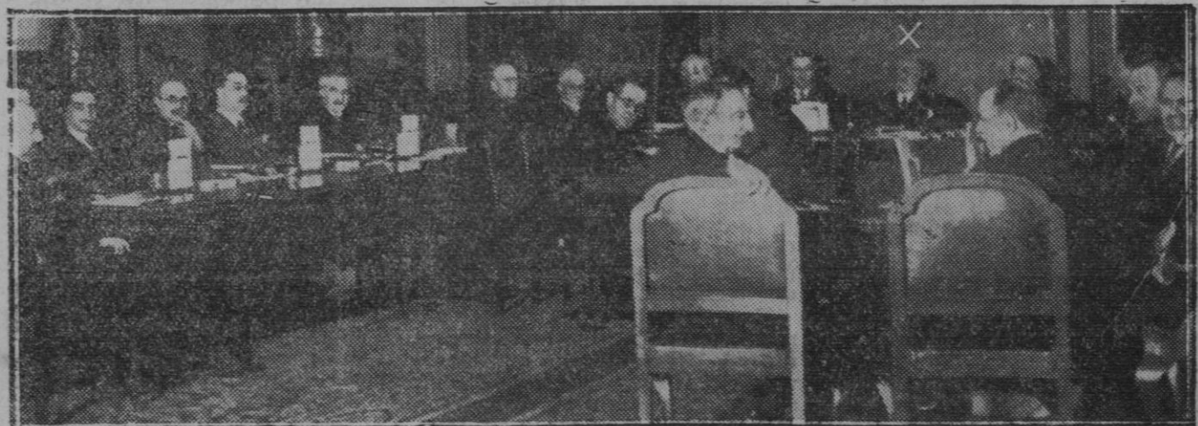
MADRID.—En el Ministerio de Fomento: Reunión del pleno del Consejo Superior de Ferrocarriles bajo la Presidencia del señor Cierva.

Este libro es la clave de la expedición polar del dirigible "Italia" cuya trágica odisea suscitó los más encontrados comentarios, ya avalorado con profusión de auténticas fotografías. 15 PESETAS EJEMPLAR. De venta en la librería Tous.