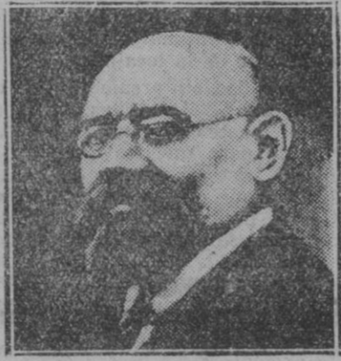
El ex-canciller austriaco Renucz, una de las personalidades más destacadas del socialismo de su país, que ha sido electo diputado en las recientes elecciones celebradas en Austria

“Mucho me agrada que haya usted hallado también a la marquesa de Aranda. En la creación de la marquisa,