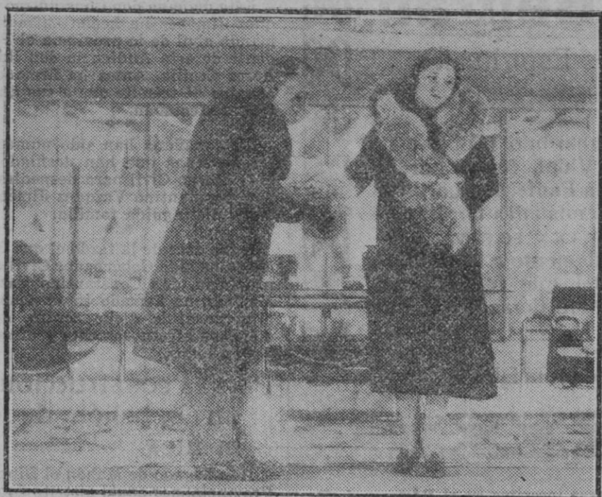
MADRID.—Una escena de "Siegfried", que está alcanzando gran éxito en el teatro Fontalba