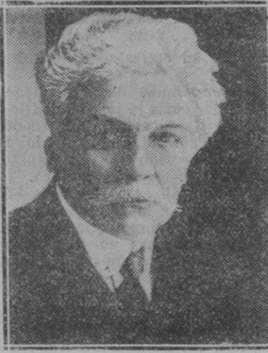
BRUSELAS.—M. Jaspas, primer ministro belga que recientemente ha presentado la dimisión de su gabinete