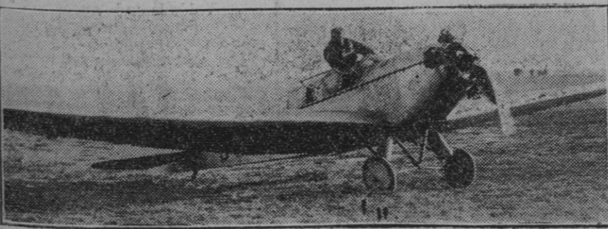
La avioneta "C. 4.", que resultó destruida al chocar con unos cables cuando intentaba tomar tierra en el aerodromo de Lyon.

No somos nosotros amigos de fomentar pesimismo. Desde hace diez años los alarmistas de los grandes rotativos se recrean acumulando nubarrones en el horizonte internacional amenazando de continuo con una