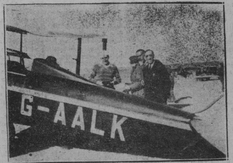
CHALLENGE INTERNACIONAL.—Las señoritas aviadoras alemanas al llegar al Aerodromo Palmar de Zaragoza.

En cambio, en el Tribunal de Divorcios, una señora, al sentarse en el banco de los testigos para declarar, pidió permiso al juez para quitarse el sombrero porque era algo sorda y con las orejas tapadas no entendía bien las preguntas que se le hacían. El juez, Bateson, le contestó: "Encantado, señora. Mi deseo sería el que ninguna mujer se presentara en el banco de los testigos o en el de los acusados tocada de sombrero, porque esto sirve, en la mayoría de los casos, para ocultar la verdadera expresión del rostro."