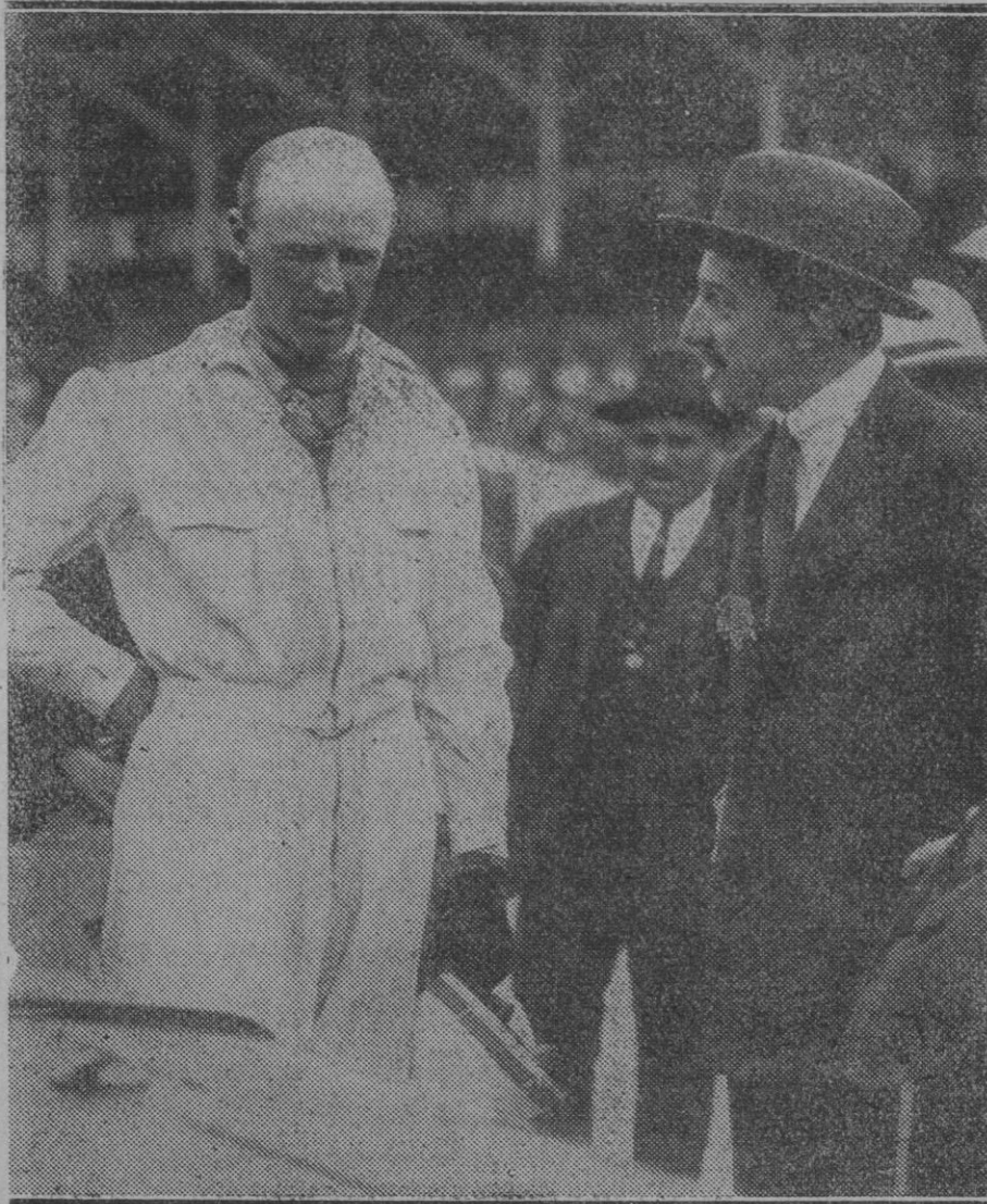
EXTRANJERO.—El famoso corredor automobilista inglés Sir Henry Segrave, que acaba de encontrar la muerte al batir el record de velocidad por agua.—En la foto se le ve conversando con S. M. el Rey de España en el circuito de San Sebastián

¿Porqué, empero, no da estado oficial a su propósito que tan satisfactorio sería a cuantos anhelan el progreso y embellecimiento de nuestra ciudad?