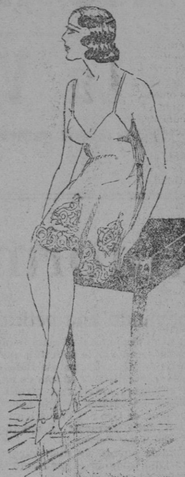
CAMISA.—Atractiva camisa en toile soie. Aplicaciones de encaje de A'lençon