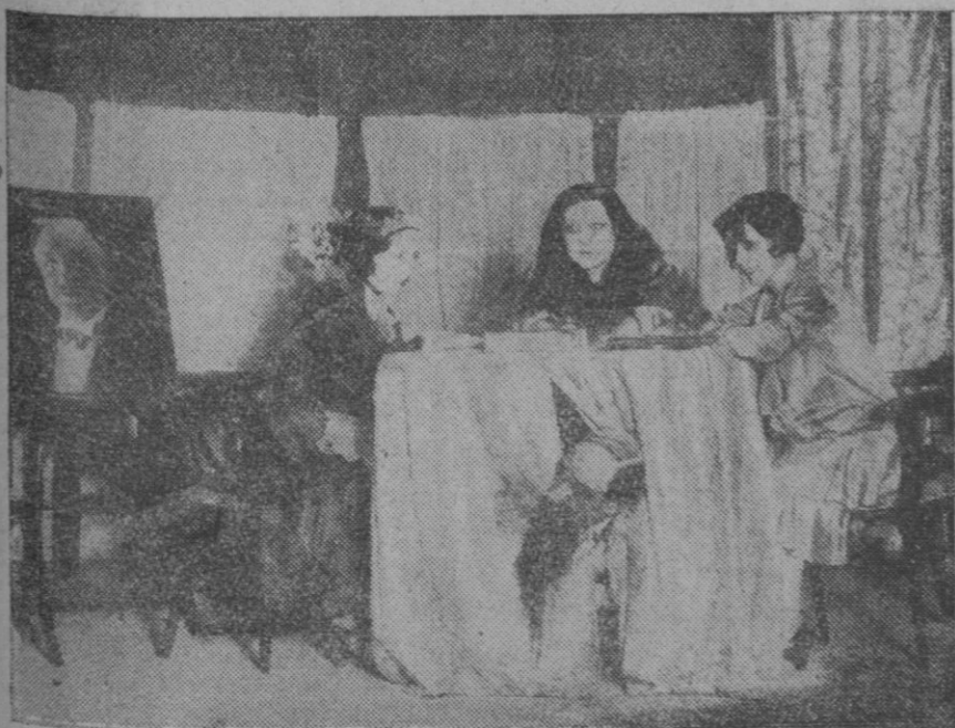
MADRID.—Una escena de la obra "Los que teníamos cincuenta años," estrenada en el Teatro Cómico