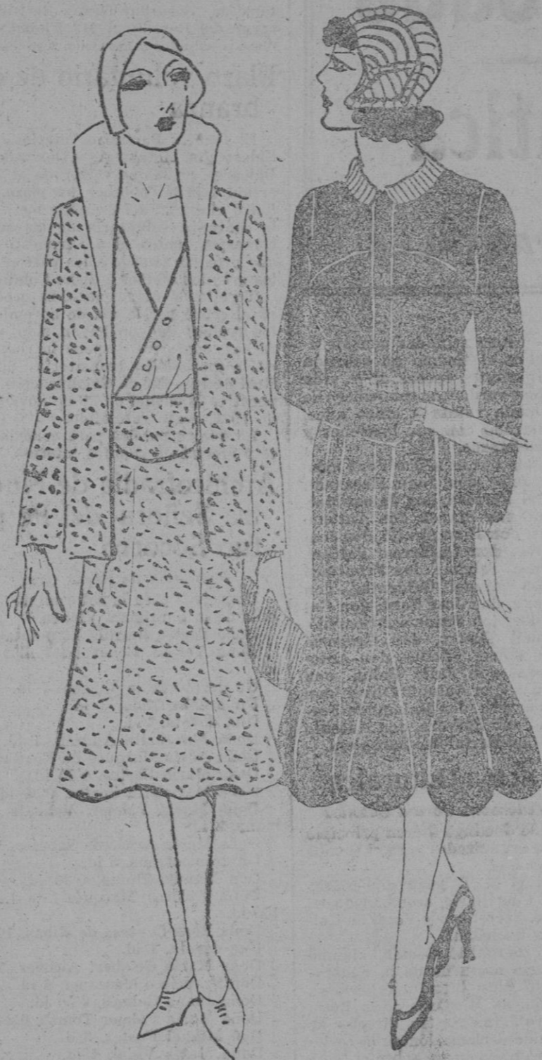
DOS BONITOS Y ELEGANTES MODELOS.—Ensemble en lana inglesa con blusa de crepón romano.—Vestido de tarde con velours azul