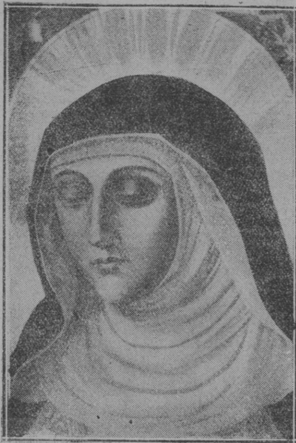
La inclita valldemosina Beata Catalina Thomás, cuyo proceso de canonización ha terminado felizmente, y declarada su santidad, elevada a los altares, con singular regocijo de Mallorca, que la venera con gran devoción. El cuerpo de la nueva santa se guarda en el convento de Santa Magdalena de nuestra ciudad.

Lo que no puede ser aspiración es nadie, y si lo es no puede tenerse ni por lógica ni por legítima, es que se den facultades legislativas a organismos que no sean las Cortes, y a que innecesaria y abusivamente se agobie a la riqueza activa con cargas cuantiosas y cuya inversión ningún bien general reporta.