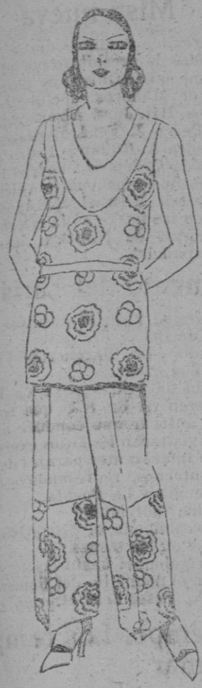
PIJAMA.—Elegante pijama en crepé de China estampado y liso