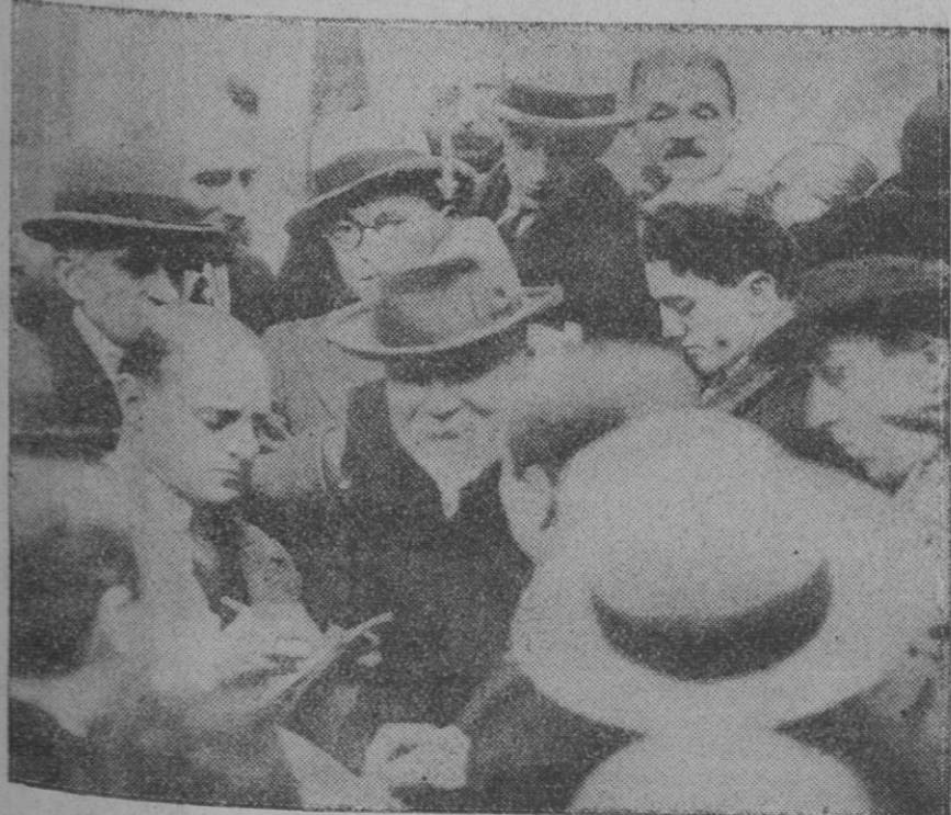
EXTRANJERO.—Con motivo de la crisis política en Francia meudean las visitas de los prohombres al Elíseo.—He aquí a Raymond Poincaré, rodeado de periodistas a la salida del Palacio Presidencial