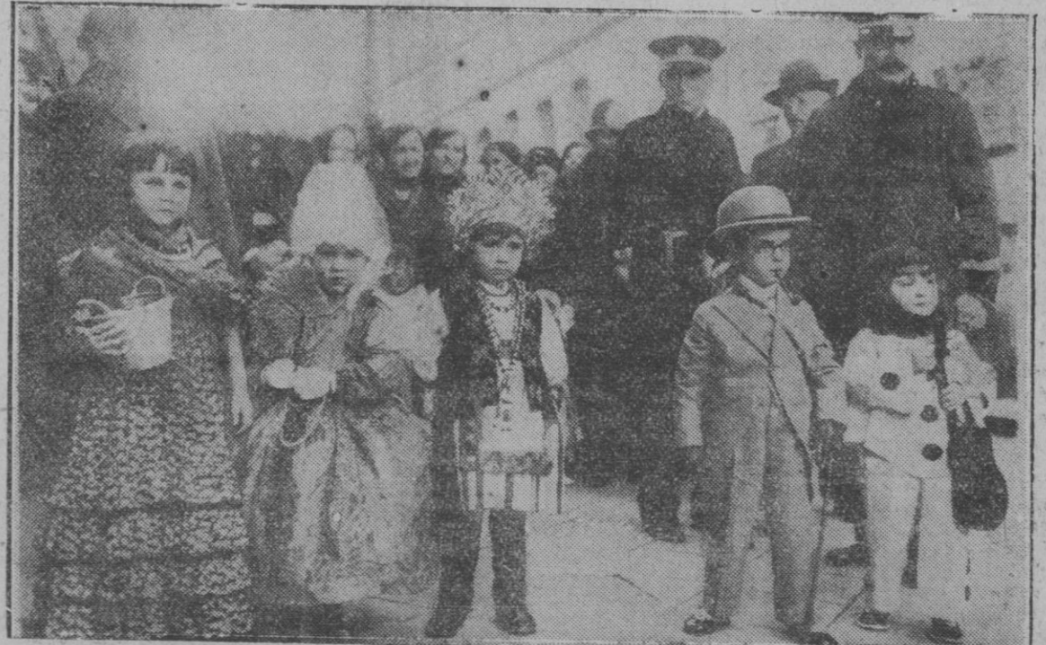
BARCELONA.—Concurso de trajes de niños en el Teatro Novedades