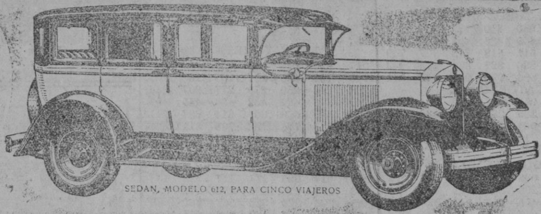
SEDAN, MODELO 612, PARA CINCO VIAJEROS