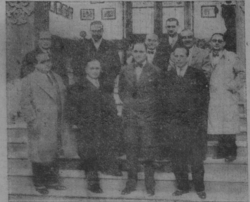
SEVILLA.—Un grupo de los comisionados americanos durante la visita que hicieron al hermoso Pabellón de la República Argentina

La obra del Sr. Aldevi era ya conocida del público de esta ciudad, por haber expuesto el año pasado sus telas en las "Galerías Mallorquinas", así es que como hacía tan poco tiempo, la exposición careció de interés,