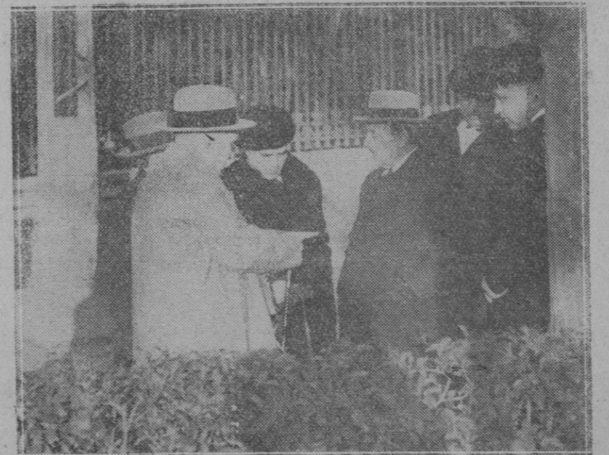
MADRID. — Sigue insistiéndose que el muerto hallado en la Cuesta de la Vega perdió la vida, no por haberse dado un golpe al caer contra un hierro sino por haberle dado un golpe otra persona, constituyendo un asesinato. La adjunta fotografía se ve al juzgado practicando una inspección ocular.