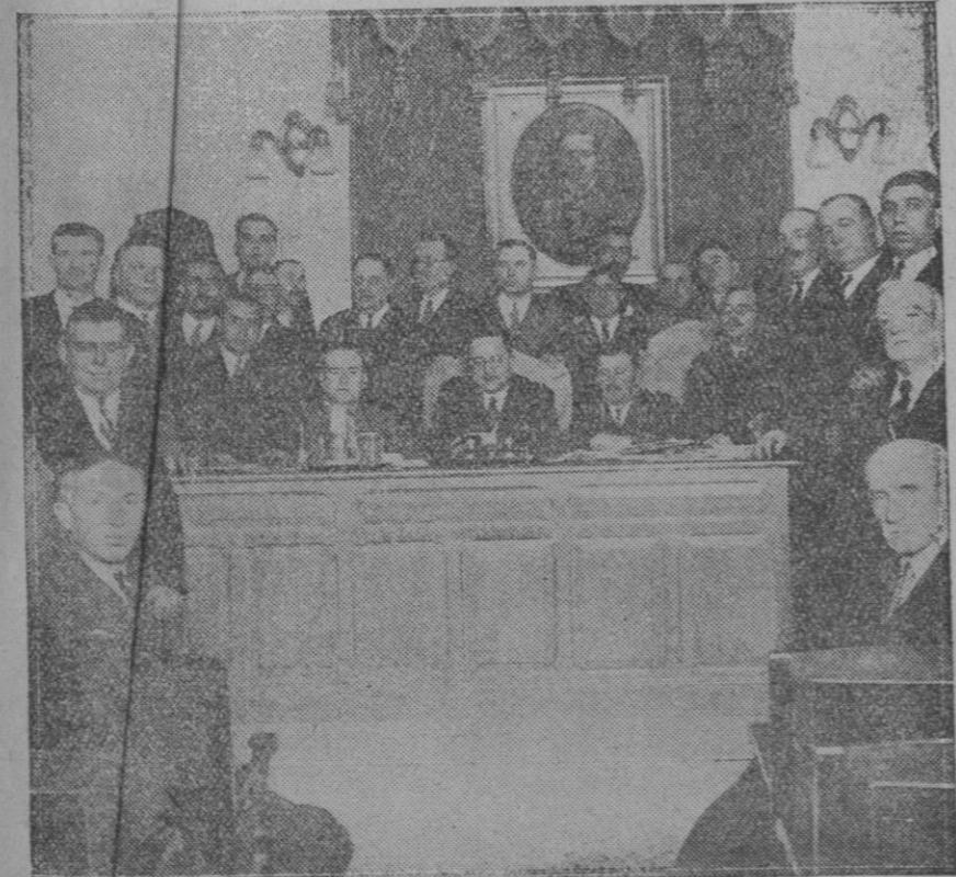
ASPIRACIONES DEL MAGISTERIO ESPAÑOL. — Sesión de apertura de la Asamblea de la Federación Nacional de Maestros verificada días pasados