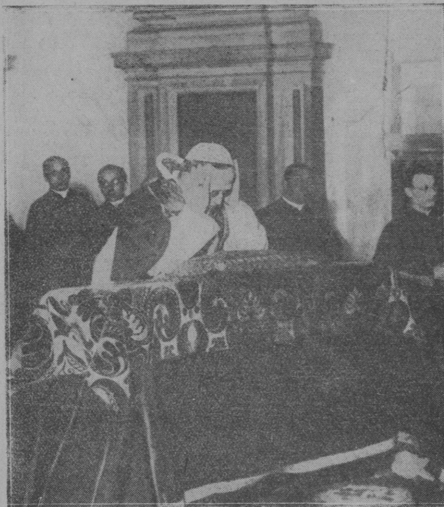
Por primera vez, desde 1870, el Papa salió del Vaticano, y fué celebrada una misa en la iglesia de San Juan de Letrán. Esta salida acaba de hacerla Pío XI, al que vemos aquí, en la fotografía, orando ante el altar llamado de las "Confesiones", donde la misa fué oficiada. En dicho altar sólo pueden decir misa los jefes de la Iglesia.

Por estimarlo así aplaudimos estas medidas que desde el día primero se han puesto en vigencia, medidas que aun cuando en la práctica tuviesen que ser modificadas para que en ningún caso puedan llegar a constituir un obstáculo para el fácil desarrollo de nuestra expansión comercial, deben ir por otra parte extendiéndose en forma que de una manera efectiva alcance a todos los comercios, así al que se realiza con el extranjero, para que se consolide el crédito de nuestras producciones, como el que se desarrolla en el interior, en defensa de los intereses de los consumidores.