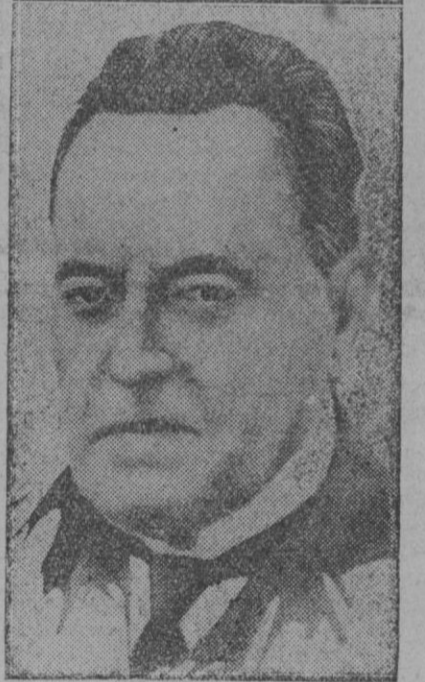
El Presidente argentino Hipólito Irigoyen que afortunadamente salió ileso de un odioso e innecesario atentado de que fué objeto por parte de un ácrata