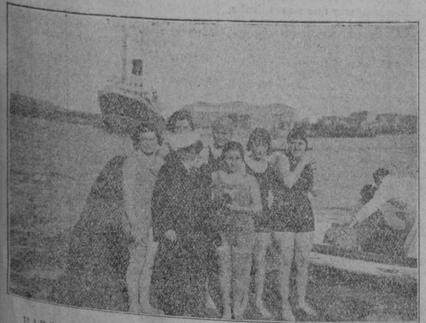
BARCELONA.—Copa "Navidad" de Natación. Interesante grupo de nadadoras que tomaron parte en las carreras verificadas estas pasadas fiestas.