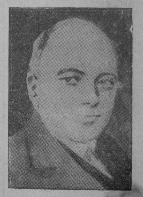
Moldenhaners, ministro de Economía en el Gobierno del Reich que pasa a Hacienda en sustitución de Hilferding