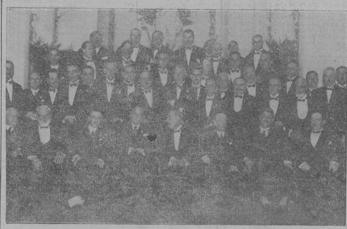
MADRID.—Numeroso grupo de comensales rodeando, después del magnífico acto, en el Ritz, el Presidente del Consejo y el festejado señor Peman

Los que tenían precisión de hacer el viaje o los que disponían de tiempo bastante, embarcaban en la expedición siguiente; pero los que no se encontraban en tales condiciones renunciaban a ello.