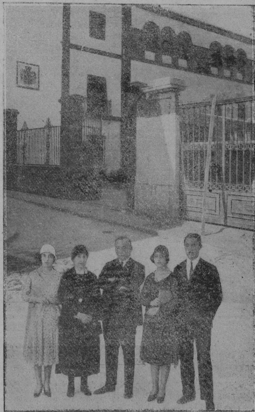
JEREZ DE LA FRONTERA.—Entrega de la casa en que nació el Presidente del Consejo.—La fotografía representa al General Primo de Rivera, con su hermana doña María y sus hijos Pilar, María del Carmen y Miguel, ante una de las fachadas laterales de la citada casa, en la que el general confía pasará días de placido descanso.

Significando el doctor Mac Coy que existe una deplorable escasez de verduras para la mesa, cuyo valor alimenticio se ignora generalmente en los países visitados por él. ¿Se cultivan en menor proporción de la debida? ¿Se ignora su valor higiénico? ¿O parece de mal tono servirlos a un huésped, aunque se consuman diariamente en la intimidad de la vida familiar?—preguntamos nosotros—. Acaso hay un poco de todo ello. Una de las pesadillas que me atormentan cada vez que decido tomar un pasaje para Europa es la visión adelantada de las comidas con tres o cuatro platos de carne, en que las verduras brillan por su ausencia y las frutas por su escasez, que habré de deglutir heroicamente respondiendo a las mejores y más cordiales intenciones, y de las cuales saldré— aunque, a Dios gracias, posea un estómago capaz de digerir bloques de granito—pesado, aburrido e inútil duran-