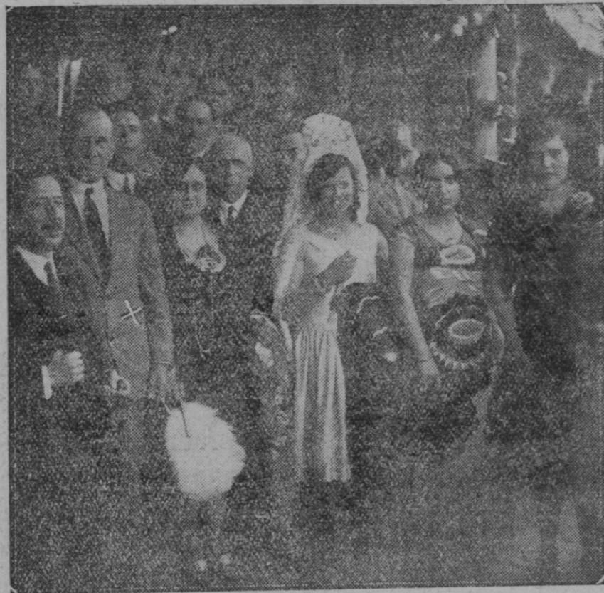
MURCIA.—Las reinas de la belleza, acompañadas del Ministro de Marina señor García de los Reyes, y las autoridades, presidiendo la corrida goyesca, celebrada en la plaza de Toros de dicha capital.

Por ello, al recordar aquel propósito, y al reflejar una vez más las quejas que el vecindario formula contra el estado de dicha calle, nos interesamos para que tal mejora se lleve a cabo cuanto antes en beneficio y para comodidad del vecindario.