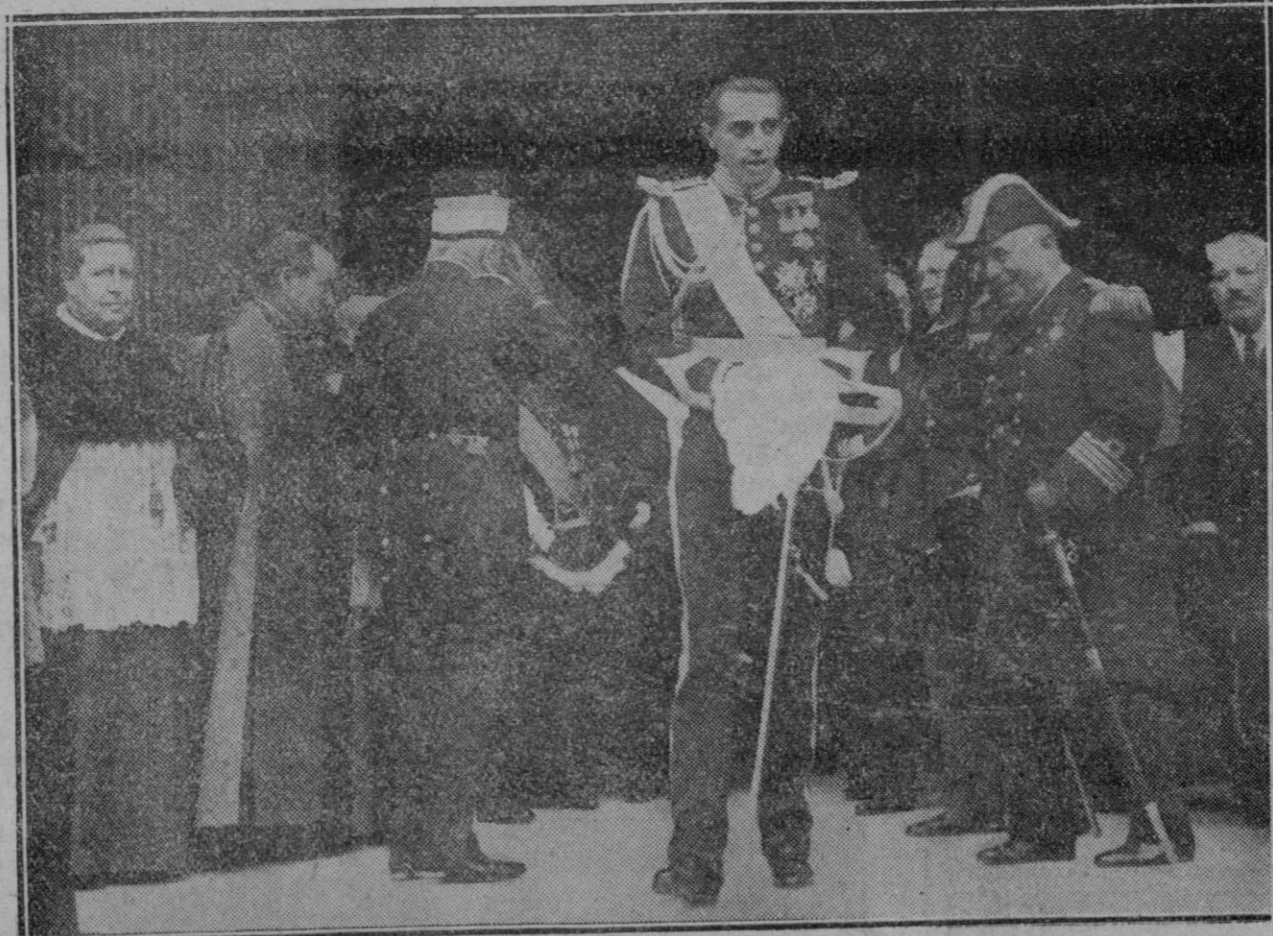
MADRID.—El Infante don Jaime saliendo de la Iglesia de San Francisco el Grande.