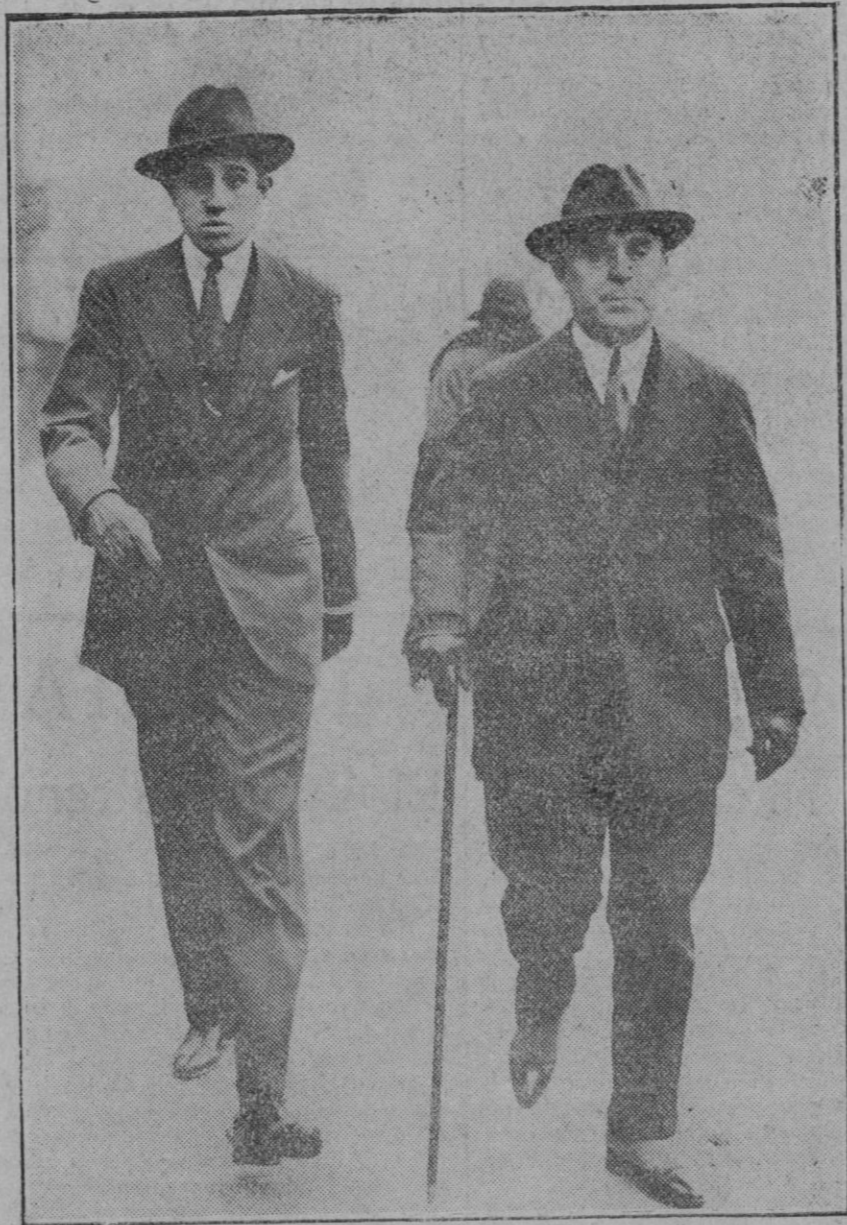
El Infante don Jaime paseando por las calles de Londres.

bres batiéndose con singular denuedo y no menos singular mala suerte.