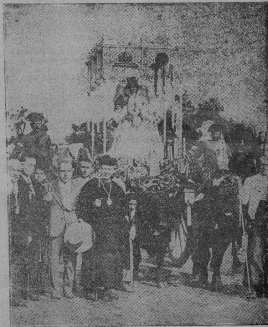
SEVILLA.—La romería de Quintillo, cuyo paso fué presenciado por la Familia Real y general Primo de Rivera.

Por su parte, nuestro querido colega «El Debate» publica hoy los siguientes informes de San Sebastián: