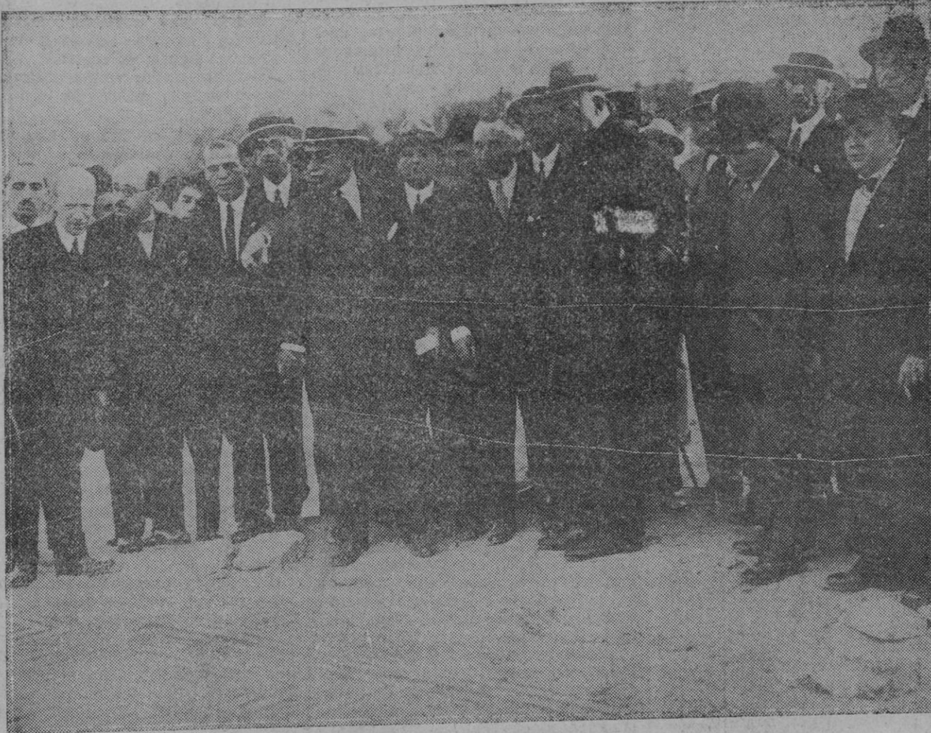
SEVILLA.—El general Primo de Rivera, acompañado de varias personalidades, viendo las últimas excavaciones realizadas en las ruinas de Itálica.

Bilbao.—Desde hace algún tiempo venía tratando el doctor Errazu, de