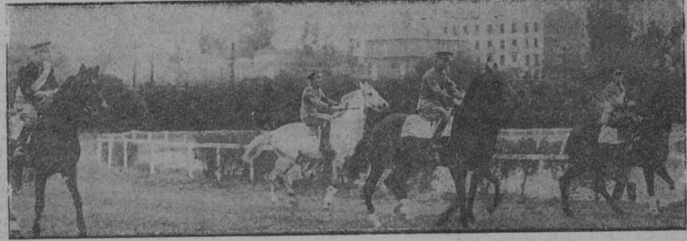
MADRID.—Los participantes en el «handicap» militar, premio Romero, preparados para la salida, en el Hipódromo de la Castellana.

Para el próximo jueves, fiesta de la Ascensión, se prepara en el mismo campo hipico una gran tirada en la cual se disputará una hermosa y artística copa ofrecida por la Real Sociedad Hipica de Mallorca. Dicha tirada se celebrará por la tarde.