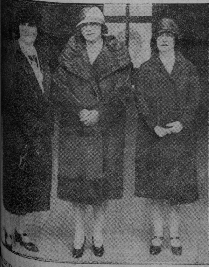
—Damas del Comité Femenino de Mejoras Sociales de Mallorca, en el momento de salir de Palacio, después de haber sido recibidas en audiencia por Su Majestad la Reina doña Victoria.