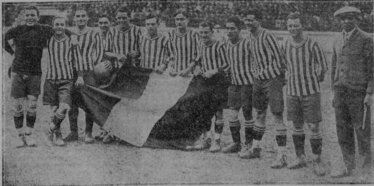
VALENCIA.—El equipo argentino «Club Sportivo Barracas», que efectúa una «tournée» por Europa, momentos antes del partido jugado contra el equipo local.