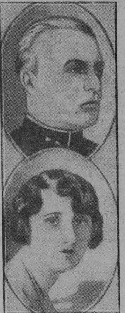
CSLO.—El Príncipe Olaf, heredero de trono de Noruega, y la Princesa Marta de Suecia, que han contraído matrimonio.