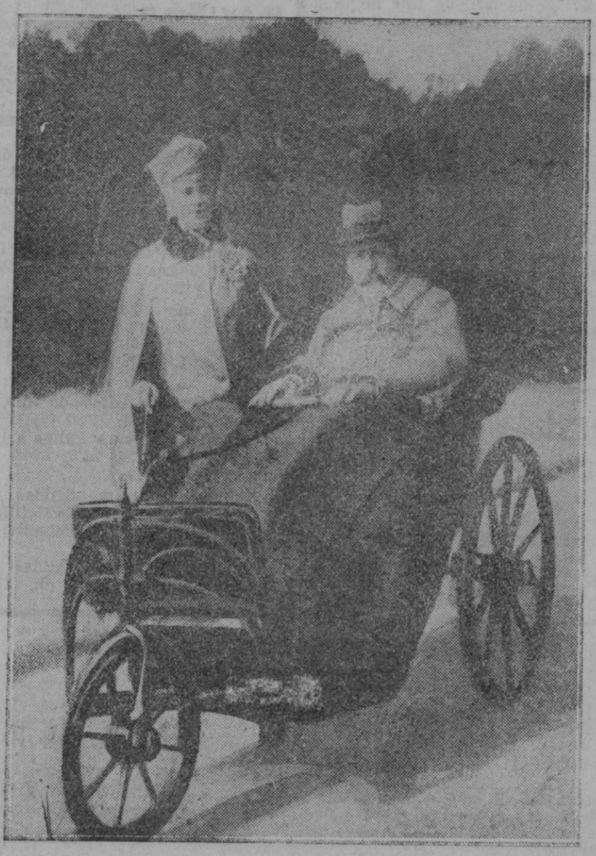
Su Magestad el Rey Jorge V de Inglaterra, tomando el sol en los jardines de Graigweil House, donde pasa el periodo de su convalecencia.