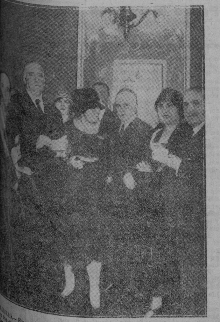
En el local de la «Unión Ibero Americana» se ha celebrado una noche de honor de los profesores argentinos que se encuentran en un viaje de estudios, al que asistieron el Presidente del Consejo de Instrucción Pública, el Embajador de la Argentina y otras distinguidas personalidades.

Mirando al interés general de la provincia y en particular al de la industria de transportes, hemos de abogar una vez más en pro de la constitución de un Patronato Provincial de Firms Especiales, y consecuentemente hemos de aplaudir toda gestión, todo trabajo y todo estudio que a ello se encaminen.