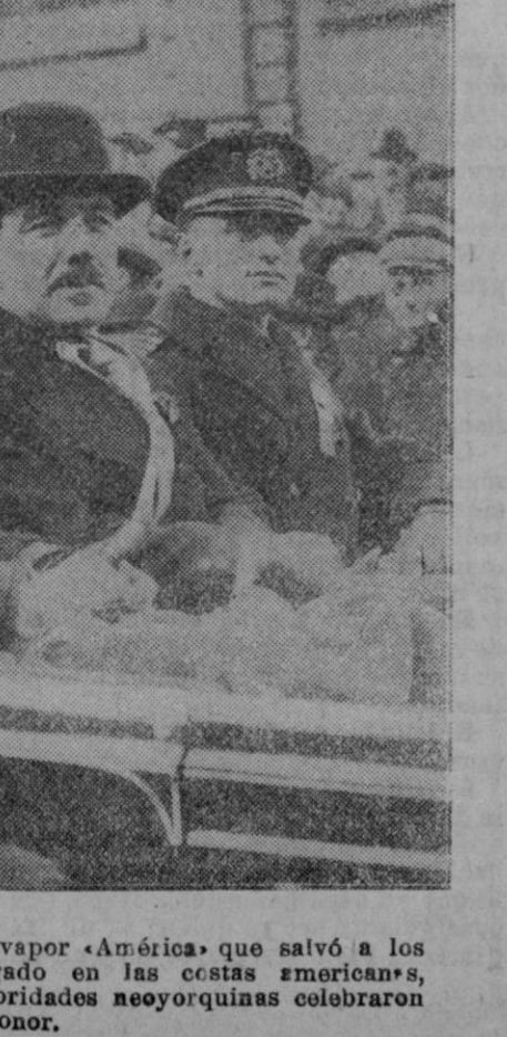
NEW YORK.—Los oficiales del vapor «América» que salvó a los naufragados del «Florida» en las costas americanas, en la recepción que las autoridades neoyorquinas celebraron en su honor.

—Tiene usted razón; pero a veces no hay más remedio que infundir ánimos al paciente.