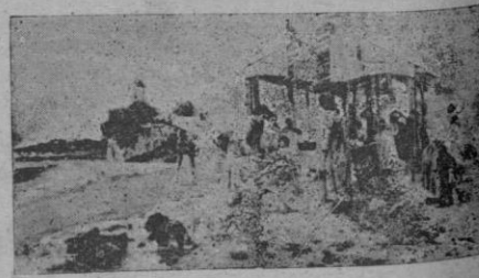
El Moro de la Calle de Joveilanos

El Jonquet y sus molinos, tienden a desaparecer. Las grúas y las dragas trabajan quitando el lodo. Pronto habrá un paseo marítimo, digno de la ciudad. Y los pintores con sus caballetes no podrán buscar en la ensenada de aguas tranquilas y grises, la belleza del paisaje. Proporcionamos hoy a la vista de nuestros lectores una hermosa estampa de principios del novecientos. El lavadero del Jonquet, ya desaparecido que don Juan Pallicer pintara para recuerdo de mejores tiempos característicos de una época peculiar. Así va desapareciendo también la perspectiva de una barriada típicamente pescadora de nuestra ciudad.