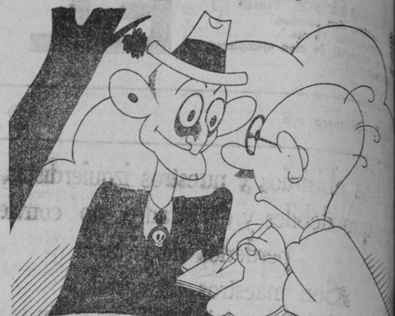
—Y a usted, D. Santiaguillo ¿qué deporte le gusta más? —¿Que deporte? ¡Ay! ¡¡Aquellos tiempos!!