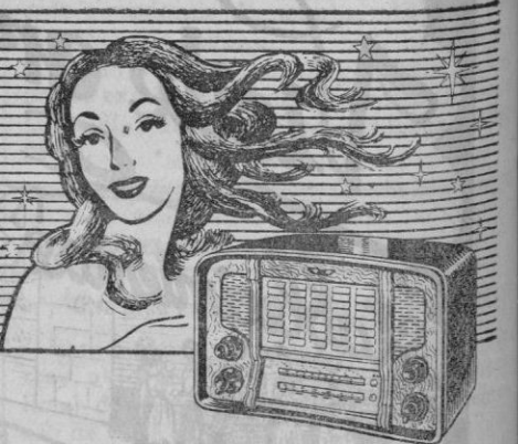
RECEPTOR MODELO «VENUS» último adición a la famosa SERIE ESTELAR

Presenta un nuevo concepto de belleza al iluminarse su frontal a través de la persiana translúcida de que va provisto. Cinco válvulas; dos gamas de onda extracorta, onda pesquera y normal. Dispositivo de sintonía equilibrada.