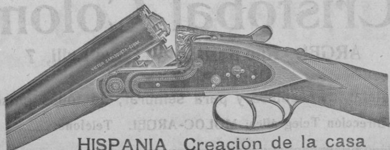
HISPANIA Creación de la casa

Representación en Sóller SAN BARTOLOMÉ, 12