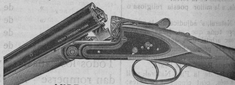
HISPANIA Creación de la casa