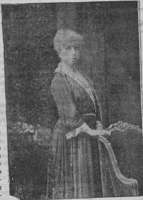
S. M. la Reina madre D.ª María Cristina de Habsburgo-Lorena, que falleció el miércoles de esta semana habiendo constituido su muerte un día de luto para toda España.

La Reina doña María Cristiana había nacido el 21 de julio de 1858, en Gross-Seelowitz (Austria). Sus padres fueron el archiduque Carlos Fernando y la archiduquesa Isabel. Recibió en su niñez una brillante educación, y niña aún fué objeto de una especial distinción por parte de su tío el emperador de Austria, al nombrarla en 10 de octubre de 1876, abadesa del I. y R. convento Teresiano de damas canónicas del Alcázar de Praga.