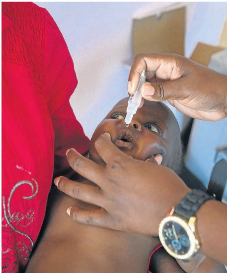
Un miembro de la Alianza realizando labores de vacunación.