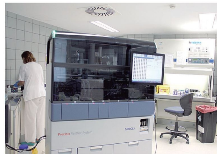
El nuevo equipo podrá realizar hasta 1.000 pruebas PCR diarias.

La nueva tecnología se basa en el análisis de muestras que, tras ser organizadas documentalmente, se introducen con unos módulos automáticos en la nueva máquina que, además de ser capaz de procesar un gran número de muestras, reduce sensiblemente los tiempos para la obtención de los resultados. ■