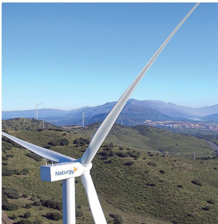
Parque eólico Merengue.

Otra de las dinámicas del pasado ejercicio fue el incremento de la producción de electricidad con ciclos combinados, hasta alcanzar el 21% de la producción total. El incremento de la generación con gas natural se produjo en paralelo a una reducción de la generación con carbón,