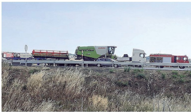
El camión que cargaba una cosechadora afectado.