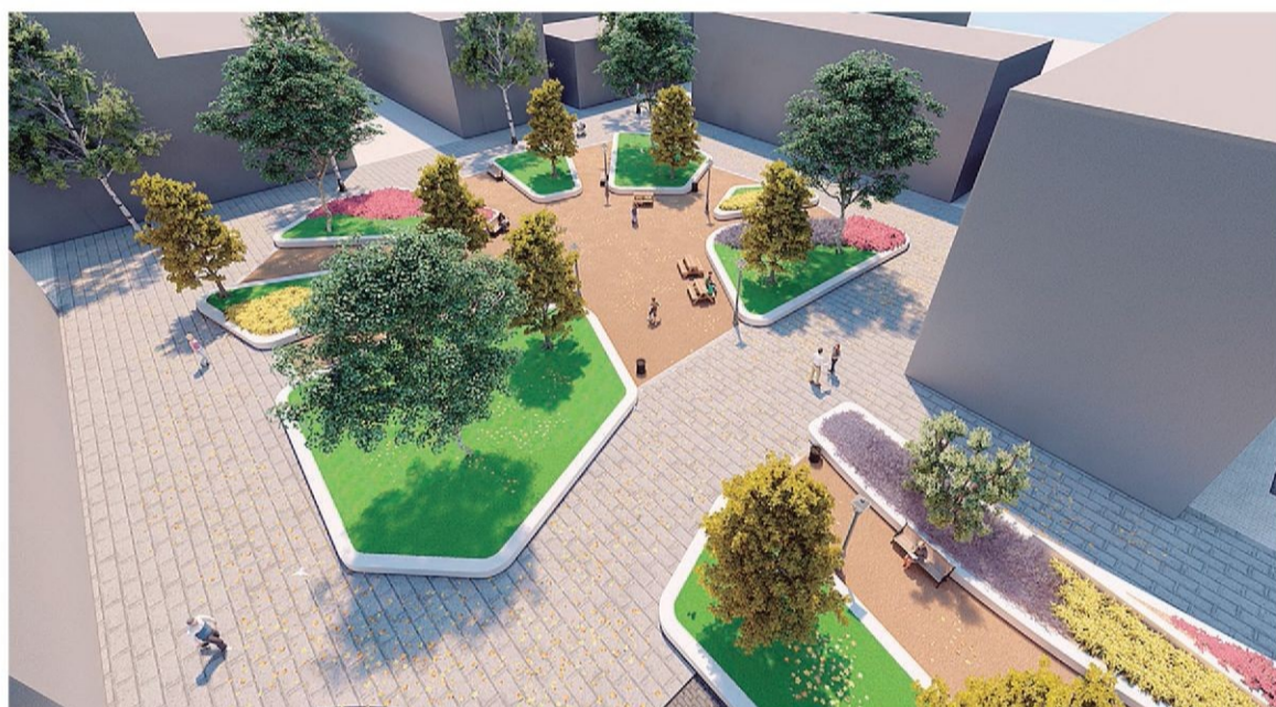
Montaje en tres dimensiones de la remodelación proyectada en la plaza de la Morería del barrio de San Millán.