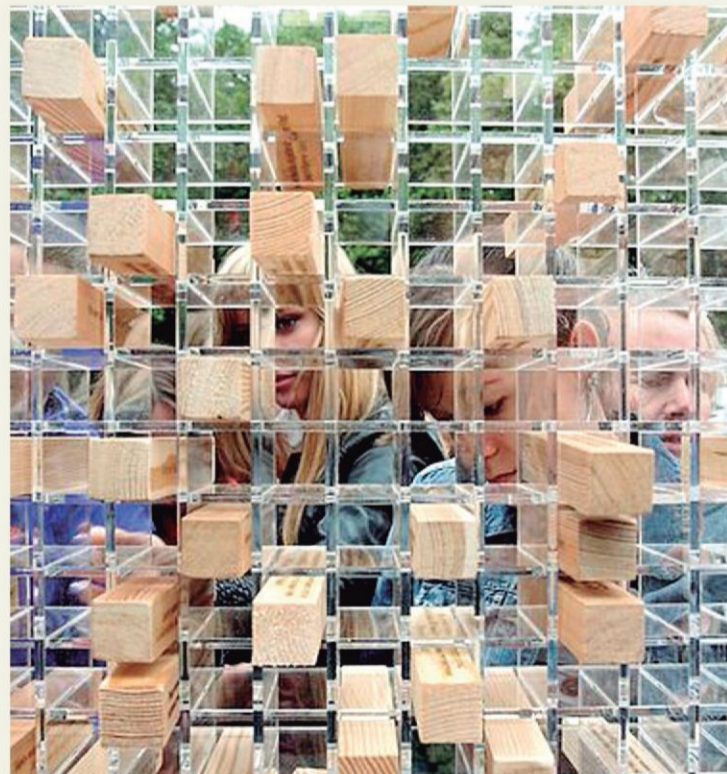
Instalación 'Desaparece el muro' del Goethe-Institut.