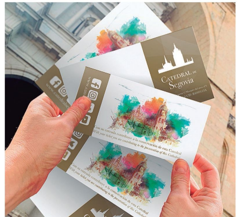
Nuevos tickets de entrada a la Catedral de Segovia.

El objetivo es dar la opción a segovianos y visitantes de visitar el