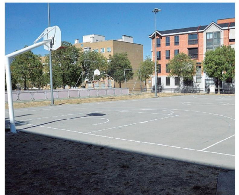
Pista deportiva de Nueva Segovia.

Del mismo modo, la Junta de Gobierno local acordó una modificación presupuestaria para la reparación de pistas deportivas en los barrios de Segovia de 20.000 euros, de las aplicaciones minoradas de 'otros gastos diversos'.