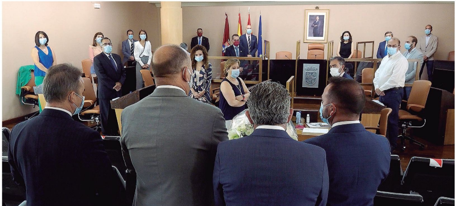
La corporación provincial guardó un minuto de silencio, antes de iniciarse el pleno, en recuerdo de las víctimas del coronavirus.

En el mes de marzo y debido a dicha crisis sanitaria, la atención presencial se vio alterada, viéndose limitada en los consultorios, decisión que los vecinos asumieron con naturalidad, como tantas otras medidas que se han adoptado an-