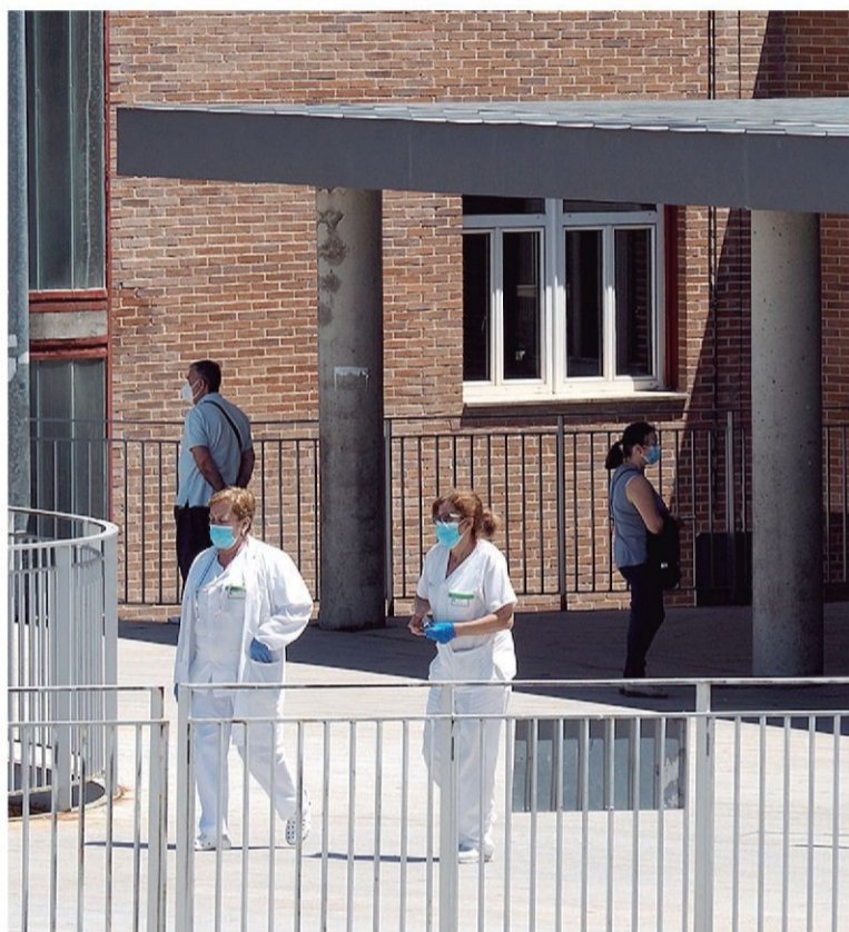
Personal sanitario sale del Hospital General de Segovia.

"Siempre hemos defendido una segunda dotación hospitalaria y a mí me daría igual que hicieran