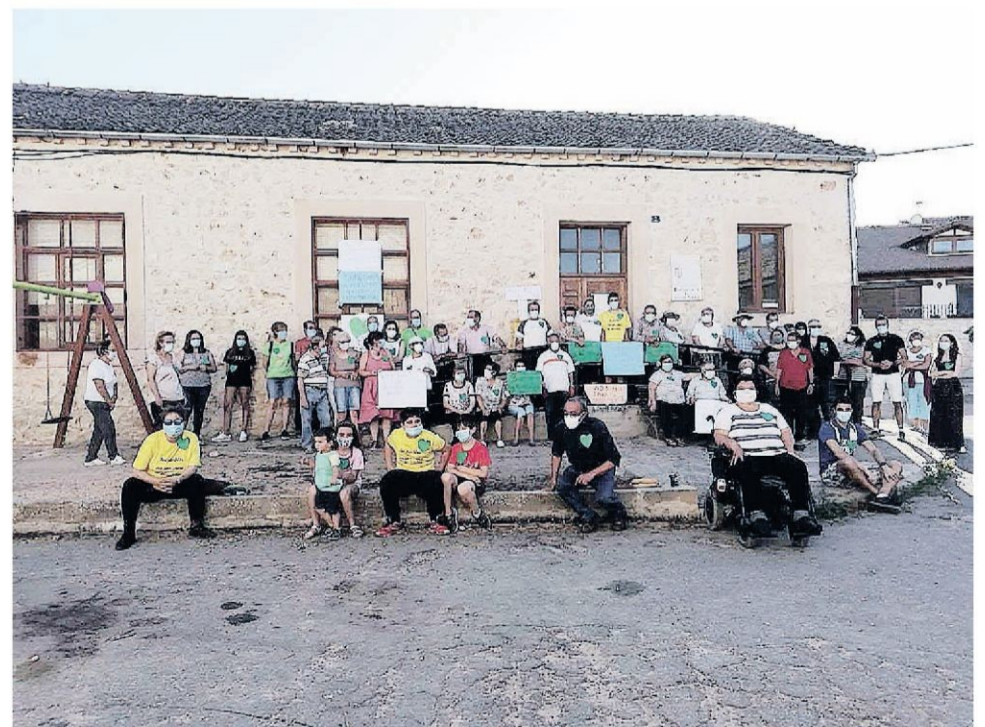
VECINOS DE SAN RAFAEL salieron a la calle para mostrar su oposición a los planes de la administración sobre la sanidad y exigir la reapertura de los consultorios locales, una medida que consideran necesaria para frenar la despoblación rural.