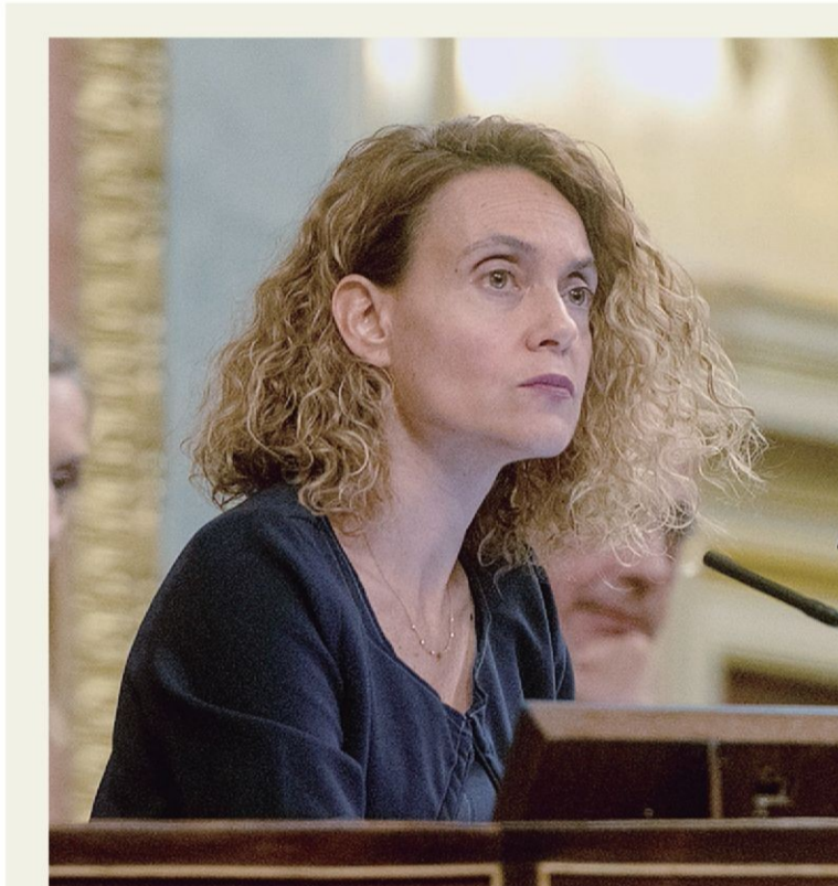
La presidenta del Congreso de Diputados, Meritxell Batet.