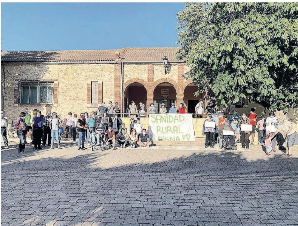
ALREDEDOR DE 80 PERSONAS se congregaron en la plaza del pueblo de Torreiglesias en apoyo de la convocatoria nacional y a favor de la sanidad pública, reclamando la reapertura del consultorio médico local "ya".

Los interesados en publicar en esta sección sus fotografías y textos pueden enviarlos, con 3 días de anticipación como mínimo, por correo, junto con el teléfono y los datos completos a c/ Morillo, 7. 40.002. Segovia, o al correo electrónico: redaccion@eladelantado.com . Las copias fotográficas no se devolverán.