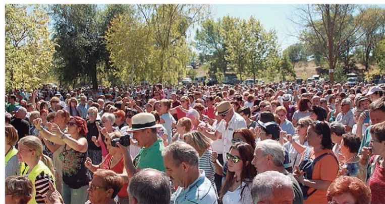
La misa en honor a los carmelitas se celebrará en la pradera.

paña de la Romería de El Henar. A las 19.00 horas de este sábado, decenas de fieles acudirán a la despedida de los carmelitas, que dejan paso a las hermanas carmelitas samaritanas del Corazón de Jesús. ■