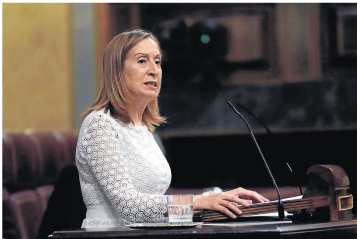
Ana Pastor, portavoz del PP, durante su comparecencia en el pleno del Congreso de los Diputados.

Pastor fue la encargada de anunciar el voto positivo de los "populares" en una intervención en la que, no obstante, consideró "exiguo" este decreto, "casi inexistente", e insistió en la necesidad de mejorarlo en su tramitación con propuestas como una oficina de atención a las