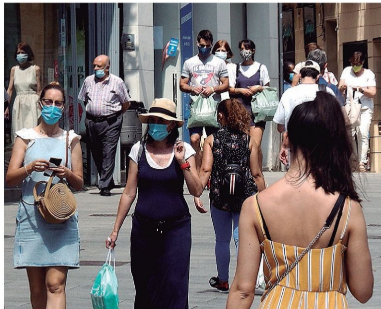
Varias personas pasean por la Calle Real de la capital segoviana.

Por su parte, Segovia volvió a no registrar nuevas altas en las últimas horas, cuando en la jornada anterior se había contabilizado una. Por tanto, su total se