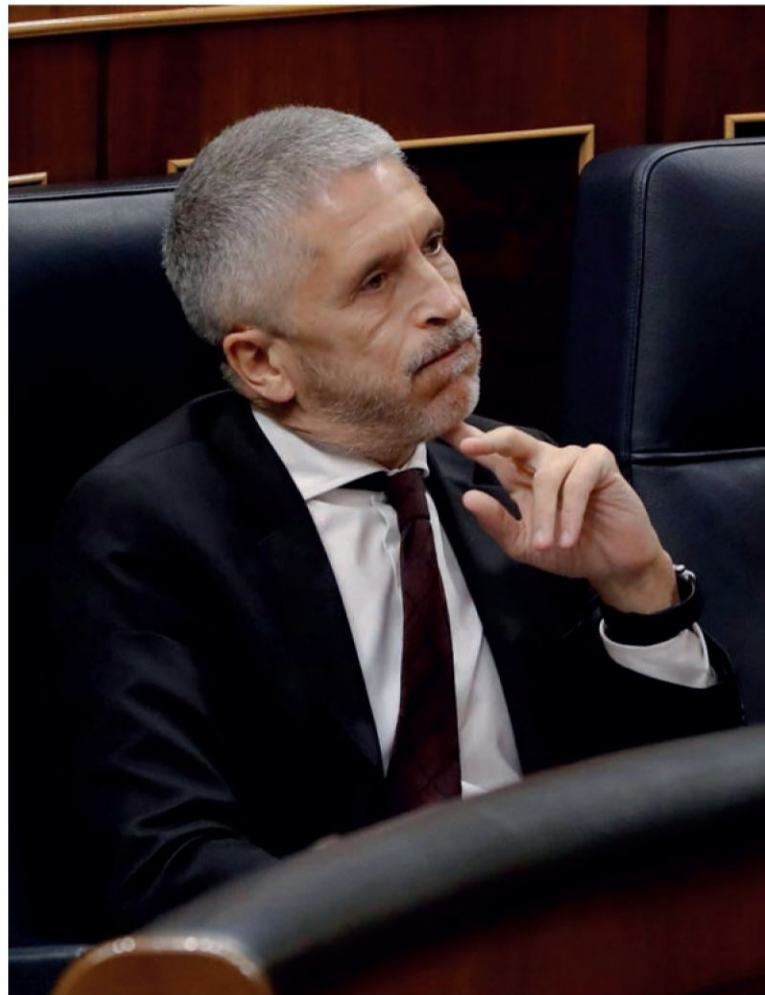
Marlaska, ausente ayer, en el pleno del Congreso del día 17.

Tanto Vox como Ciudadanos, además de UPN, respaldaron la reprobación de Marlaska planteada por los de Pablo Casado, pero no consiguió salir adelante porque el PSOE y Unidas Podemos lograron salvar la cara del ministro con 167 votos frente a 151.