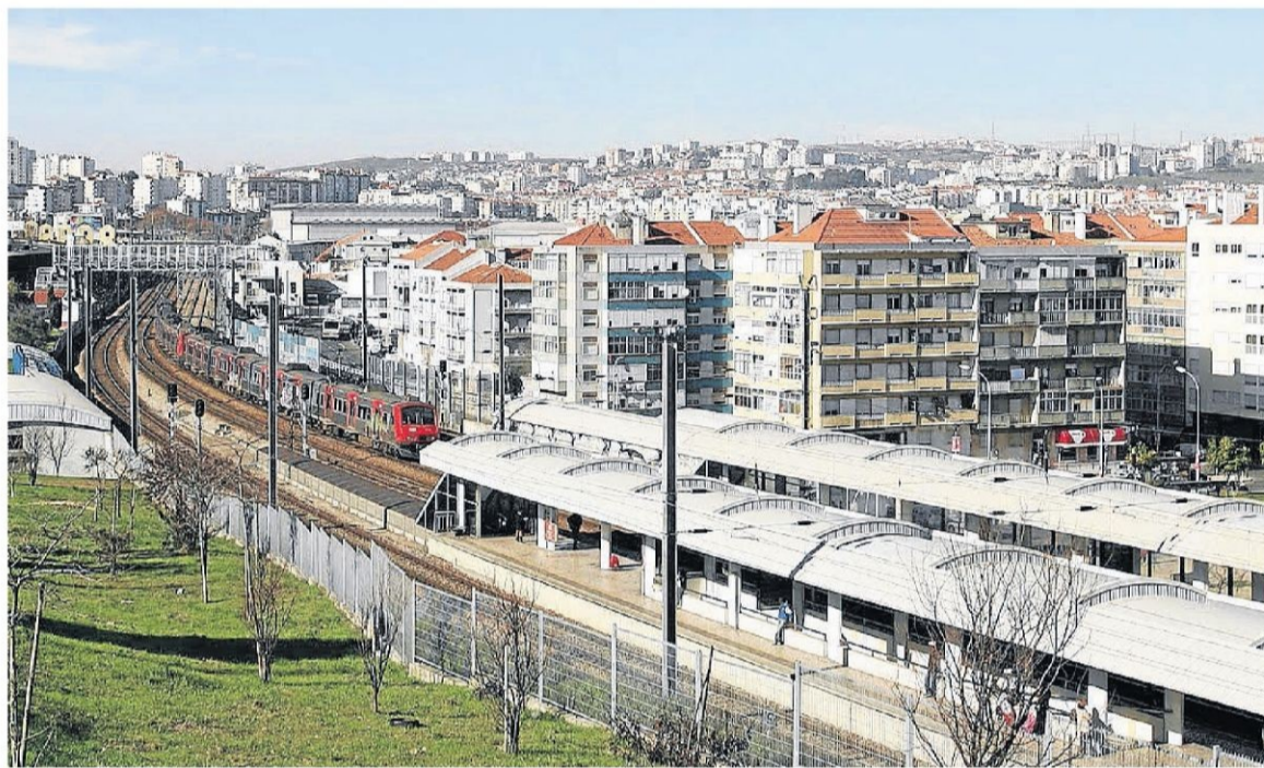
Estación de tren en Buraca, en el municipio de Amadora, de la zona metropolitana de Lisboa.

Como medida intermedia, el resto del área metropolitana de Lisboa (salvo las 19 freguesías más afecta-