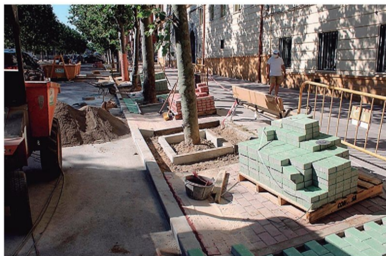
Los adoquines son de dos colores para diferenciar la acera de alcorques. E. A.

La instalación de nuevas papeleras corre a cargo de almacén de la empresa concesionaria del servicio municipal de limpieza viaria. ■