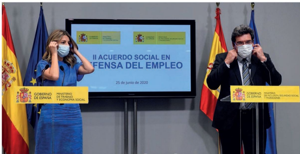
La ministra de Trabajo, Yolanda Díaz, y el ministro de Inclusión, José Luis Escrivá, ayer en rueda de prensa.

Así, en el caso de las empresas que están en situación de fuerza mayor parcial y tienen menos de 50 trabajadores la exoneración en las cotizaciones de la Seguridad Social será del 60% para los trabajadores