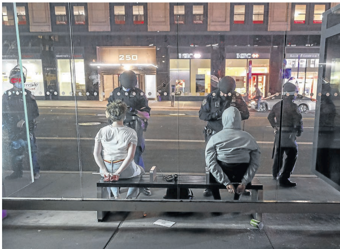
Agentes de policía mantienen a dos personas detenidas que participaban en las protestas de Nueva York.

Las dos autopsias realizadas al afroamericano George Floyd (la oficial y la independiente) han arrojado la misma conclusión: su muerte a manos de policías hace una semana fue un homicidio. Difieren, sin embargo, en qué causó el homicidio; mientras la autopsia contratada por la familia apunta a una muerte por "asfixia", la del forense del condado habla de un "paro cardiorrespiratorio" ocurri-