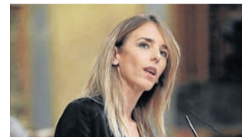
Cayetana Álvarez de Toledo Portavoz del PP en el Congreso

"EL MINISTRO MARLASKA CUENTA CON EL RESPALDO DEL PRESIDENTE DEL GOBIERNO"