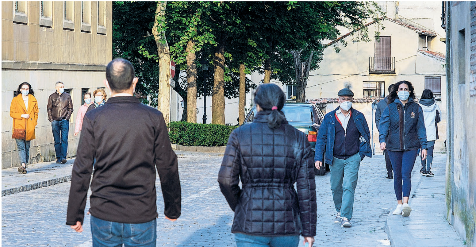
La peatonalización del centro histórico tiene visos de ser permanente, según los ediles de Ciudadanos.