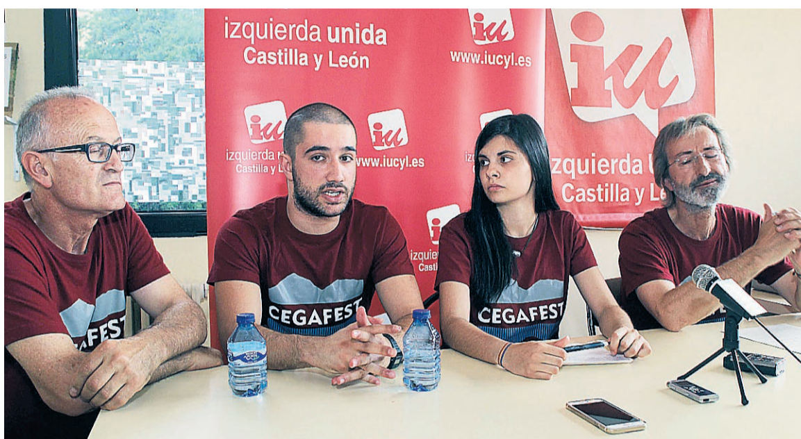
El área de Juventud de IU, organizador del evento, ha optado por su suspensión.

La suspensión de actividades y eventos son noticias cotidianas en la actualidad, y a la larga lista se une ya el Cegafest 2020. El festival de música, charlas y actividades por la defensa del río Cega organizado por IU de Cuéllar, no se celebrará este año debido a la situación complicada, adversa y de incertidumbre que se vive estos días en todo el país. Viendo cómo están sucediendo los acontecimientos en la provincia ante la pandemia, “vemos poco probable celebrar los conciertos que desde el área de juventud de Izquierda Unida se vienen realizando dentro del festival y con todas las garantías sanitarias”, comentan desde la organización. “Lamentamos su suspensión dado el éxito que suele tener el, hasta la fecha, único festival organizado y dirigido a la juventud de Cuéllar, su comarca y, últimamente, más allá”. Desde IU hacen hincapié en la mo-