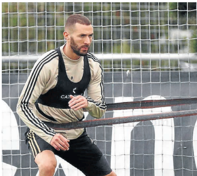
Karim Benzema, realizando un ejercicio en Valdebebas.

El atacante africano recalará en el Olympique de Lyon a cambio de 11,5 millones de euros, más otros cuatro millones por diferentes incentivos. El equipo francés estaba obligado a hacerse con los servicios de Ekambi en el caso de obtener la clasificación europea pero, a pesar de que la liga francesa no se va a reanudar, el Lyon ha decidido fichar igualmente al futbolista por las condiciones pactadas anteriormente.