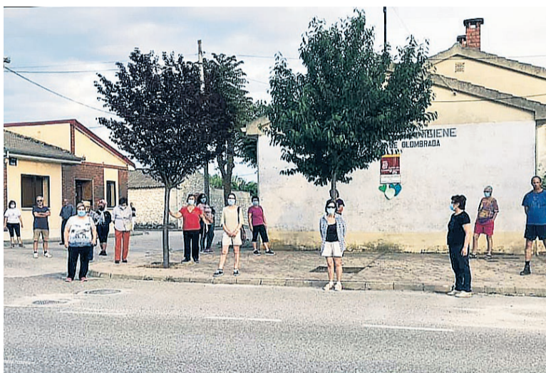
Acto reivindicativo llevado a cabo en Olombrada. E. A.

la convocatoria de la plataforma Sanitarios Necesarios a nivel estatal, en defensa de la Sanidad Pública.