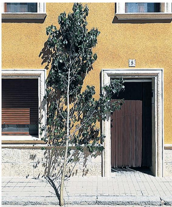
Fachadas e iglesia de Lastras de Cuéllar aparecieron este lunes con la tradicional enramada.