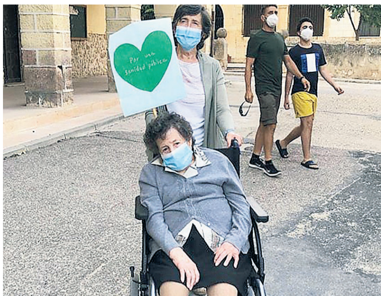
En Muñoveros se ha tenido muy presente las necesidades de los mayores. E. A.