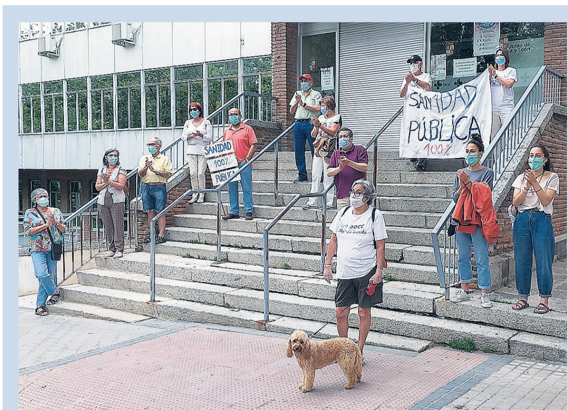
Concentración llevada a cabo el lunes en la escalera del centro de salud Segovia I

correr la red de consultorios de salud que, con sus limitaciones, en estos años ha atendido a la población rural de Castilla y León. Asaja comprende, tal y como se explica en una nota de prensa, que en estos tiempos las necesidades son muchas y los recursos limitados pero considera que “centralizar la atención sanitaria en unos pocos consultorios agrupados significaría de facto dejar sin atención habitual a miles de castellanos y leoneses”. ■