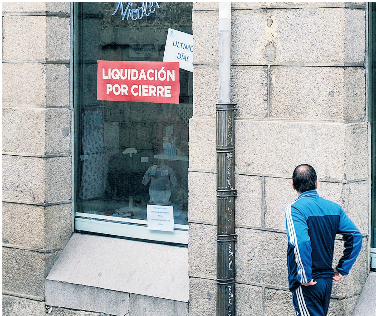
El desempleo ha hecho mella de forma muy dura en el sector servicios durante los dos últimos meses, que en mayo perdió 366 tra-