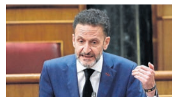
Edmundo Bal Portavoz de Cs en el Congreso

"QUE ESPERE EN SU CASA LAS RESPONSABILIDADES PENALES. CAERÁ POR SUS SUBORDINADOS"