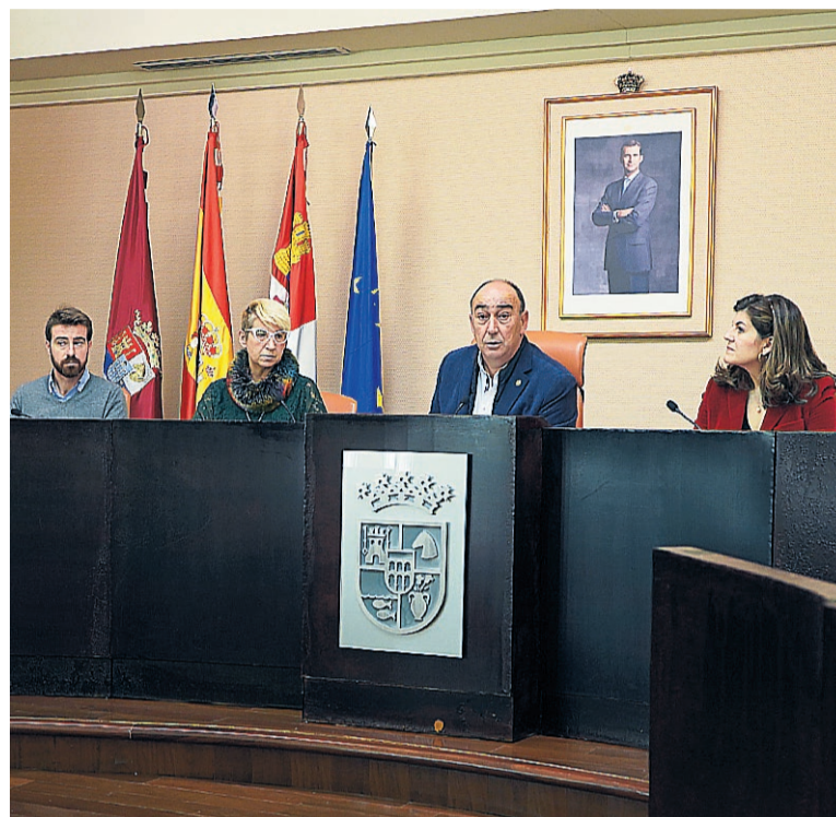
El Consejo Provincial de Igualdad valorará los trabajos presentados.

La convocatoria, cuyo plazo de presentación de solicitudes finaliza el próximo 22 de junio y cuyas bases pueden ser consultadas en la web de la Diputación ( https://www.dip-segovia.es/la-institucion/areas/consejo-provincial-de-igualdad/becas ), ofrece dos becas dotadas de 8.000 euros para trabajos que, de forma individual o como equipo de investi-