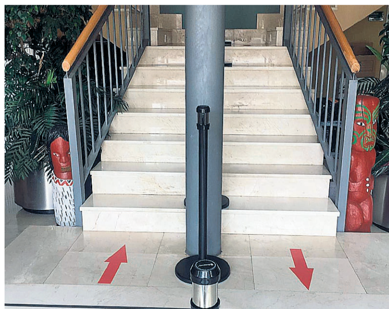
El Ayuntamiento ha colocado señales para regular los accesos.