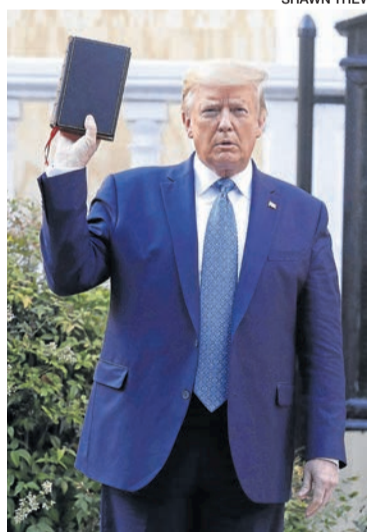
Donald Trump, con la biblia.