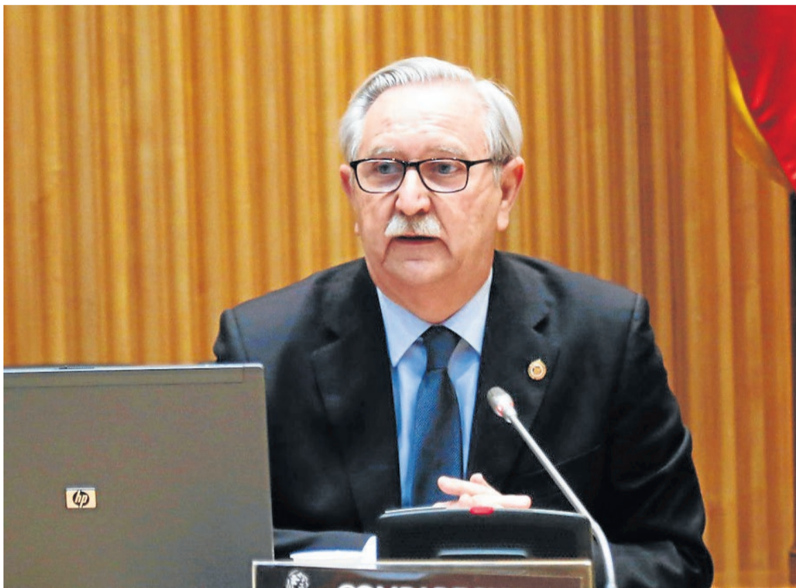
El presidente del Consejo General de Colegios Oficiales de Médicos, Serafín Romero, en el Congreso.

Y ha hecho hincapié en la necesidad de un SNS con recursos económicos suficientes porque ha