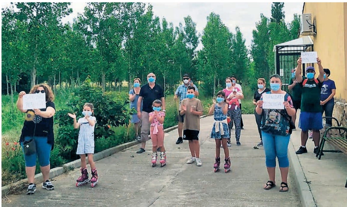
Niños, jóvenes y mayores de Fuente el Olmo de Fuentidueña junto al consultorio de la localidad.