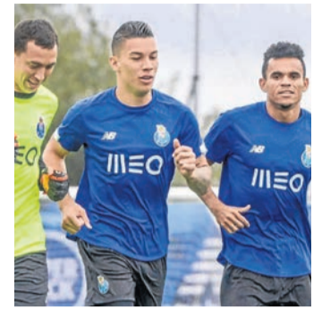
Entrenamiento del Oporto.