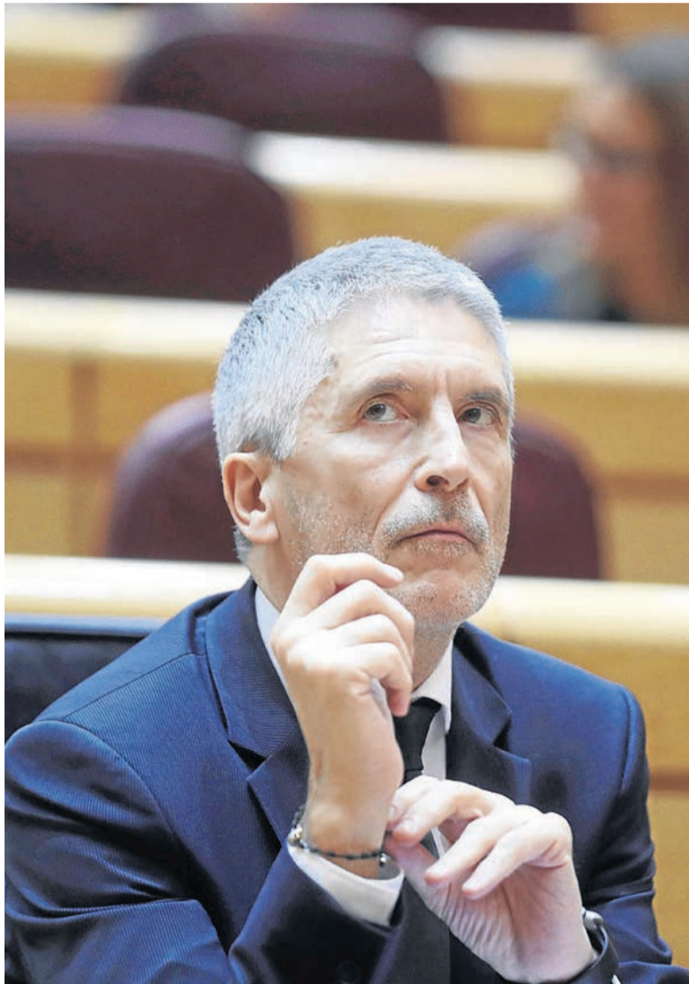
Fernando Grande-Marlaska, durante el pleno en el Senado.

La portavoz de Vox en la Comisión de Interior, Macarena Olona, defendió que Marlaska debe dejar el cargo "inmediatamente" tras conocer la información de El Confidencial que revela que Pérez de los Cobos fue apartado de su cargo al negarse a filtrar las diligencias judiciales sobre la manifestación del