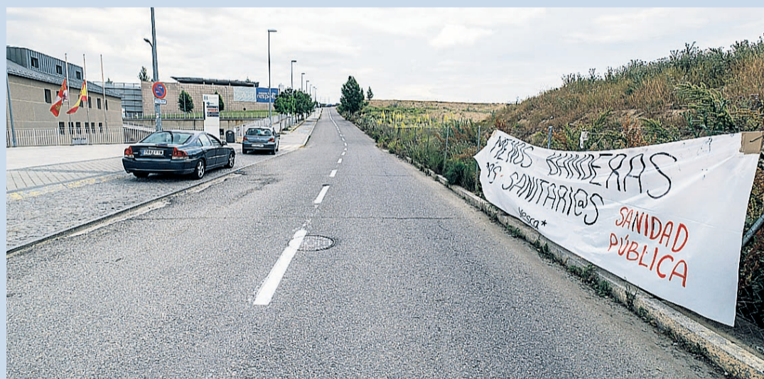
Esta pancarta lleva días colocada frente al acceso principal del Hospital General. KAMARERO