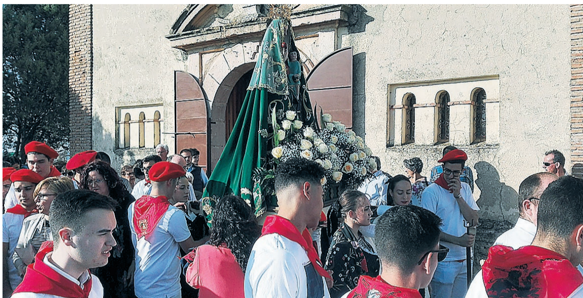
La ermita de la Virgen del Pinar no ha contado este año con la habitual procesión.

Por su parte, un grupo de vecinos de Mozoncillo también echa de menos su tradicional romería que tiene lugar cada lunes de Pentecostés, y donde los grupos de danzas que llevan el nombre de su Virgen ofrecerían sus bailes a todos los piñoneros. “El Coronavirus no nos ha dejado celebrar la ofrenda de flores ni la tradicional actuación de danzas en la pradera de la ermita. Por eso hemos elaborado un vídeo en