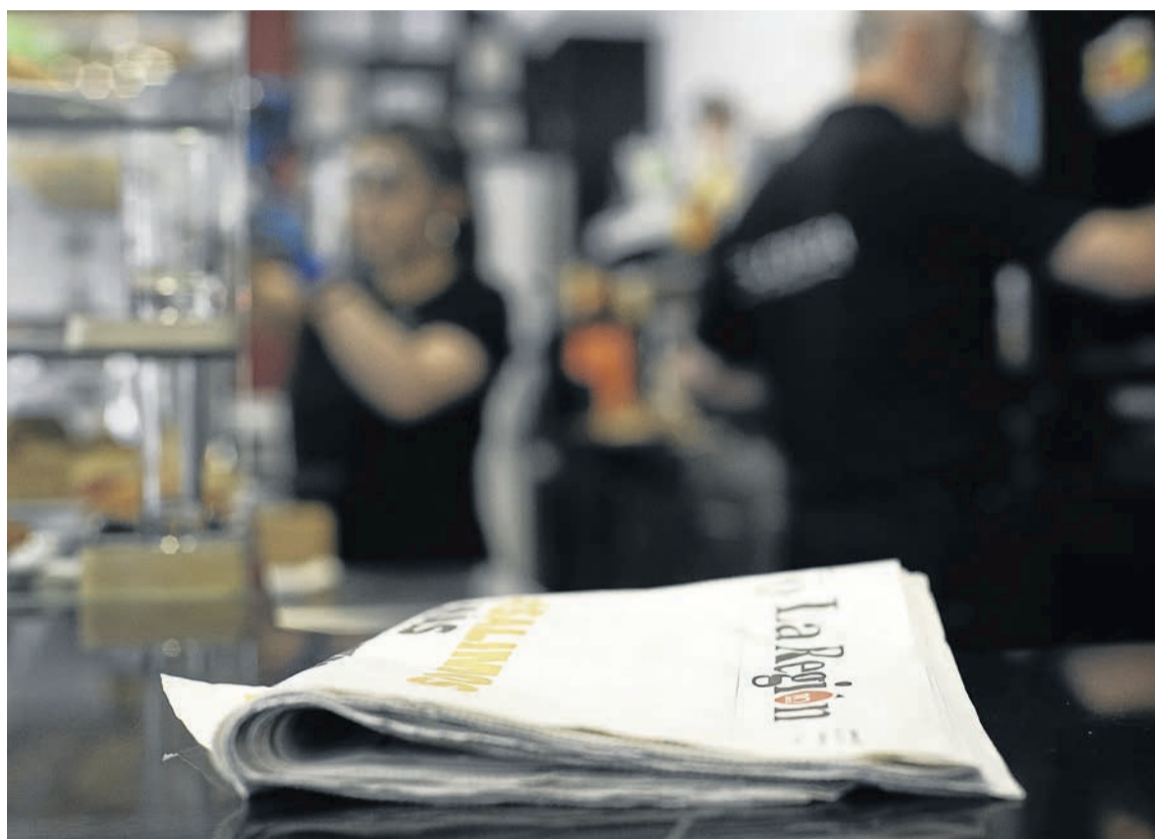
Periódico a disposición de los clientes que lo demanden en la barra de un local de hostelería.

De este modo, ambas instituciones manifiestan su compromiso de seguir facilitando el acceso a la información de los clientes de los establecimientos abiertos al público, a través de ejemplares dis-