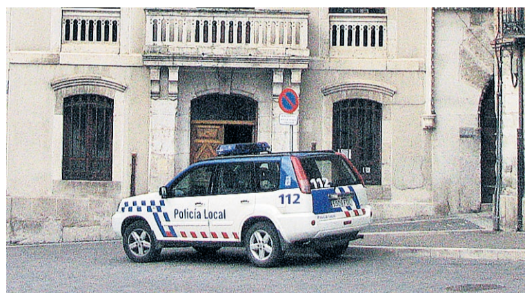
La Policía investiga lo ocurrido.

la Seguridad Vial al conducir un vehículo a motor habiendo perdido la totalidad de los puntos del carné. El suceso constituye un delito que pone en peligro la seguridad de conductores y peatones. ■