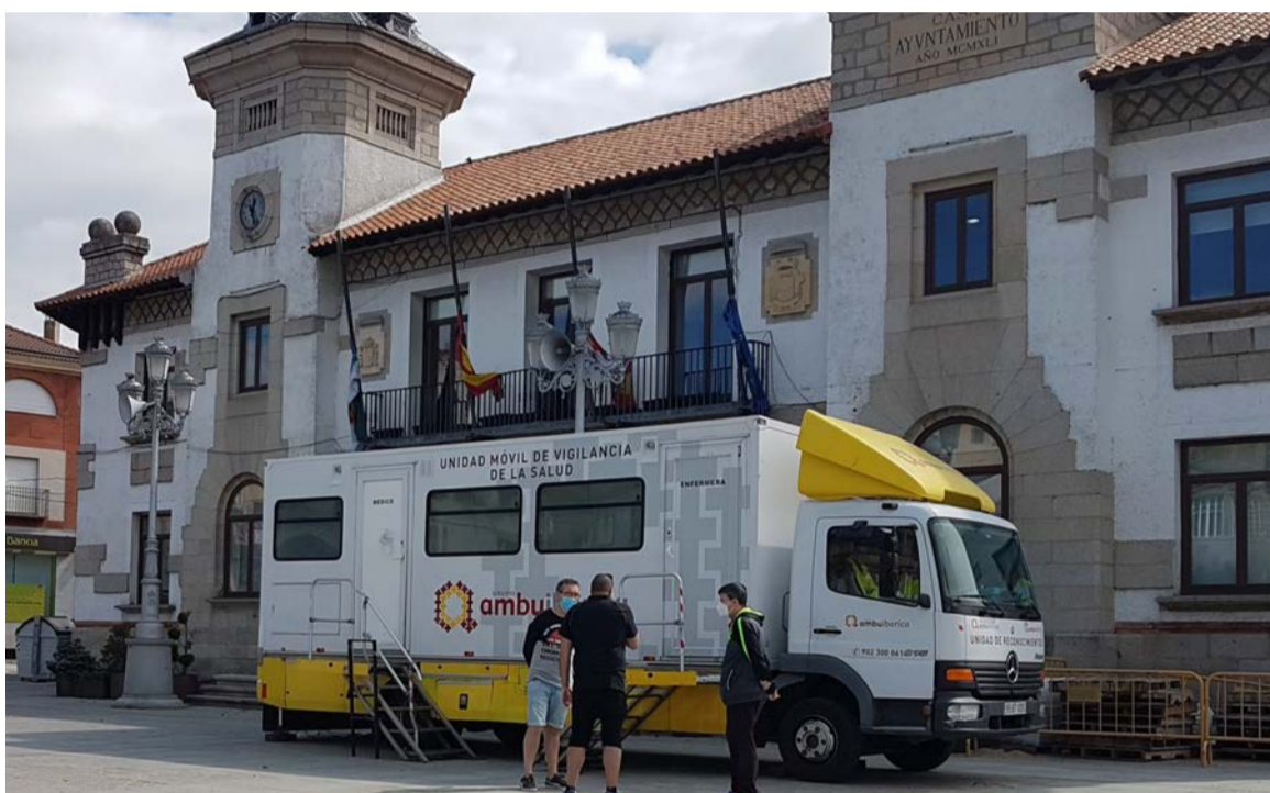
Imagen de la unidad móvil que realizó los test junto al Ayuntamiento de El Espinar.

Desde el Consistorio informaron de que en todos los casos se trataba de personas asintomáticas, por lo que había sido imposible detectar la presencia del virus en sus organismos. Los tests, que fueron costeados por el Ayunta-