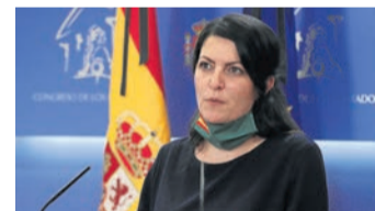
Macarena Olona Diputada de Vox

"A PÉREZ DE LOS COBOS SE LE CESA POR CUMPLIR LA LEY, POR CUMPLIR CON SUS OBLIGACIONES"