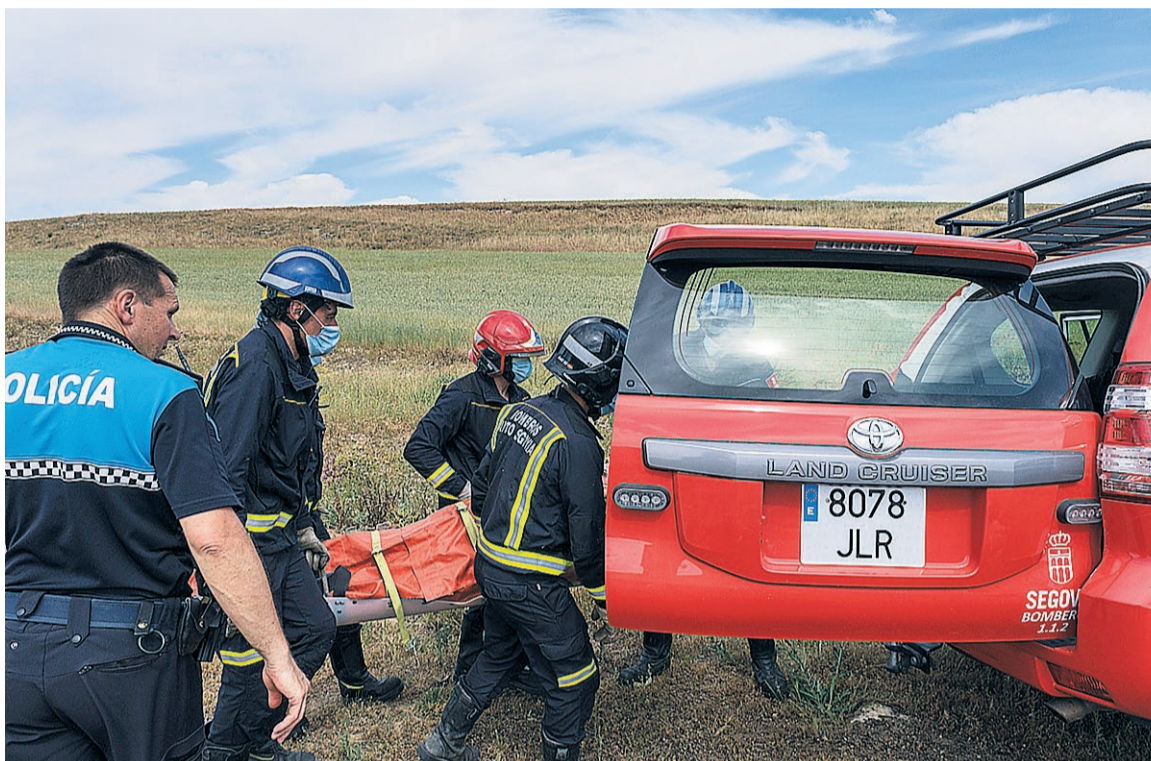
Momento en que los bomberos trasladan al herido al vehículo para llevarlo al Hospital General.

En el lugar, los bomberos encontraron al hombre ya en el suelo, con dificultades para caminar, por lo que fue evacuado en una camilla hasta el lugar donde se encontraba una ambulancia, que le llevó hasta el Hospital General de Segovia, donde fue ingresado para ser sometido a una exploración más exhaustiva. ■