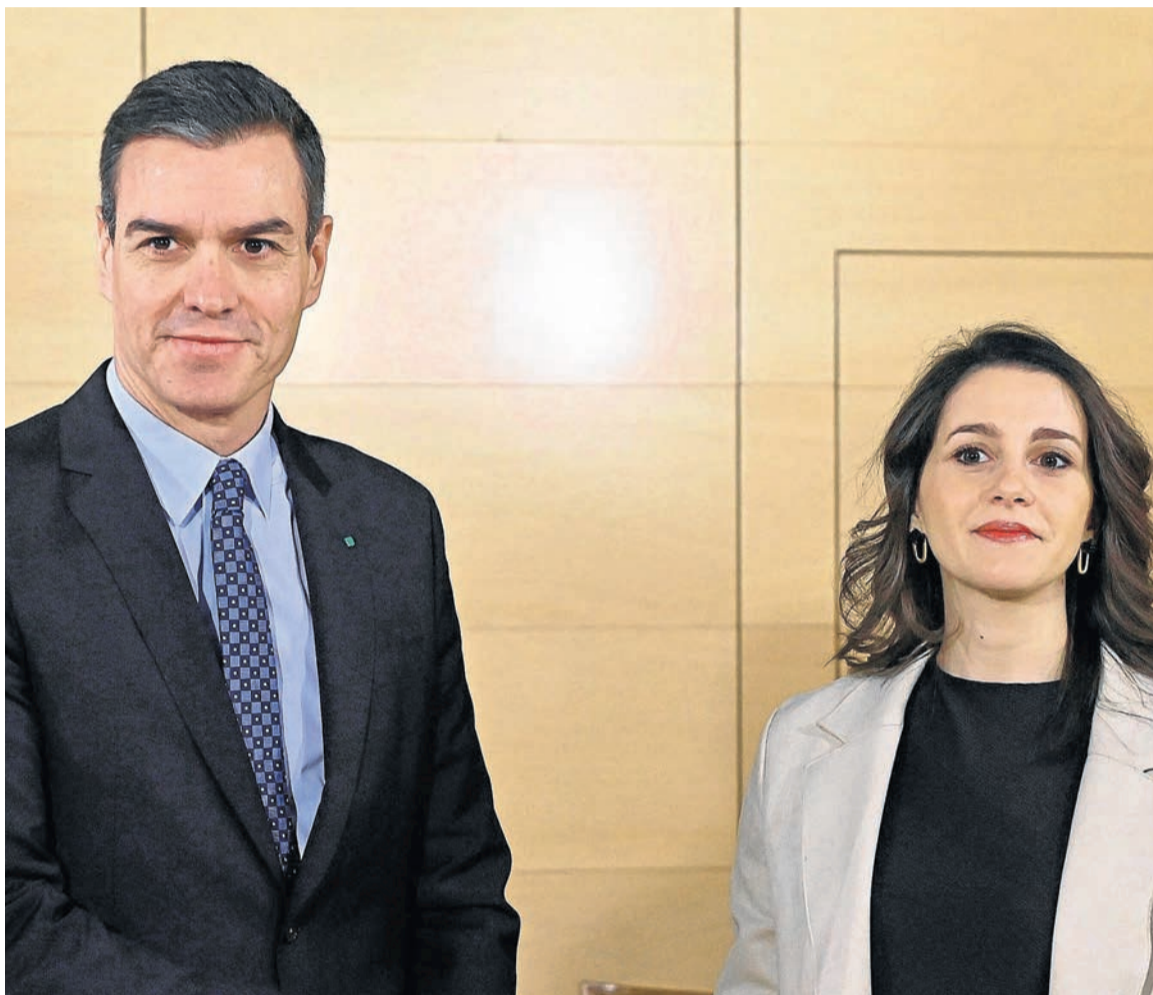
El presidente del Gobierno, Pedro Sánchez, e Inés Arrimadas, presidenta de Ciudadanos.

En un comunicado, el Grupo Vasco en el Congreso aseguró de que constó que el decreto de pró-