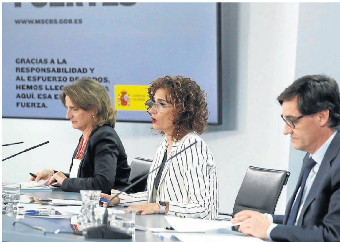
Los ministros Teresa Ribera, María Jesús Montero y Salvador Illa tras el Consejo de Ministros.