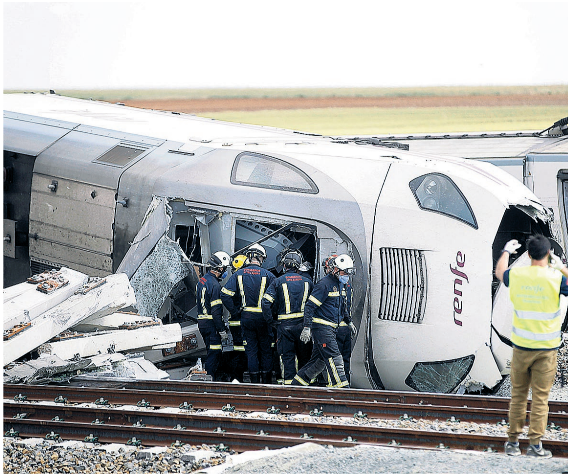
Un grupo de bomberos, cerca del tren siniestrado en el accidente ocurrido en Zamora.

Como consecuencia del siniestro, el conductor del vehículo falleció,