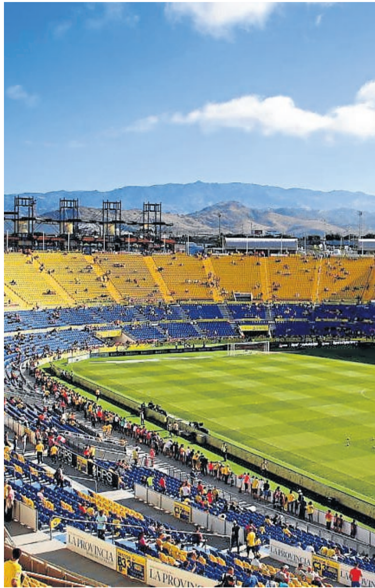
Panorámica del estadio en el que juega sus partidos Las Palmas.

Así que se pregunta por qué no puede organizarse un partido con menos gente, pero con medidas de protección personal de uso obligatorio, asientos preasignados, turnos de entrada al estadio escalonados y controles de temperatura a los asistentes.