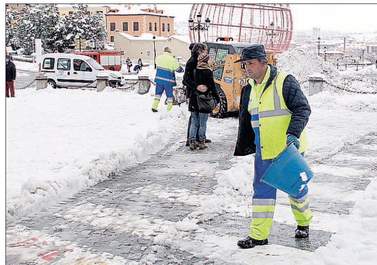
Un operario echa sal en un céntrico paso de peatones.

Por otro lado, tanto ayer como el lunes han estado trabajando cuatro máquinas quitanieves de gran tamaño, otras cuatro más pequeñas, adecuadas a la intervención en vías secundarias y aceras,