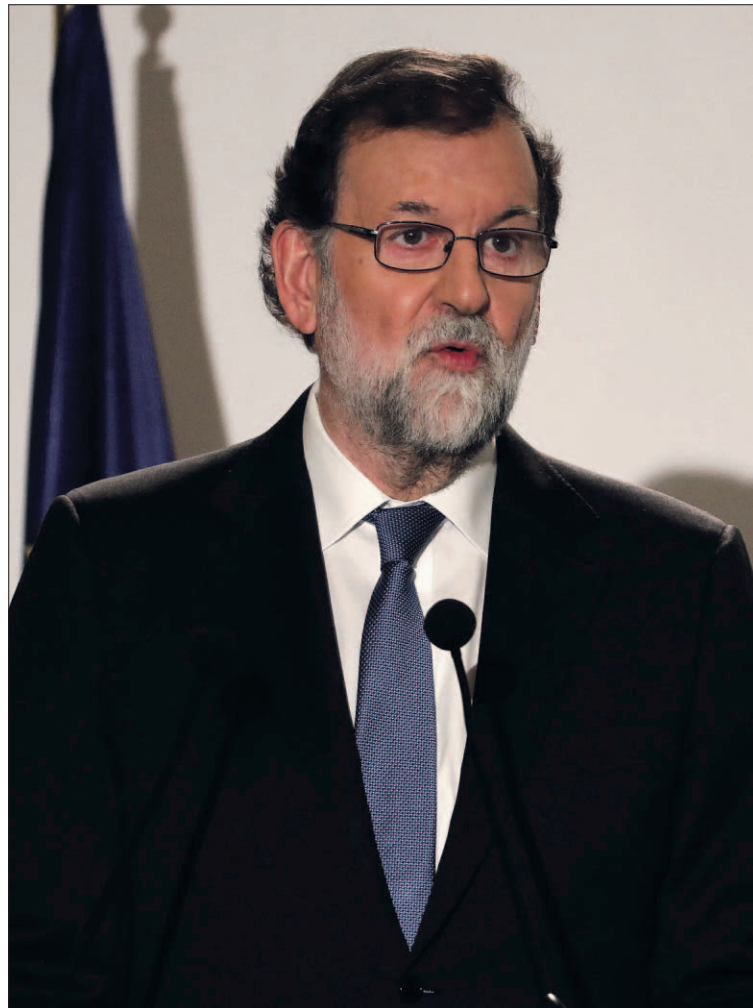
El presidente del Gobierno, Mariano Rajoy, durante su intervención.

“Tras las elecciones catalanas del 21 de diciembre, esperamos que se pueda formar pronto un Gobierno que acate el orden constitucional y Estado de Derecho y la situación política se normalice”, declaró Rajoy, quien el pasado mes de diciembre convocó para el 17