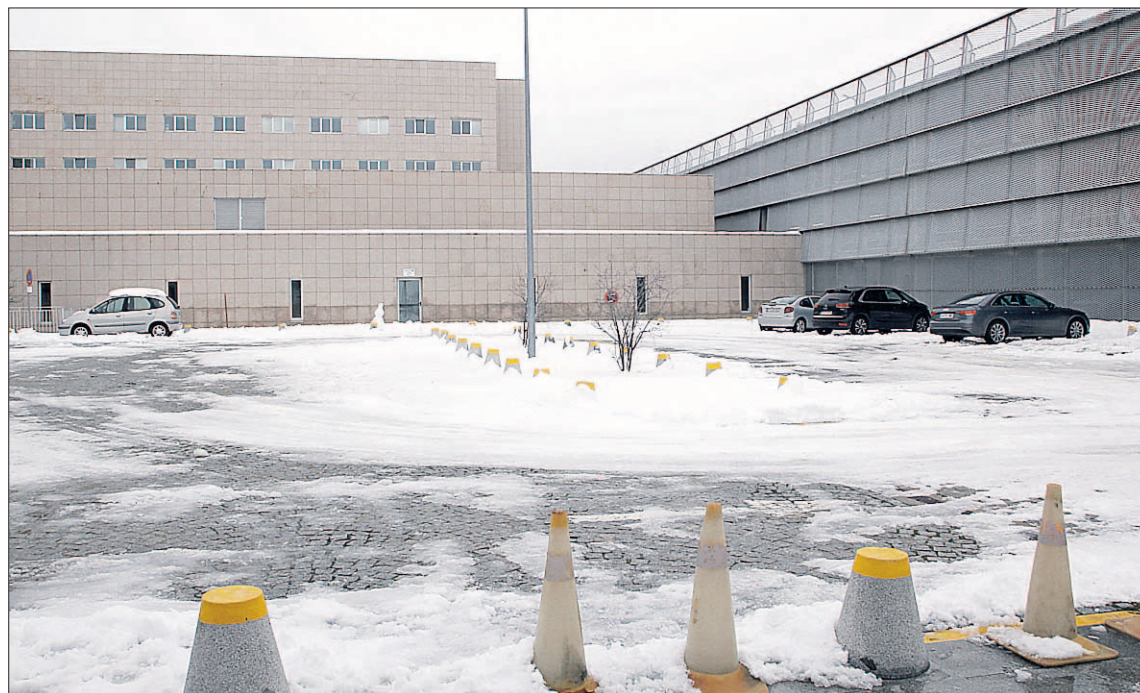
Estado en el que se encontraba la zona de aparcamiento de Urgencias cerca de las tres de la tarde.