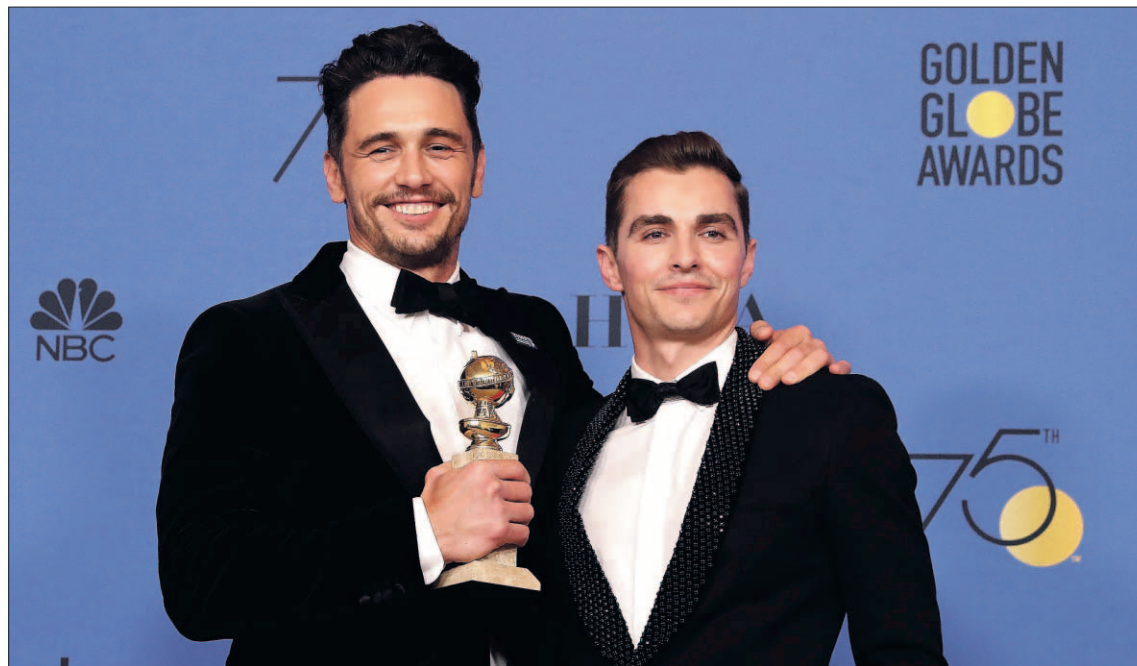
El actor James Franco (i) junto a su hermano Dave tras conseguir el galardón.

ley también acusó a Franco a través de la red social, donde recordó que el actor trató de mantener relaciones sexuales con una menor.