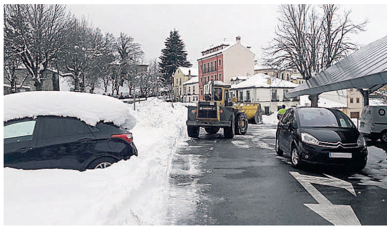
Las calles del Real Sitio empiezan a recuperar la normalidad tras el temporal.

Los cementerios ya son accesibles y no hubo que trasladar a heridos ayer al Hospital. Ese es el balance de una jornada relativa-