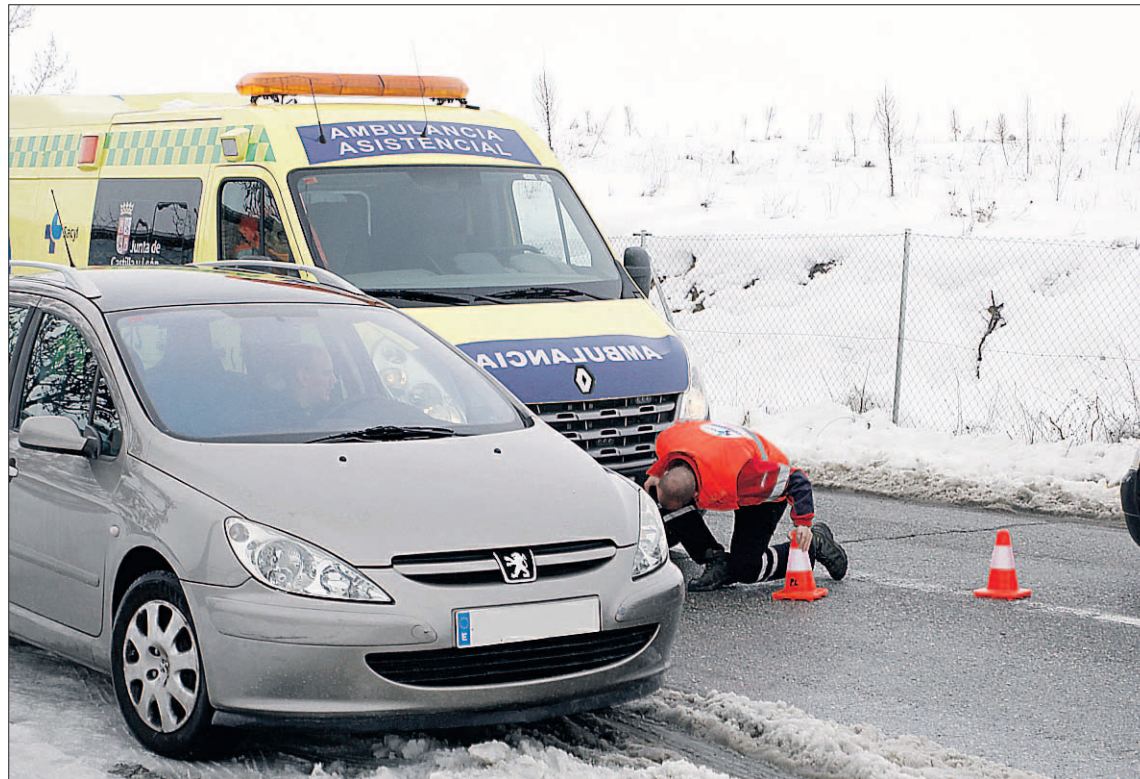
Los vehículos sanitarios y de usuarios tuvieron problemas de acceso y salida en el Complejo hospitalario.

La presencia de nieve y de placas de hielo inutilizó muchas plazas de estacionamiento. En la zona de Urgencias a media mañana la ocupación no llegaba al 30 por ciento y la Gerencia hospitalaria aún esperaba la llegada de máquinas que a título privado había solicitado para proceder a limpiar la zona. Las rampas de entrada al parking destinado a trabajadores, así como muchas de sus plazas de estacionamiento también estaban cubiertas de hielo y nieve a primera hora de la mañana por lo que sus vehículos fueron desviados al aparcamiento de rotación que pronto se llenó. Según la Delegación, este aparcamiento ha podido