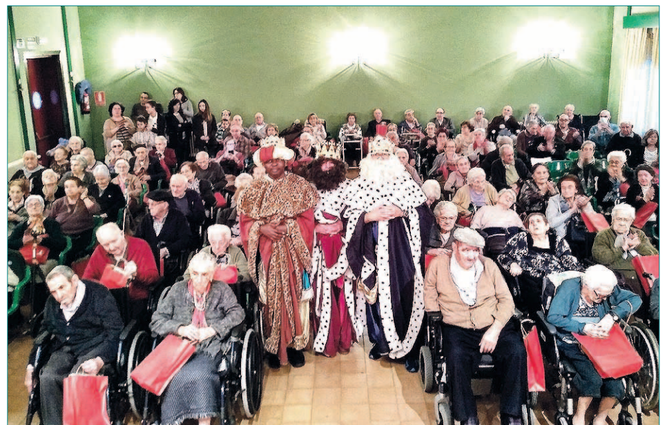
CÁRITAS DIOCESANA DE SEGOVIA y la Residencia 'El Sotillo' quieren agradecer a todos los grupos, personas, familiares, etc., que desde el 15 de diciembre hasta el 6 de enero han acompañado, han hecho disfrutar, sonreír y pasar unas verdaderas navidades a todos los residentes. Muchas GRACIAS a todos. Esa es la verdadera Navidad.