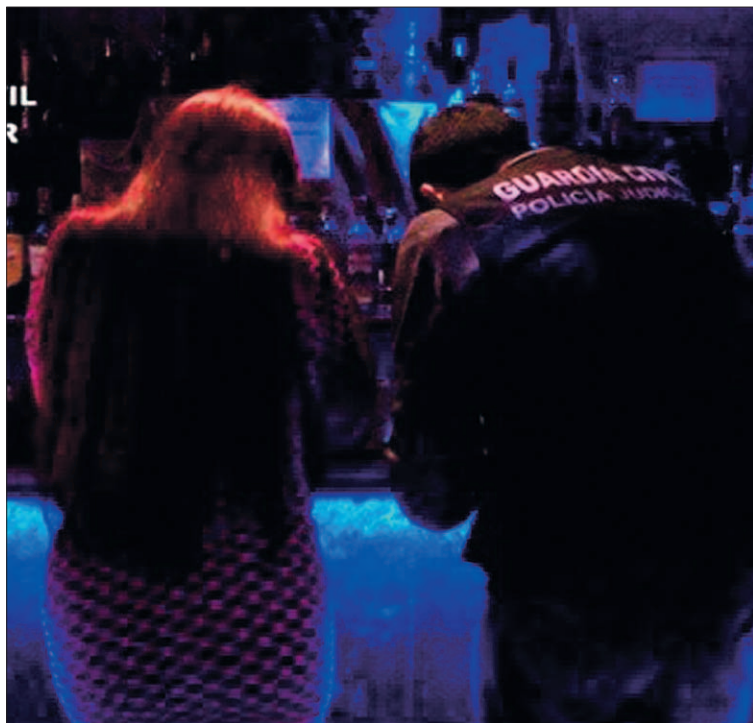
Las familias no sabían nada porque las jóvenes estaban amenazadas.

Durante este tiempo, las jóvenes seguían haciendo su vida normal en Madrid y tenían que buscarse excusas creíbles de cara a su familia cada vez que acudían obligadas y amenazadas al club. Durante el mes que duró la situación, las jóvenes sí que consiguieron evitar el contacto físico con los clientes, detallaron las mismas fuentes.