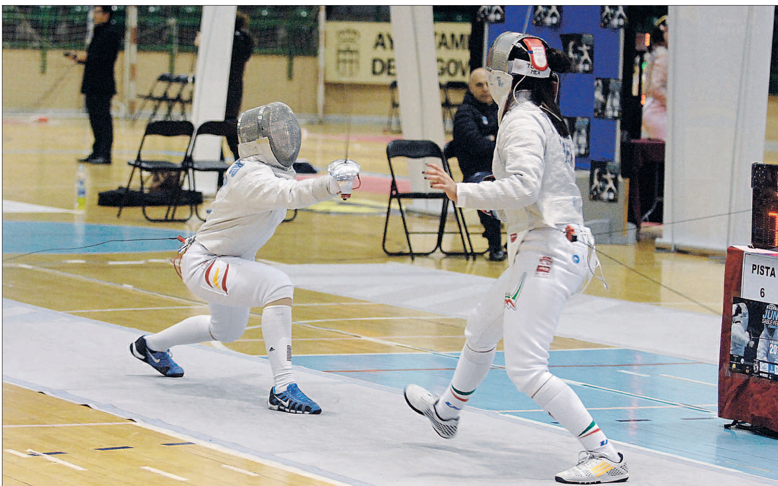
Una de las poules celebradas sobre la cancha del Pedro Delgado durante una de las pruebas de la Copa del Mundo de sable femenino.