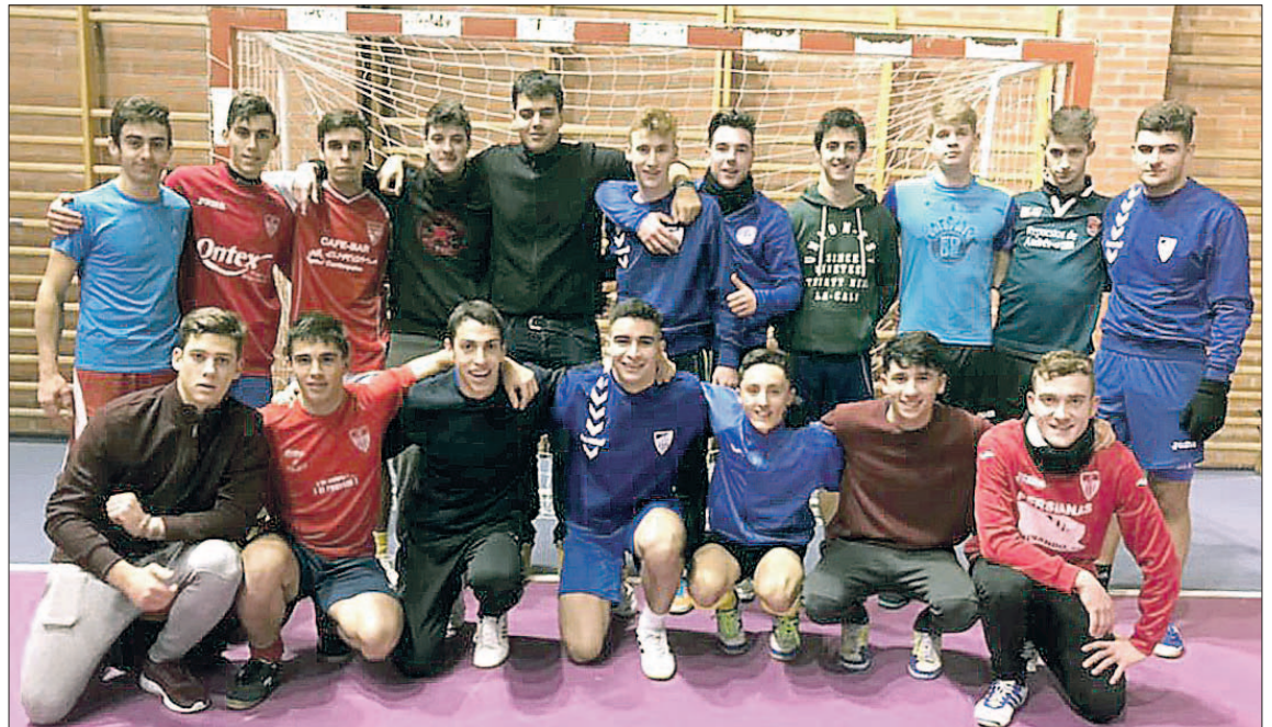
Integrantes de los equipos que participaron en el pasado torneo navideño.

Los equipos ganadores fueron: primeros, 'Los ratones sin Freddy'; segundos, 'LMC'; terceros, 'Los ratones con Freddy', y cuartos y