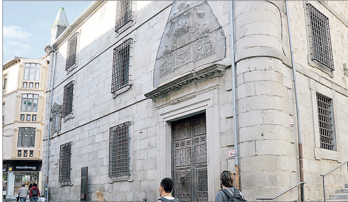
Fachada de la Biblioteca Municipal-Casa de la Lectura de Segovia, en la Calle Real.

Las familias interesadas en inscribir a niños y niñas a estos talleres de animación deben rellenar la hoja de solicitud que pueden recoger en la Concejalía de Cultura (calle Judería Vieja, 12), en la Biblioteca Municipal-Casa de la Lectura (calle Juan Bra-