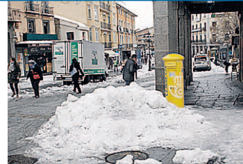
La nieve todavía permanece en calles y plazas de la ciudad.