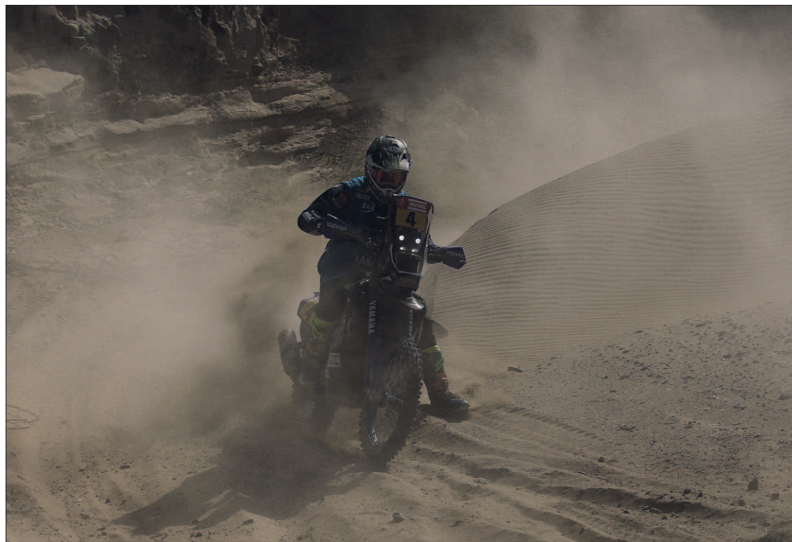
El francés Adrien van Beveren fue el más rápido de una etapa con 100 kilómetros de dunas por tierras peruanas.