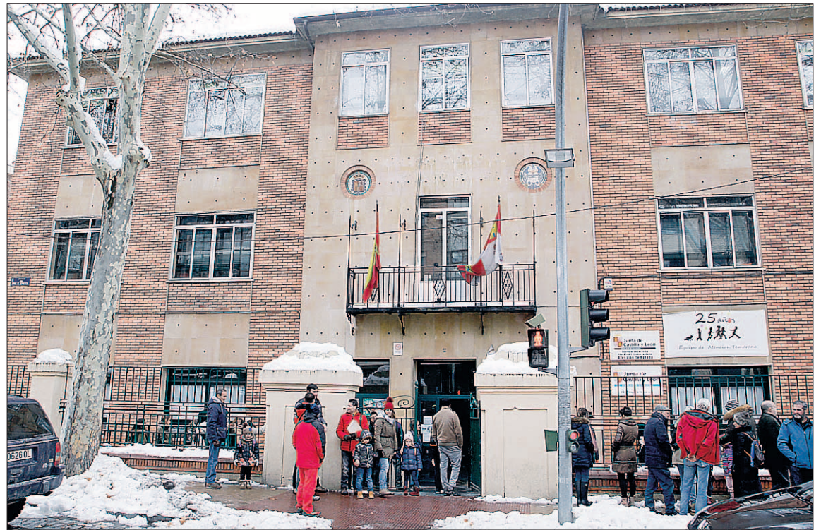
Los colegios van reanudando la actividad lectiva tras las vacaciones y el bloqueo generado por el temporal.

El número de ausencias representa el 5,22 por ciento del total de 22.723 alumnos escolarizados en la provincia de Segovia. De los 1.187 estudiantes que no han po-