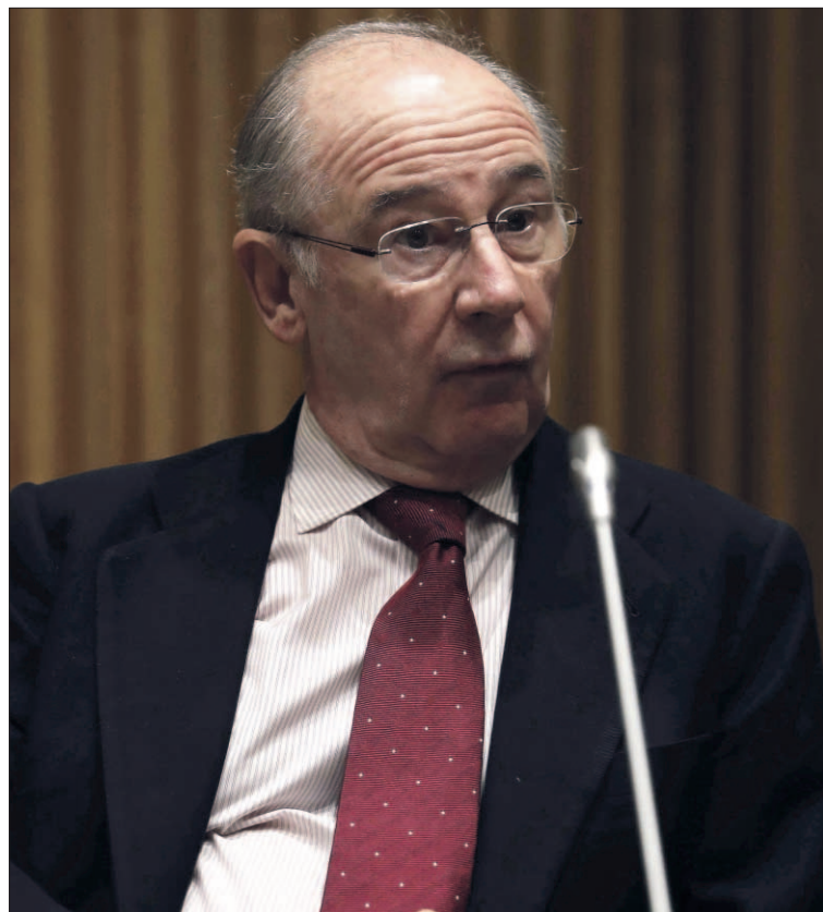
El exvicepresidente y exministro de Economía Rodrigo Rato.

Asimismo, afirmó que "en ninguna de estas tres reuniones estuvo presente el Banco de España". "En mi opinión personal, por lo que valga, es que se le ocultaron estas reuniones", dijo, recalando que, mientras, el supervisor, gobernado entonces por Miguel Ángel Ordóñez, se encontraba aprobando las propuestas de aprovisionamiento que le hacía Bankia para cumplir con las exigencias del