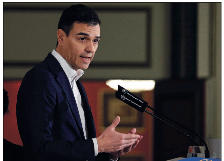
El secretario general del PSOE, Pedro Sánchez.

La revisión del modelo de financiación autonómica será otro de los acuerdos de país que elabo-