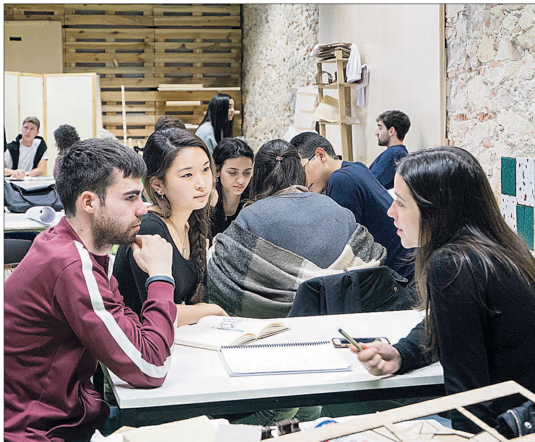
Los estudiantes, en una de las sesiones de trabajo del taller que tiene lugar esta semana en IE University

La IE School of Architecture&Design organiza una nueva edición de los Talleres de Integración Arquitectónica con tres profesionales de prestigio internacional