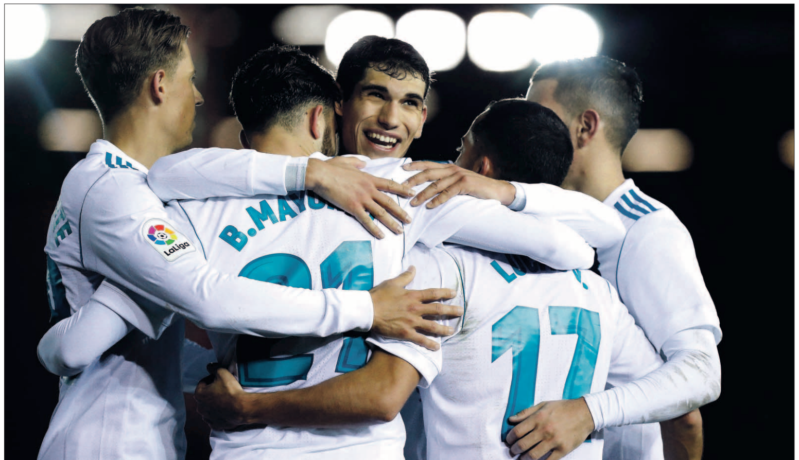
La Copa vuelve a ser una oportunidad de reivindicarse para jugadores con menos minutos como Asensio, Ceballos, Llorente, Mayoral o Jesús Vallejo.

Modric fichó por el Real Madrid el 27 de agosto de 2012, momento desde el cual adquirió la condición de residente fiscal en España con las obligaciones tributarias correspondientes.