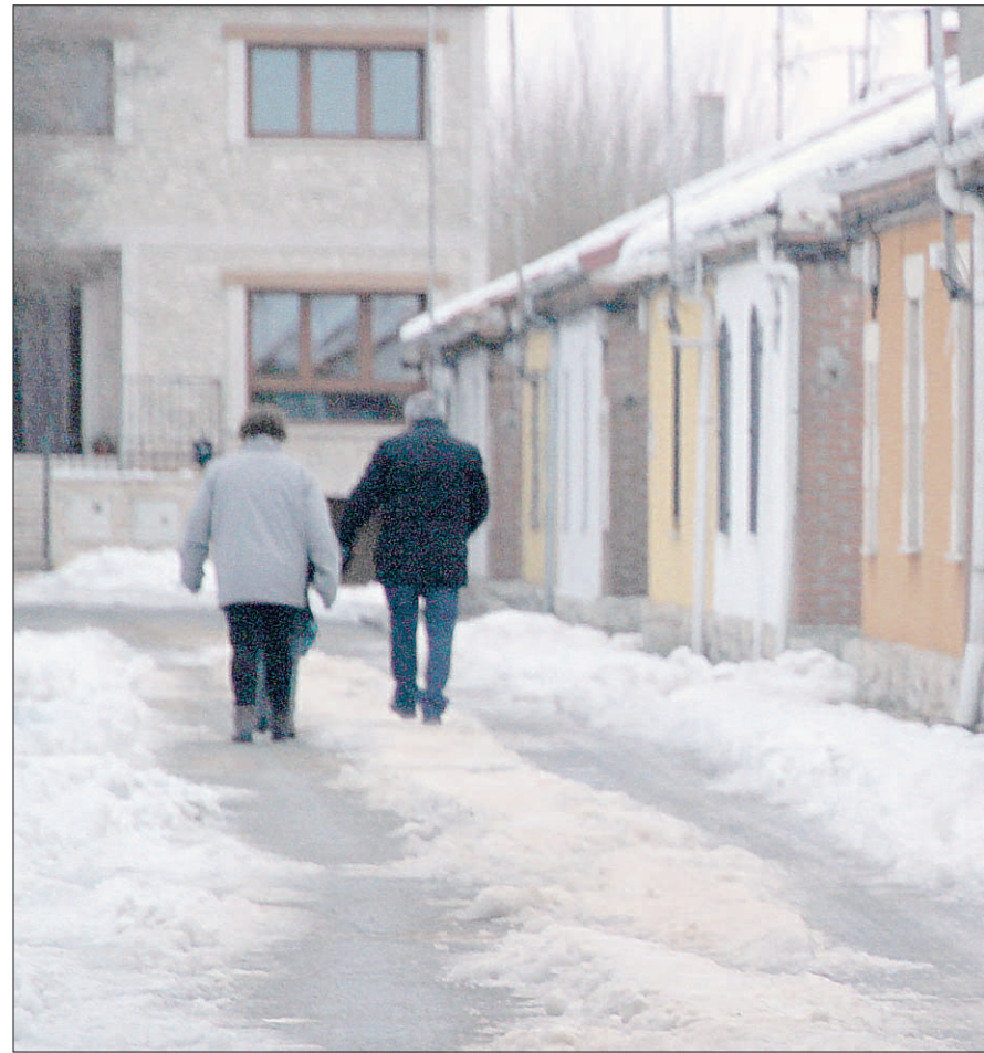
Familias y vecinos del barrio de San Gil a primera hora de la mañana, cuando efectuaron la salida

Colaboración vecinal. Aseguran que ha sido fundamental su trabajo para que las vías queden algo más limpias y se haya podido circular tanto a pie como en vehículos, apoyándose entre ellos