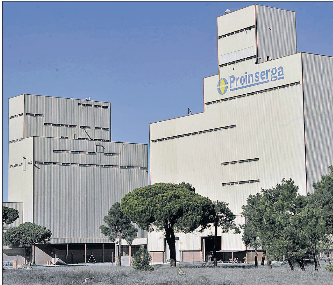
Fábrica de pienso de Proinserga, situada en Fuentepelayo, donde se encuentran también las oficinas.

Pero el propio grupo de ganaderos ha presentado un escrito de aclaración, porque entienden que existen errores de transcripción