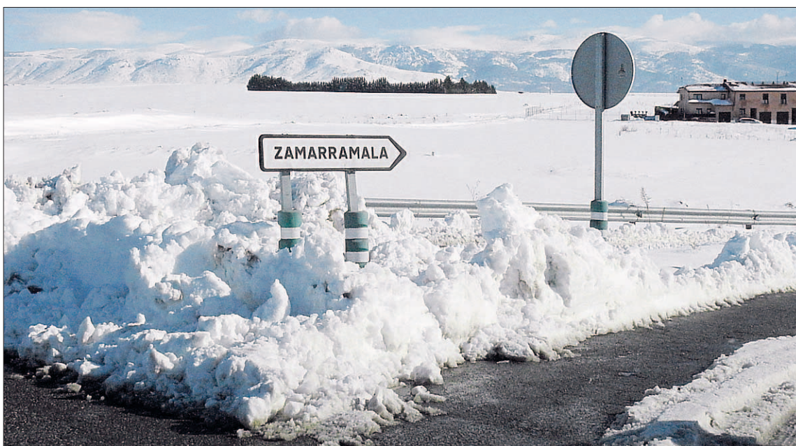
La nieve acumulada en los accesos al barrio incorporado de Zamarramala da idea de la magnitud del temporal.

Los concejales del principal grupo de la oposición entienden que el plan de nevadas contemple una serie de acciones prioritarias pero debería ir más allá e “incluir un plan alternativo para los barrios, tanto los de la capital como los incorporados, en donde estén definidas una serie de actuaciones de cara a que nuestros vecinos puedan acceder a las zonas o lugares principales como puede ser una farmacia, un colegio, un centro de salud o la parada del autobús, entre otras muchas cosas y que garanticen la entrada y salida