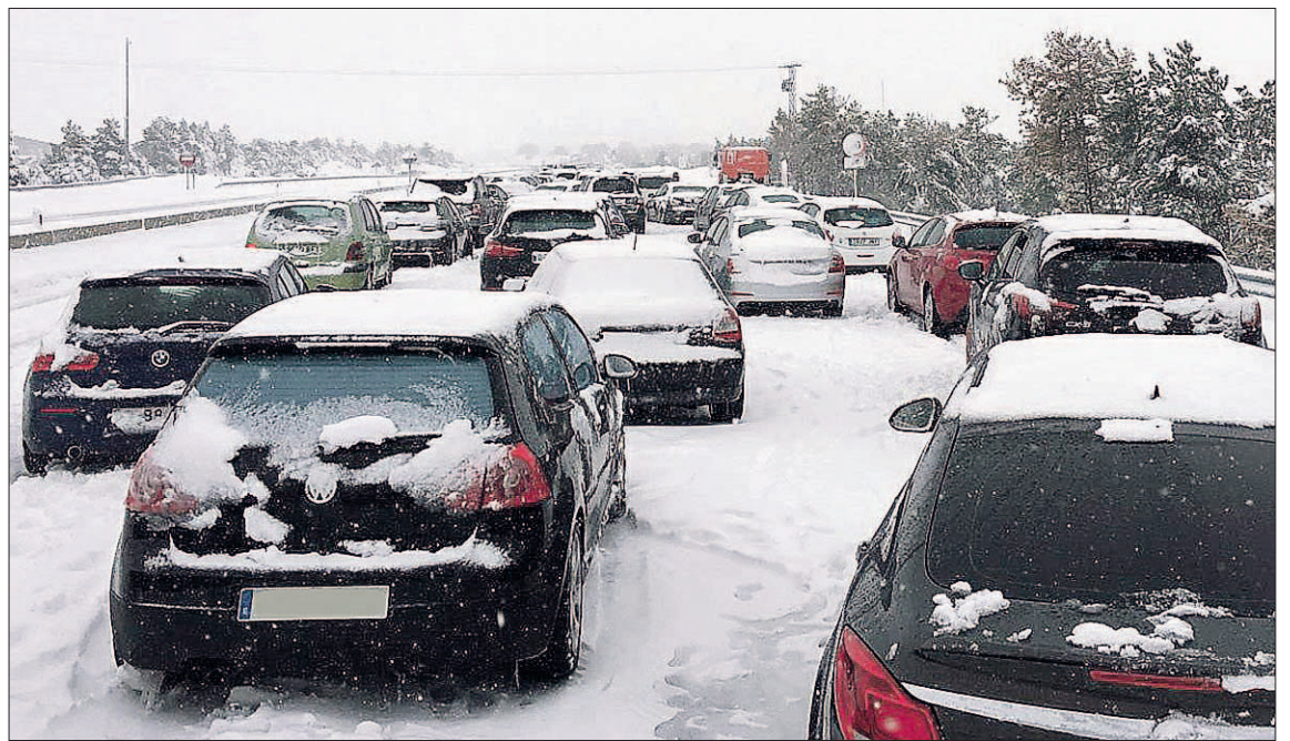
Centenares de vehículos se vieron atrapados por la nieve en la autopista en el día de Reyes.

En cualquier caso, López-Escobar ha recalcado que la provincia sigue en alerta meteorológica amarilla hasta este miércoles y que, en las próximas horas, puede volver a nevar. Asimismo, se ha congratulado por el hecho de que no se hayan registrado incidencias sanitarias de relevancia en puntos de difícil acceso.