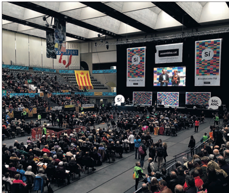
Para la entidad soberanista, el independentismo es más fuerte que nunca.

“Solo así podremos actuar como un Estado y en consecuencia obtener el reconocimiento internacional que debe permitirnos la negociación con España”, destaca la hoja de ruta, que avisan de que exigirán a las fuerzas políticas y sociales implementar la república,