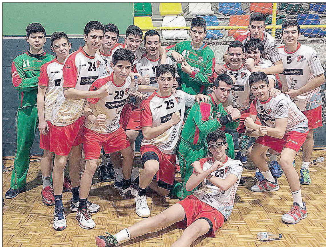
Los jugadores cadete de la Selección de Castilla y León celebran una de sus victorias.

Por su parte, la selección infantil masculina también ocupó su espacio de protagonismo en la localidad de gallega de Uni Ponte (Pontevedra) al jugarse el tercer y cuarto puesto del Campeonato frente el equipo de Madrid, ante