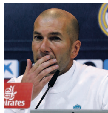
Zidane, ayer en rueda de prensa.

"No te voy a decir lo que hablamos, son charlas como en cualquier equipo y podéis analizarlo como queráis, como un momento de crisis y todo eso. Estamos para buscar soluciones e intentar hacer mejor las cosas. Ha sido un poco más larga, pero nada más", dijo.