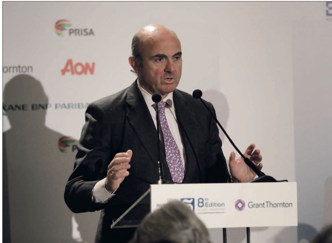
El ministro de Economía, Luis De Guindos, en el almuerzo-coloquio de la VIII edición del Spain Investors Day.

De Guindos remarcó que Bankia es "uno de los principales competidores del sistema financiero español" y rechazó en varias ocasiones entrar en "polémicas y debates". "Lo importante es que hoy Bankia compite, está bien gestio-