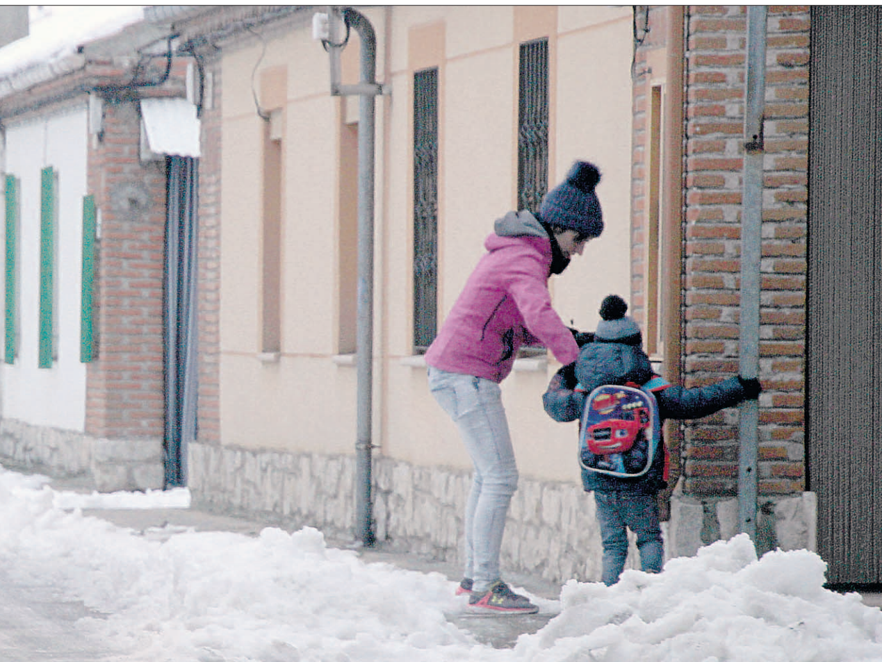
...a hacia sus lugares de trabajo y hacia el colegio. / CHANTAL NÚÑEZ