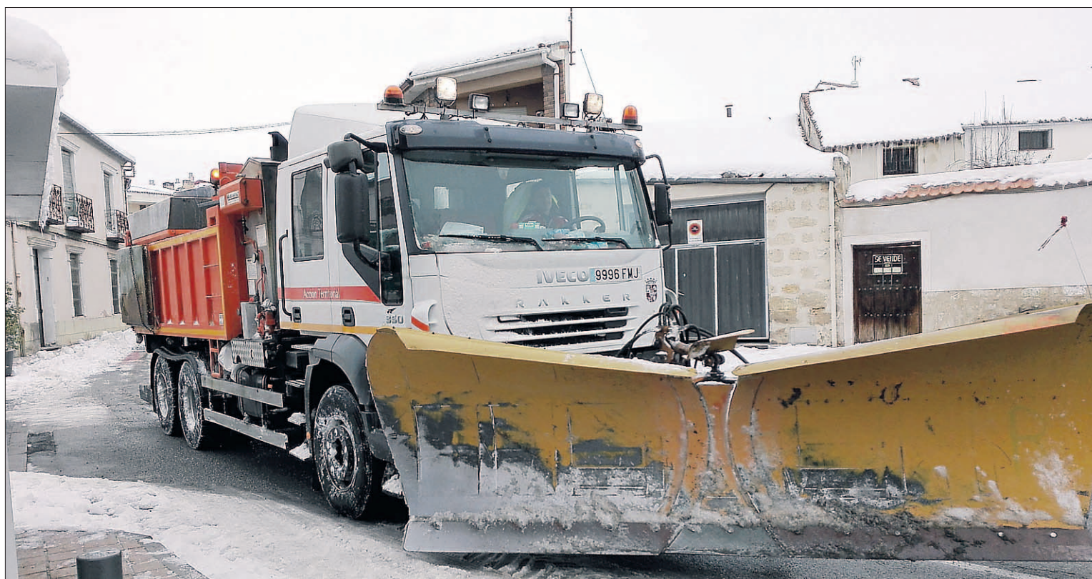
Las máquinas de la Diputación han conseguido llegar a todos los pueblos de la provincia, según aseguran los responsables corporativos.