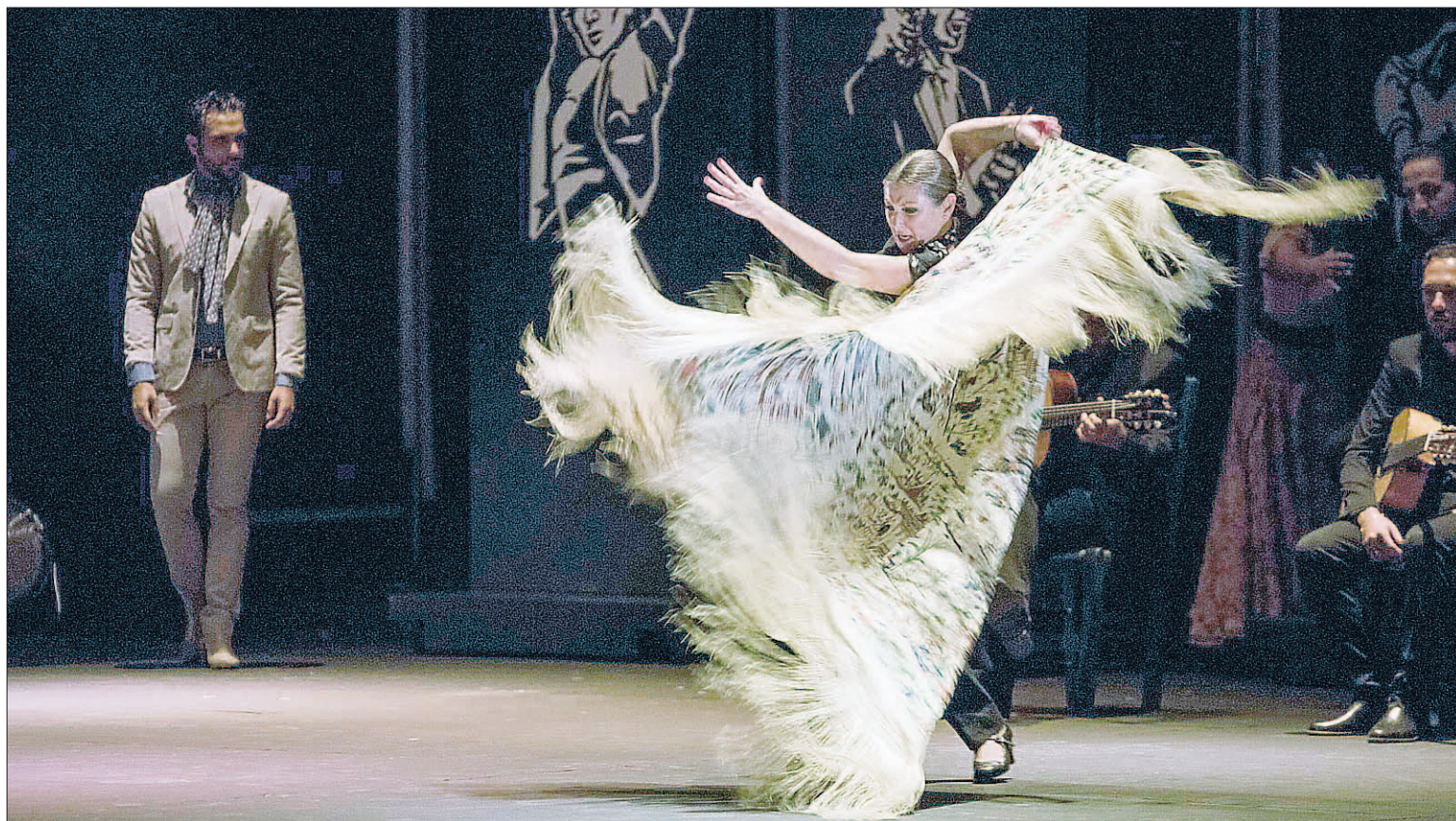
La bailaora Sara Baras volverá de nuevo a Segovia, esta vez al Teatro Juan Bravo, con su último espectáculo 'Sombras'.

En lo que respecta al apartado musical, las tablas del 'Juan Bravo' pondrán la alfombra roja para recibir el día 18 de marzo a uno de los mejores saxofonistas de la historia, Maceo Parker, quien pasó