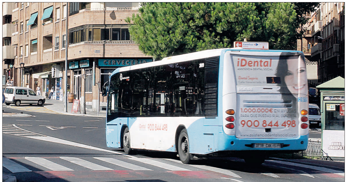
Autobús urbano de la línea 2 (San Lorenzo) que con el nuevo contrato no modificará su recorrido.

Como se recordará, este procedimiento se abrió ya el pasado octubre, con la publicación el día 14 de ese mes del anuncio correspondiente en el Boletín Oficial del Estado y en la Plataforma de Contratación del Sector Público. La documentación ya señalaba entonces como fecha orientativa para la apertura del sobre con la oferta económica el 1 de marzo de 2018 a las dos de la tarde, aunque en este caso el plazo para la presentación de ofertas concluía el 23 de noviem-