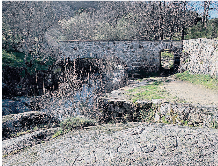
Uno de los puntos más destacados de la ruta es el 'Puente del Anzoler'.

Los excursionistas alcanzarán la cima, tras unas tres horas y me-