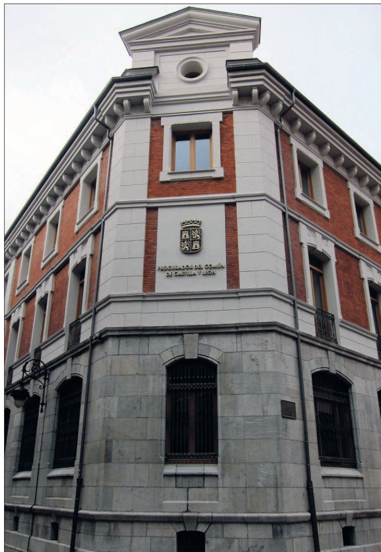
Sede Del Procurador Del Común De Castilla Y León.

MÁS RESOLUCIONES También fue "notable" el aumento de las resoluciones adoptadas por la Comisión de Transparencia, con 155