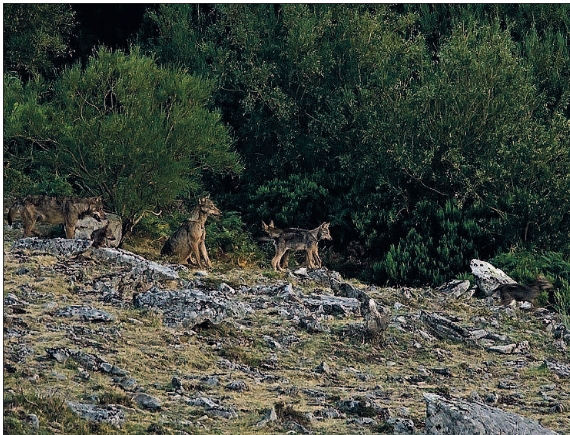
La Junta entiende que los grandes carnívoros han de tener un "tratamiento específico".

Y todo ello a partir del hecho inamovible de que el lobo "nunca será objeto de caza al Sur del Duero" al encontrarse protegido por una directiva comunitaria, de ahí