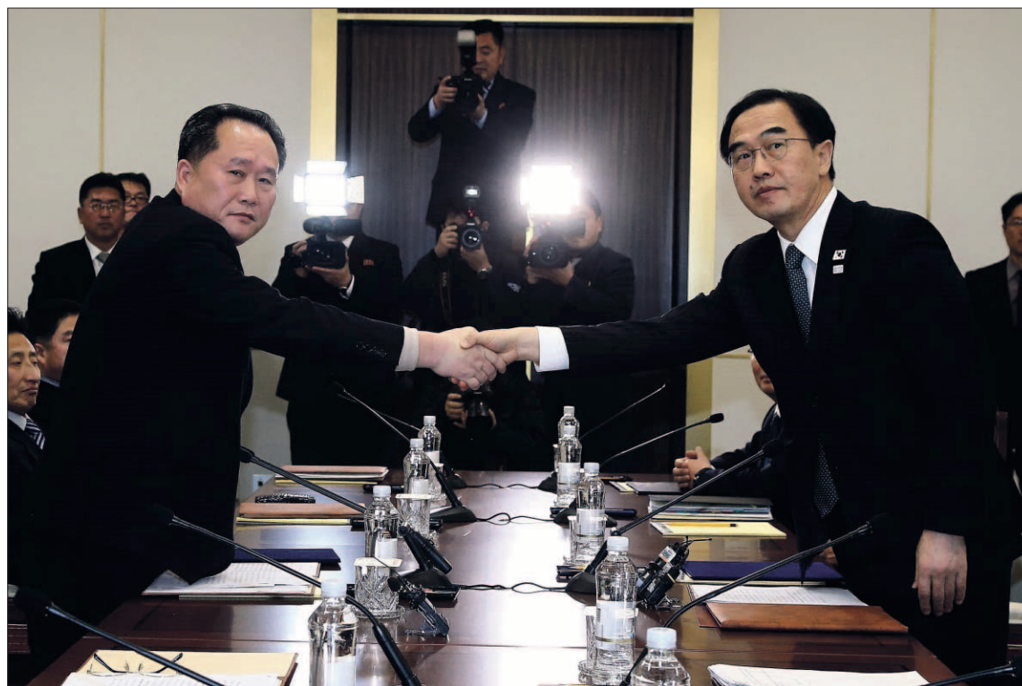
Los jefes de las delegaciones de Corea del Norte (izq) y Corea del Sur (dcha), en el comité para la Reunificación Pacífica.