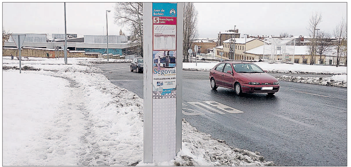
Los usuarios del transporte público reiteraron ayer las quejas por el estado de algunas paradas.

negaron también a realizar carreras a localidades del alfoz, por el estado de sus calles.