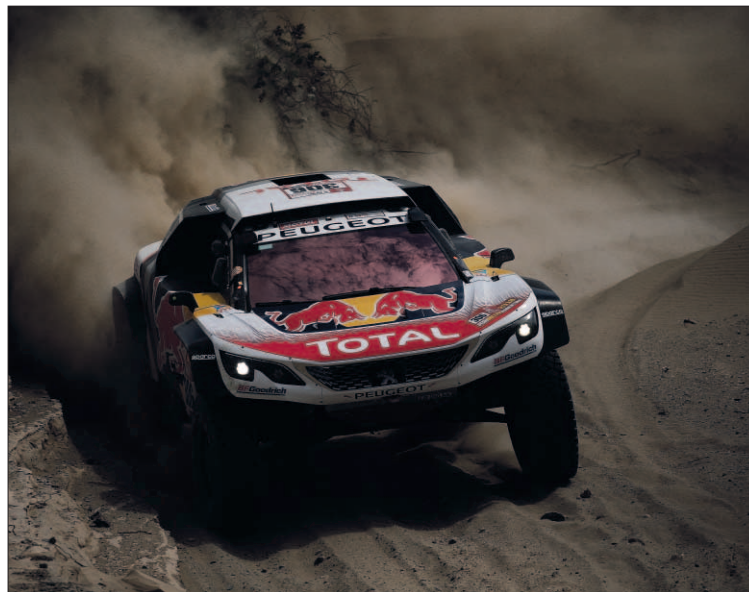
Sébastien Loeb ganó una etapa dominada por los coches Peugeot.