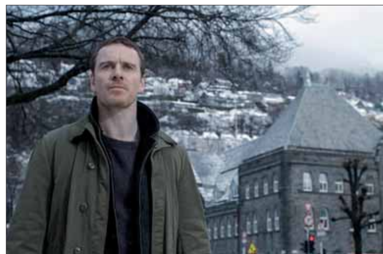
Michael Fassbender en un fotograma de 'El muñeco de nieve'.

La Fiesta del Cine continuará hasta el próximo miércoles día 18 de octubre, hasta cuando se podrán adquirir entradas a un precio de 2,9 euros para quienes se