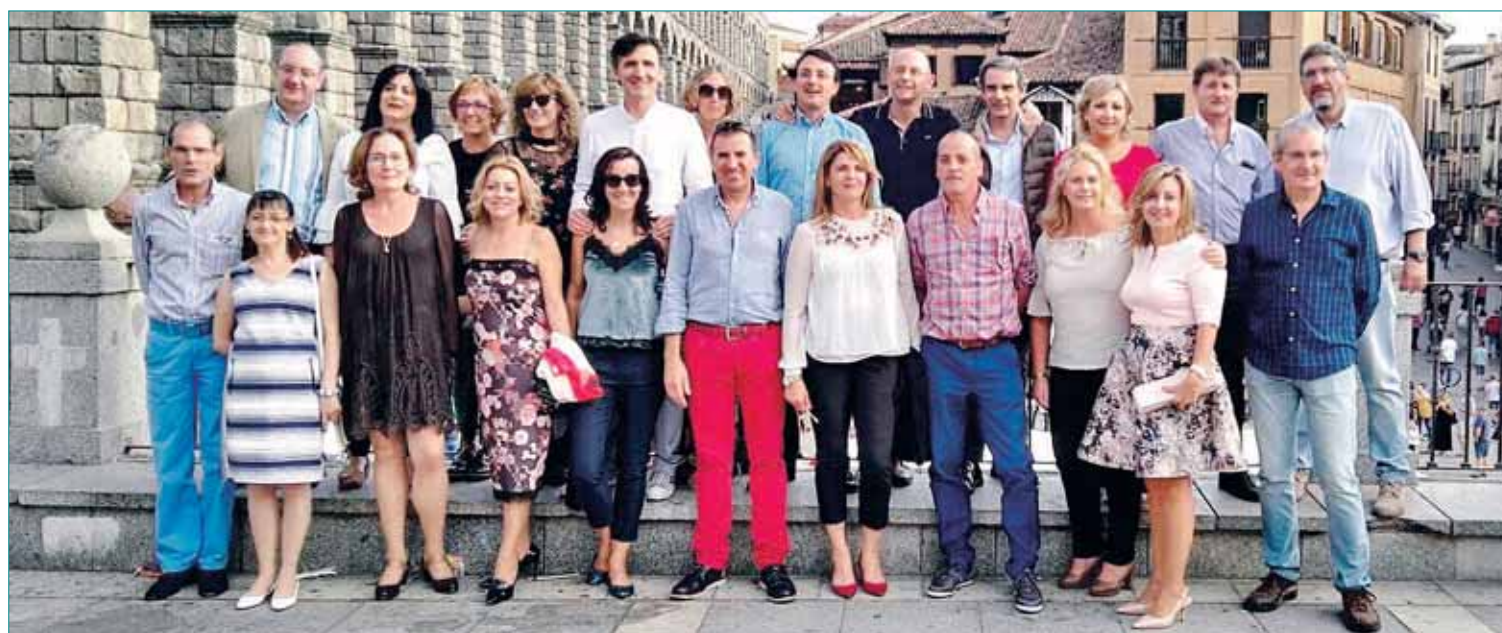
QUINTOS. Los quintos del 67 de Valverde del Majano se han reunido para celebrar su medio siglo de vida. Para ello se juntaron el pasado día 14 y lo pasaron estupendamente. Felicidades a todos.