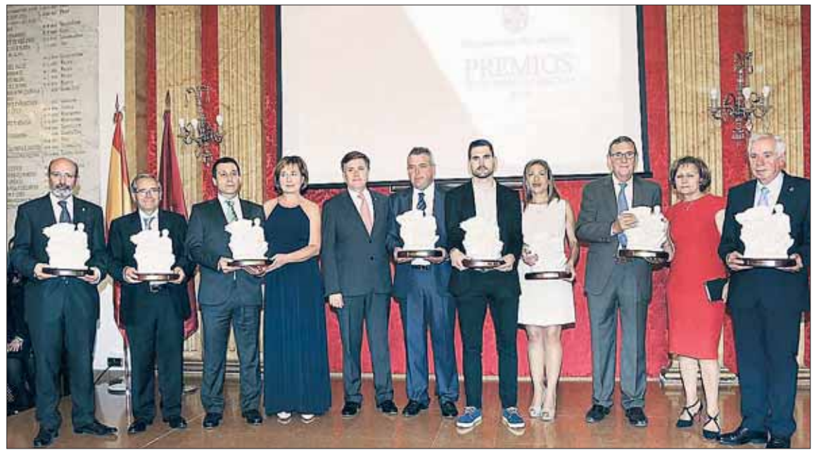
Imagen de los premiados en la anterior convocatoria de los premios de la Diputación.