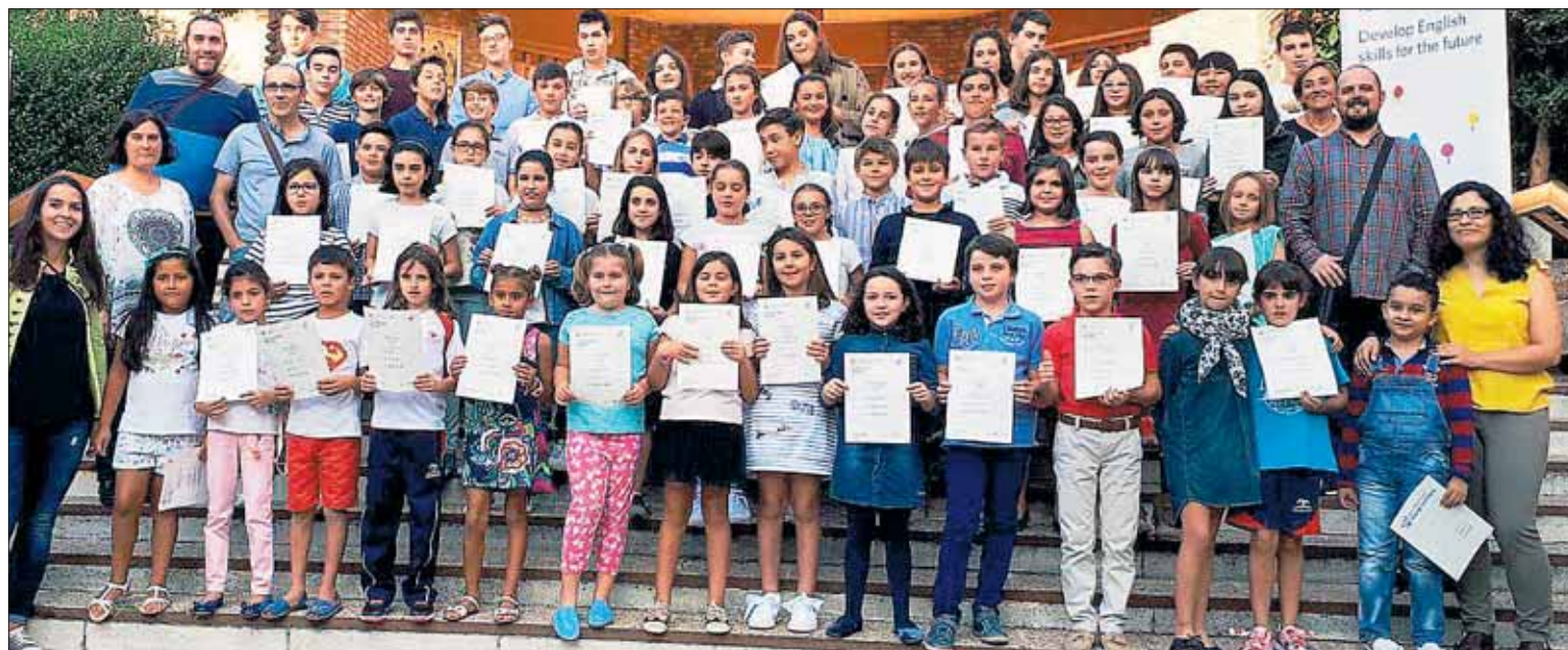
Foto de familia de los alumnos que han obtenido los diplomas, en la entrada del centro educativo.