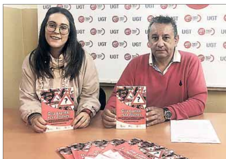
La guía ya está a disposición de los jóvenes en la sede del sindicato.

relación laboral, prestaciones por desempleo o representación de los trabajadores en la empresa entre otras. Además, incluye un cuestionario de autoconocimiento que ayudará a los usuarios a definir los rasgos más característicos de su personalidad y determinará cuáles son sus puntos débiles y sus puntos fuertes para conseguir una mejor definición de su objetivo profesional.