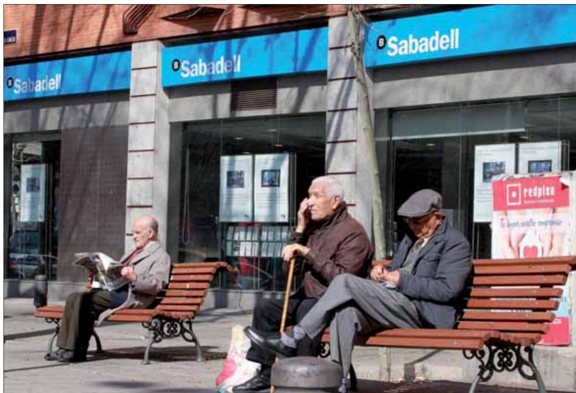
El mayor número de traslados de sede de Cataluña fueron el 9 de octubre, con 212 entidades salientes.

En lo que se refiere al destino de dichas compañías que abandonan Cataluña, Del Valle destacó que todavía es "demasiado pron-