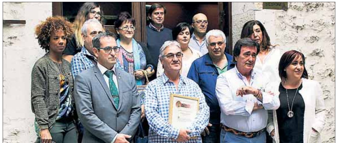
Todos los galardonados, tras recibir el premio en el Ayuntamiento cuellarano.

Por último, los dueños del bar ‘Las Bolas’ recogieron su distinción como mejor tapa del concurso por su creación ‘Viva la vida’. La tapa es un canelón relleno de boletus y foie, aderezado con jamón y aceite de trufa, de las que calculan haber realizado más de 2.000 unidades. Se ha podido degustar este pasado puente y se prevé en próximas fechas, aun-