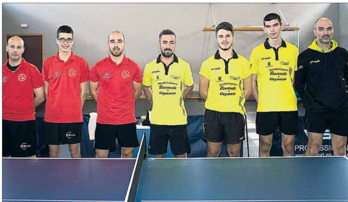
Foto de grupo de los jugadores de San Cristóbal y Cabrerizos antes del encuentro.