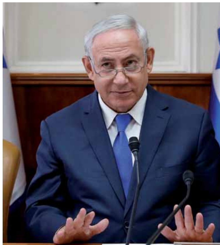
Benjamin Netanyahu es el primer ministro de Israel.

Por su parte, Nabil Abu Rdainah, portavoz del presidente de la Autoridad Palestina, afirmó que no habrá cambios en la “posición oficial palestina de avanzar en los esfuerzos de reconciliación”. También recordó que el acercamiento ha sido ya aplaudido por algunas de las principales potencias internacionales, entre ellas EEUU.