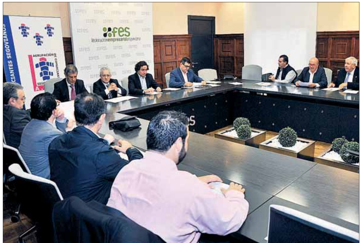
Los integrantes de la directiva de la Confederación se reunieron en la sede de la FES.

Alejados tradicionalmente de cualquier dieta considerada saludable, los pasteleros han comen-