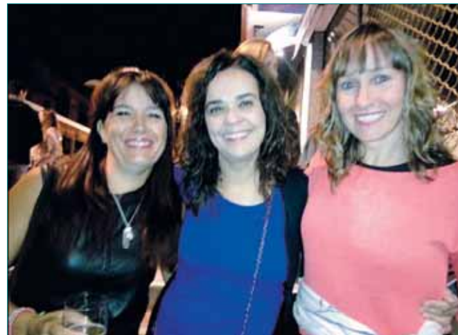
ANIVERSARIO de una buena amistad.