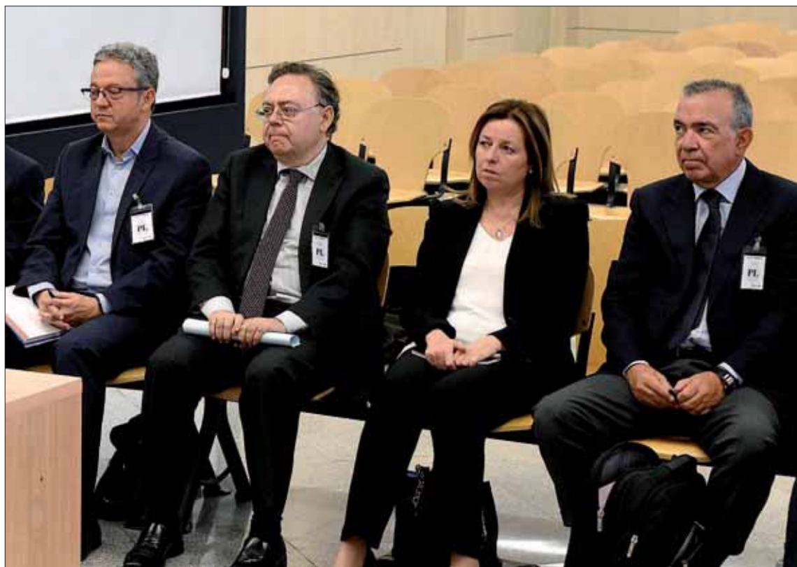
Imagen de los exdirectivos de la antigua Caja de Ahorros del Mediterráneo (CAM).