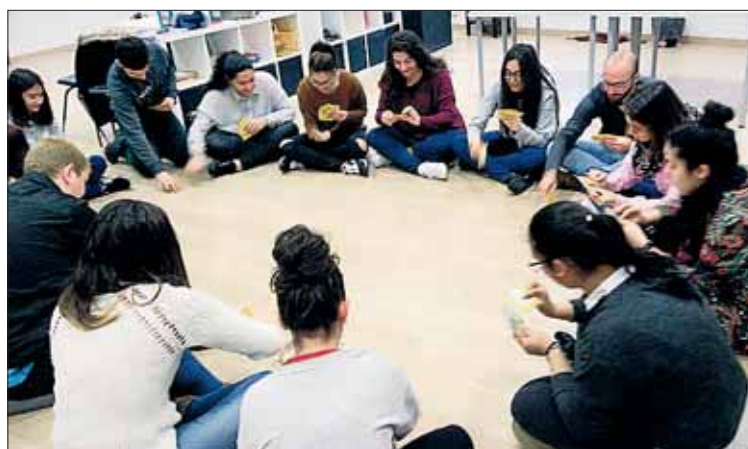
Una clase con los alumnos del curso de monitor de tiempo libre.

El claustro de profesores que lo componen forma un equipo interdisciplinar en contacto continuo, y aportan frescura y experiencia a la acción formativa. Se trata de expertos en tiempo libre, monitores y coordinadores de nivel, licenciados en Ciencias del Deporte, Trabajo Social, Magisterio, Historia del Arte y Biología,