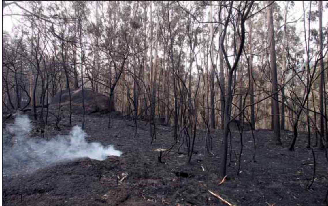
El desastre ecológico producido por la cadena de incendios en Galicia no tiene parangón en su historia.

En 2016, de acuerdo con los datos que analizó el Consello de la Xunta, la comunidad superó las 20.000 hectáreas quemadas (20.347), más de 9.000 de monte arbolado, hasta comienzos de noviembre. La distribución de los casi 300 fuegos declarados en Galicia durante los últimos cuatro días es la siguiente, según las cifras que