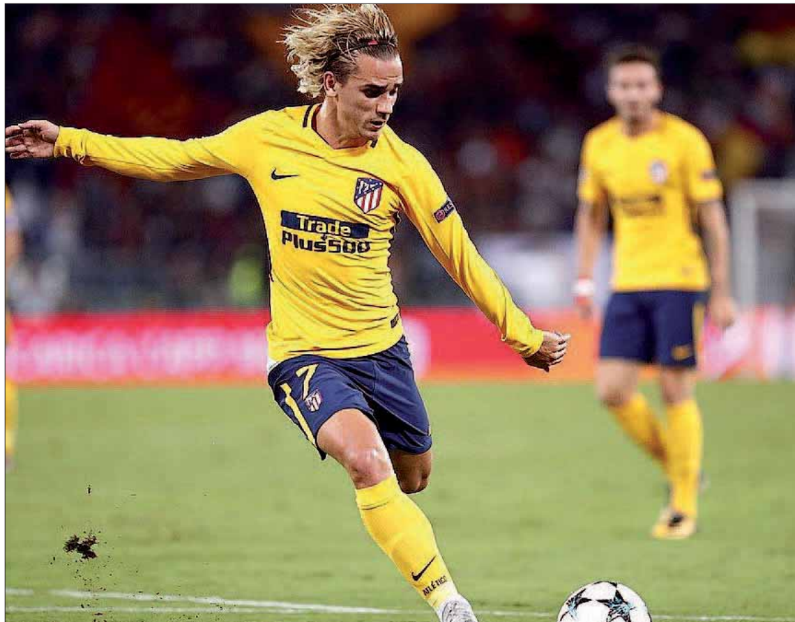
La participación de Antoine Griezmann es una incógnita debido a un proceso febril/EUROPA.PRESS.

20 JUGADORES El equipo rojiblanco solo está a tres puntos de la Roma y a cinco del Chelsea, dueños provisionales de los dos billetes para octavos de final, una situación que obliga a lograr el pleno de puntos en el doble enfrentamiento que viene ahora frente al Qarabag.