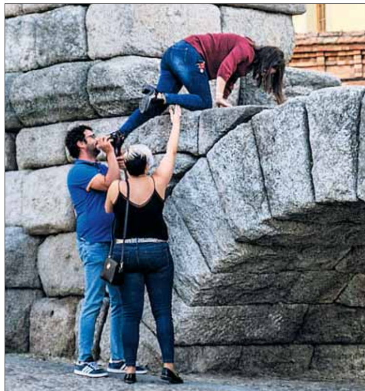
La joven de la fotografía se subió a este arco el pasado fin de semana.

Por otro lado, en relación con la protección del entorno del Acueducto, dos grupos políticos con representación en el Ayuntamiento, UPyD Centrados en Segovia e IU