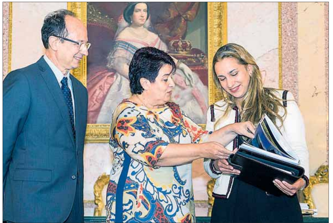
La alcaldesa entrega material divulgativo de la ciudad a la Joven Embajadora en presencia del rector de IE University.