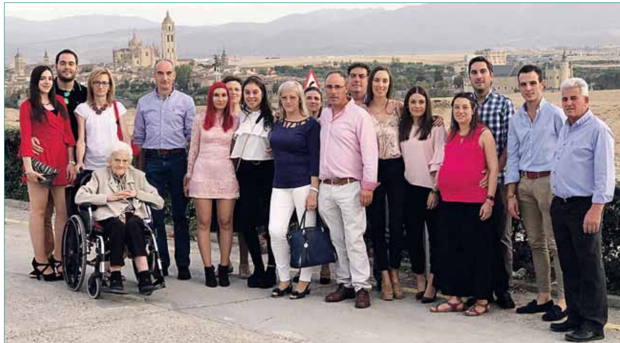
ENHORABUENA por estos 25 años de casados y muchas gracias por dejarnos celebrarlo con vosotros pasando ese día tan estu- pendo en familia. A por otros 25 para poder seguir celebrando!! De parte de toda la familia. Os Queremos.