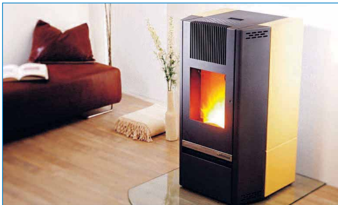
Una de las grandes apuestas de estas energías renovables es la energía del serrín o más conocida como biomasa.

La Confederación Nacional de la Construcción, CNC, destaca el rol esencial de la biomasa como pieza clave en el camino hacia una construcción sostenible