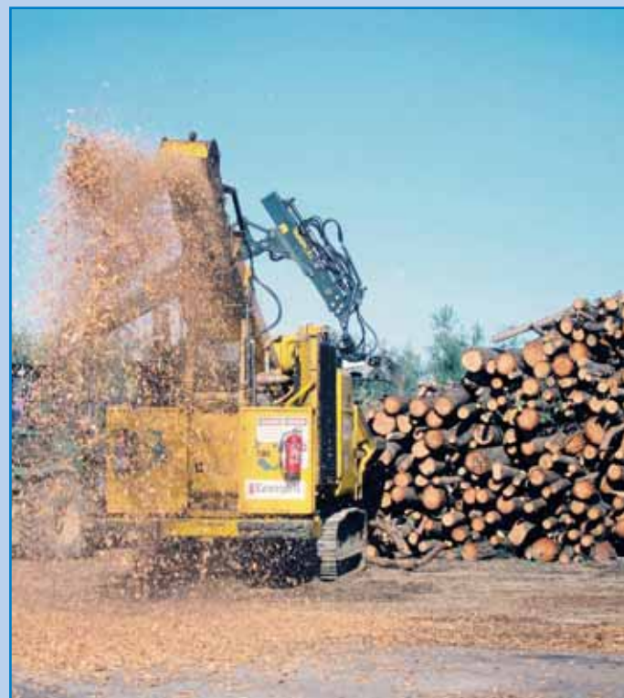
Producción de biocombustible sólido para calderas de biomasa.

En Europa ya representa el 16% de la calefacción y en España nueve de cada diez de las nuevas instalaciones utilizan esta fuente de energía