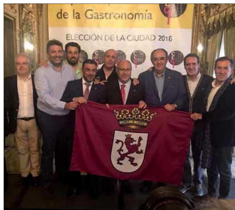
Celebración tras el nombramiento.