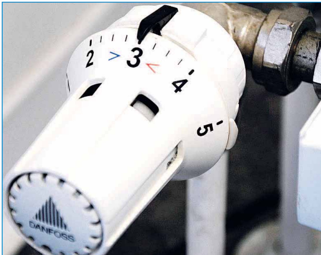
Con algunos de estos gestos, el ahorro en calefacción puede oscilar entre el 8 y el 13%.

Y por último, pero no menos importante, se debería tener en cuenta dos factores más. Por un lado, un gesto tan repetido en las viviendas durante los meses invernales como es poner a secar la ropa en los radiadores y regalar calor a la calle ventilando más de lo necesario y con la calefacción puesta. Para estos dos problemas, las soluciones más adecuadas son, por un lado tener despejados los radiadores y, aún mejor, colocar detrás de ellos unos paneles reflectantes que hacen rebotar el calor e impiden el robo del mismo por las paredes. Estos paneles cuestan entorno a diez euros y según la Organización de Consumidores y