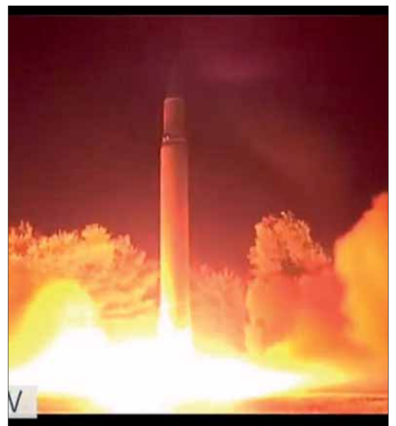
Momento del lanzamiento de un misil norcoreano intercontinental.

Las autoridades norcoreanas justifican su escalada nuclear y