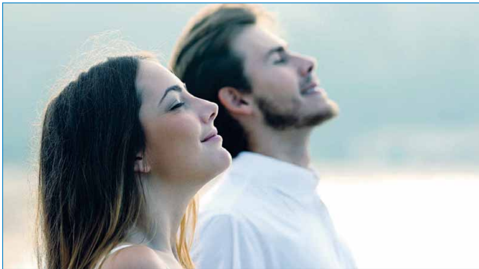
Gas Natural, una energía muy respetuosa con el medio ambiente.

densación del vapor de agua. Además, al no necesitar depósitos de almacenamiento ni mecanismos especiales para su transporte, los costes de mantenimiento se reducen resultando mucho más económico que si se utilizase gasóleo o biomasa. Si a eso le añadimos la libre elección de la comercializadora, los bene-