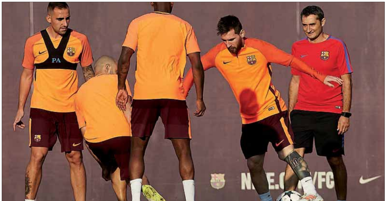
Un entrenamiento del equipo blaugrana antes del encuentro que los enfrentará al histórico conjunto griego.