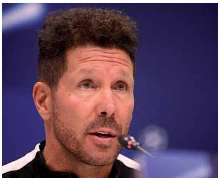
El entrenador rojiblanco presumió de la imbatibilidad en liga de su equipo.

bles críticas tras el empate ante el FC Barcelona, que el equipo ha jugado "cinco partidos como visi-