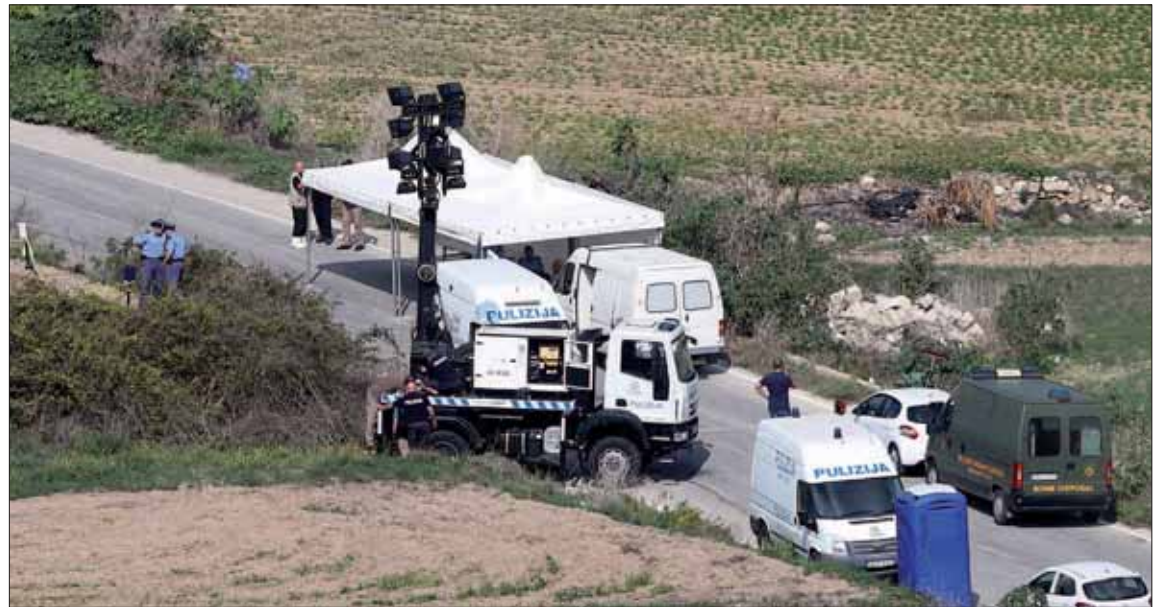
Vista del lugar donde fue asesinada, mediante la explosión de una bomba, la periodista maltesa Daphne Caruana

El primer ministro, Joseph Muscat, y el líder de la oposición,