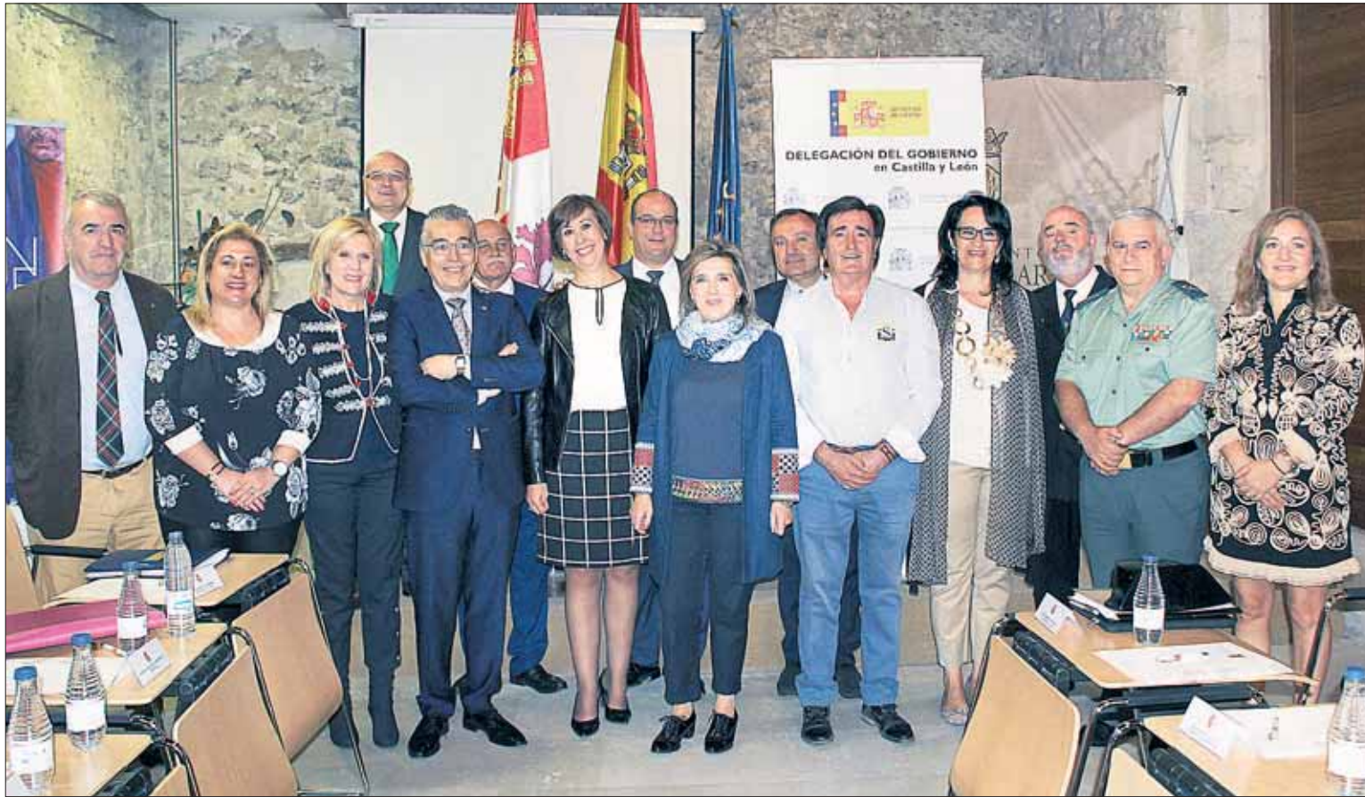
Participantes en la Comisión de Asistencia a la delegada del Gobierno de Castilla y León, celebrada en el Palacio de Pedro I./ C.N.