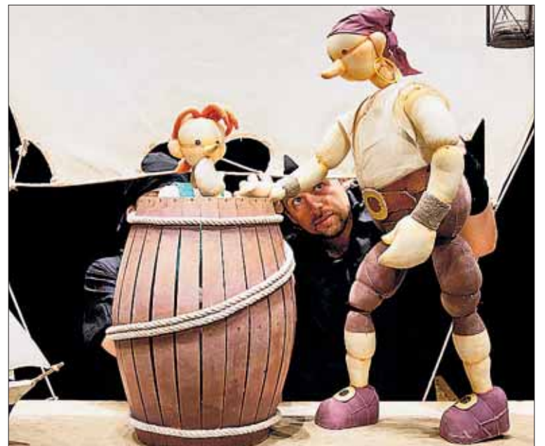
El teatro de títeres vuelve a la sala de Teatro Paladio. / EL ADELANTADO

Desde Paladio Arte afirman que "el arte y la cultura no sabe, no debe saber de colores, banderas, razas, sexos, condición física o intelectual... La cultura es de todos y para todos y eso es lo que debemos transmitir a las generaciones que nos siguen. Esto es lo que Paladio quiere transmitir".