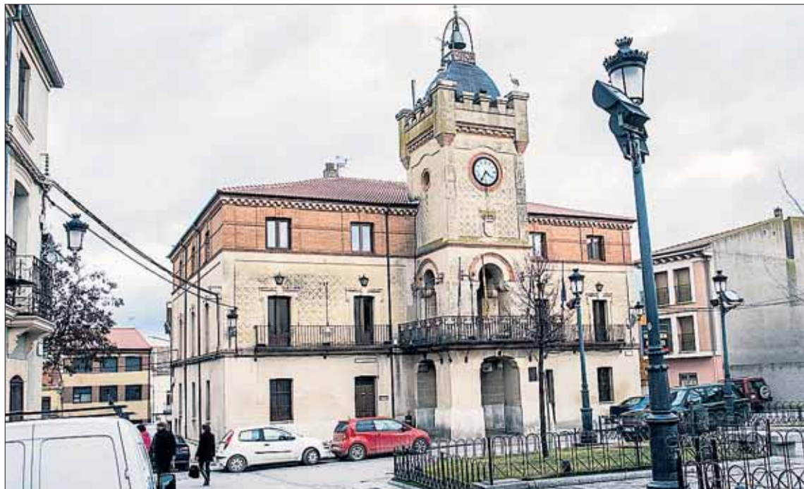
El Ayuntamiento de Carbonero acomete en la actualidad la pavimentación de varias calles.

Desde el grupo popular explican que el lamentable estado, con peligrosos socavones para personas y vehículos, que presenta el