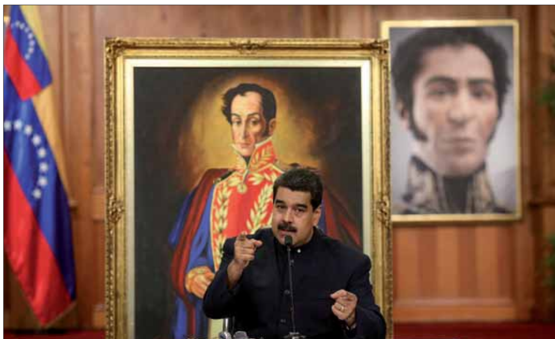
Nicolás Maduro durante un encuentro, ayer, con medios internacionales en el palacio presidencial de Miraflores.

Representantes del Gobierno y la MUD tuvieron varias reuniones en Santo Domingo, auspiciadas por el presidente dominicano, Danilo Medina, y por el ex presidente