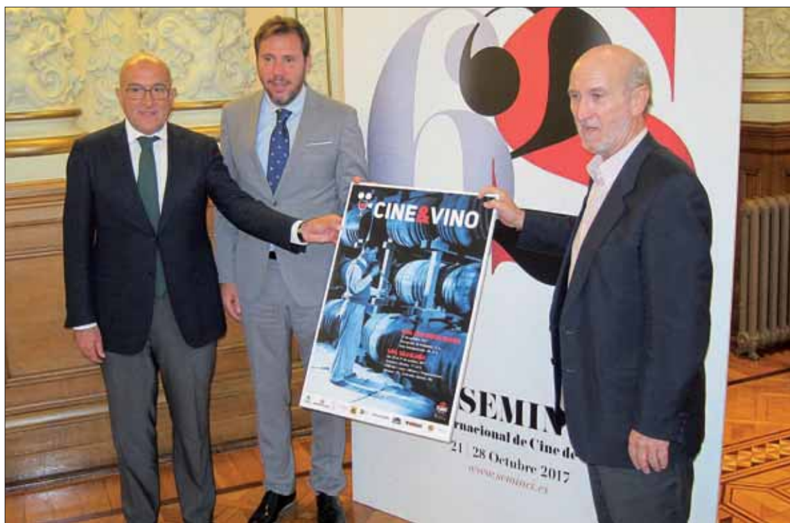
Presentación en la Semana Internacional de Cine de Valladolid de la iniciativa 'Cine&Vino'.

Al acabar, se realizará una degustación de cien vinos de las tres denominaciones de origen, acom-