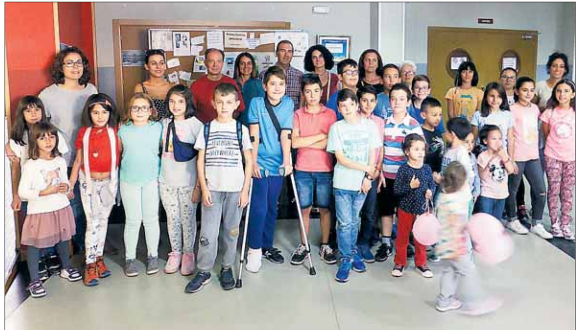
Integrantes del Consejo de la Infancia celebrado en la localidad.

Durante todo el día también se pusieron a disposición ciudadana en la biblioteca municipal varios ordenadores, para firmar online por la educación de las