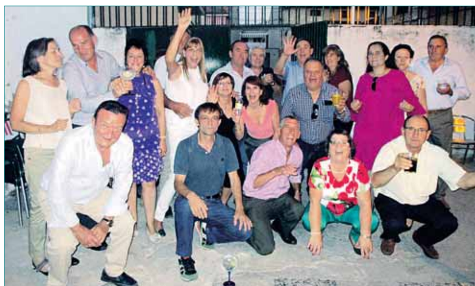
LOS QUINTOS Y QUINTAS DE 1957 del municipio de Cantimpalos se han reunido para celebrar su 60 aniversario, los actos festivos comen- zaron con un vino español por los diferentes bares del pueblo, con música y fuegos artificiales.... para después continuar más íntimamente compartiendo mesa y mantel en el restaurante "El Rincón de Ramón" de Cantimpalos, en un entorno alegre y divertido donde no faltaron anécdotas y recuerdos de esos años pasados en los que fueron mozos jóvenes. La fiesta continuó hasta que el cuerpo aguanto en el Bar Piche, todos al son de la música de los 60 y 70, fue un día mágico, alegre e inolvidable ¡Viva los Quintos del 57! /LOURDES MATARRANZ GOMEZ