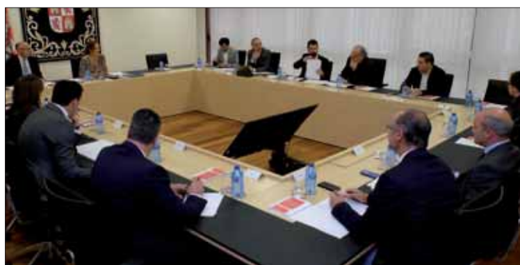
Mesa y la Junta de Portavoces de ayer. / JUNTA DE CASTILLA Y LEÓN

El día 31 de octubre está previsto el vencimiento de presenta-