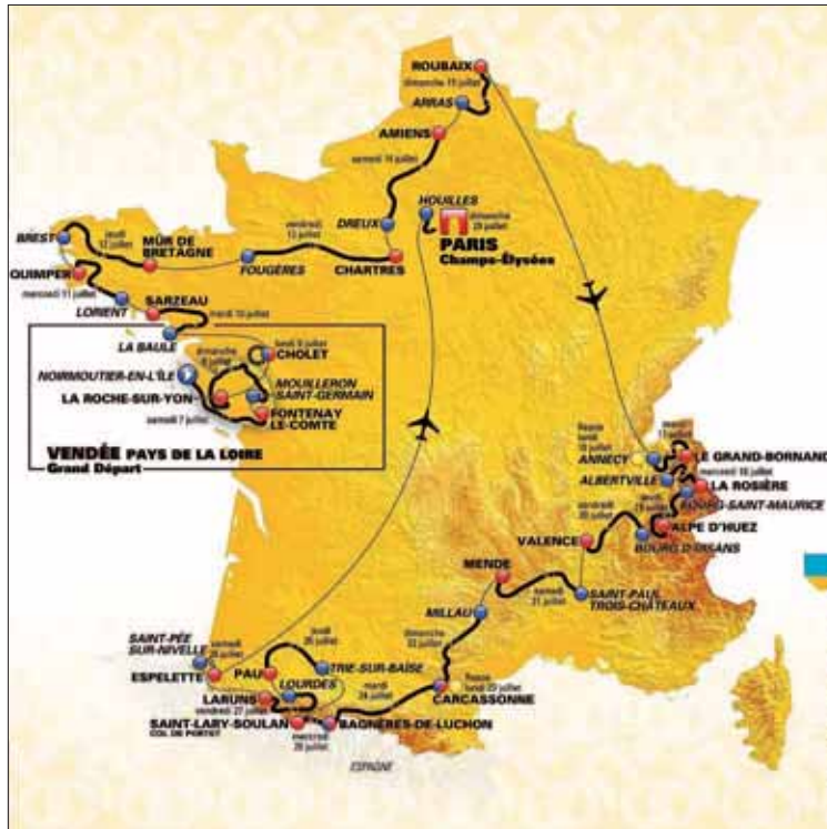
La ronda francesa presenta, este año un singular recorrido.

La ‘Grande Boucle’ abrirá ya la oportunidad a los favoritos que