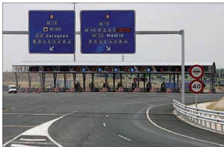
El Gobierno reservará el importe de los Presupuestos de 2018.

El Gobierno incluye esta cifra en el Plan Presupuestario que acaba de enviar a Bruselas, en el que dice que "la evolución del gasto en inversiones en el 2018 está afectada por la cobertura por importe de más de 2.000 millones de euros pa-