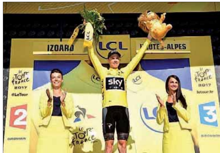
Froome se enfrenta al reto de conquistar el que sería su quinto Tour.

Así, recordó que afrontarán “carreteras de tierra, pavé, y muchas etapas peligrosas por el