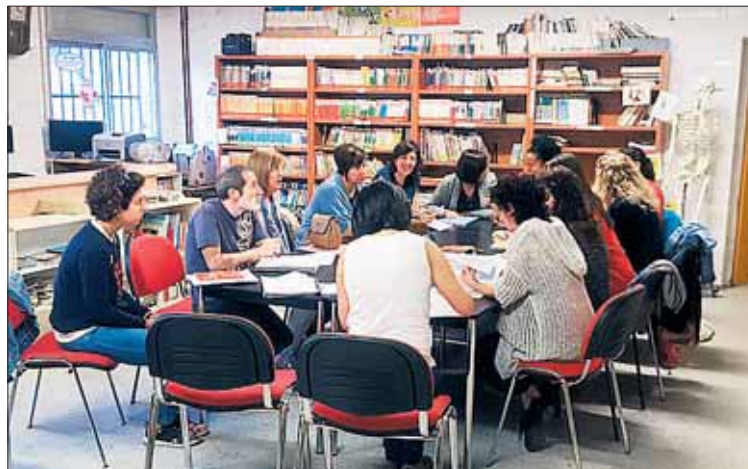
El claustro de profesores durante una sesión de 'brain gym'.

PROFESORES Por otro lado, el claustro se está formando en 'brain gym' (gimnasia cerebral), que de lo que trata es de trabajar con los alumnos esta técnica durante los cinco primeros minutos de cada clase, para facilitar el aprendizaje de otros conocimientos.