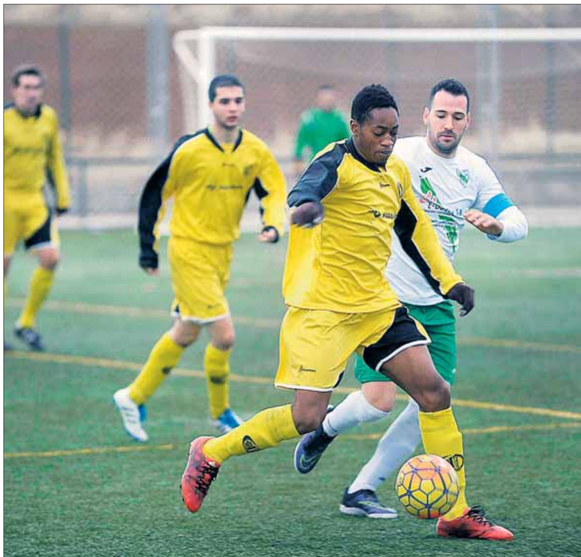
Imagen de un encuentro de liga provincial jugado por el CD Quintanar.

En el campo Cristo del Valle de Villacastín se disputó el partido más emocionante de la jornada, con un Arcángel que llevó la iniciativa en el marcador durante prácticamente todo el choque, y un Villacastín extraordinario en su reac-