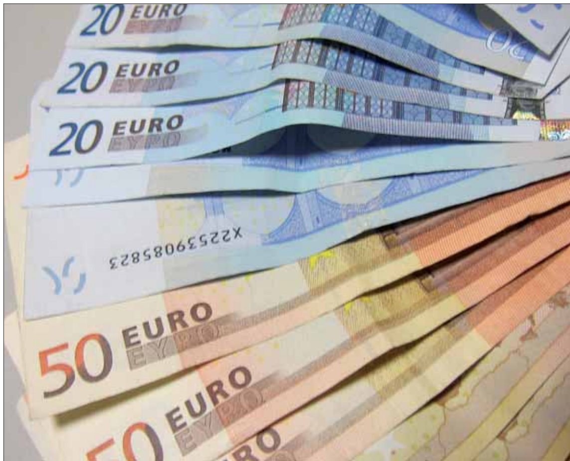
El grueso de la deuda en manos de las administraciones públicas se encuentra en valores a medio y largo plazo.

VALORES A CORTO PLAZO El grueso de la deuda en manos de las administraciones públicas se sigue encontrando en valores a medio y largo plazo, que suponen las tres cuartas partes (77,5%) de la deuda total. Estos valores aumentaron en agosto en 3.458 millones de euros respecto al mes de julio, hasta los 878.915