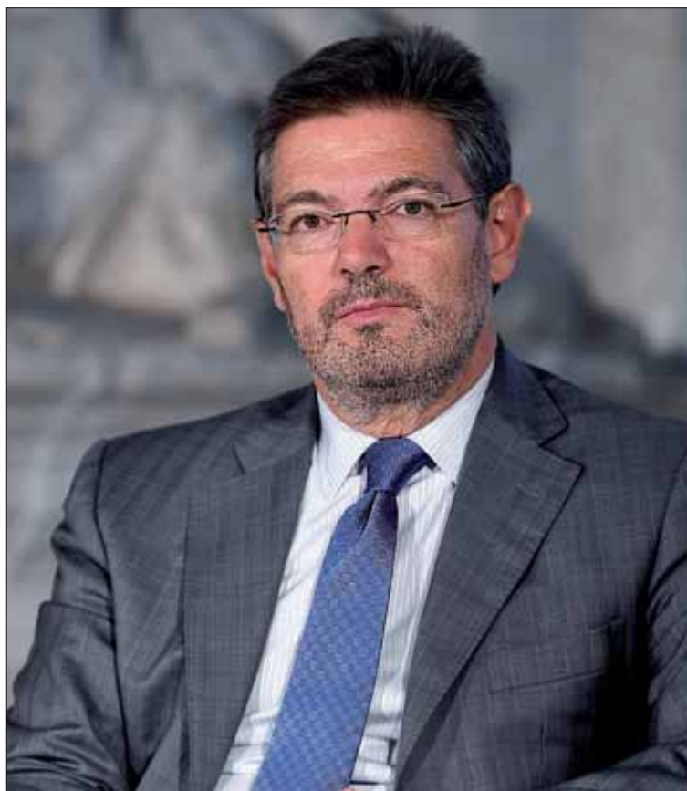
El ministro de Justicia, Rafael Catalá.

En esta línea, ante las afirmaciones de algunos líderes independentistas, como el presidente de la Generalitat, Carles Puigdemont, que aseguró que Sánchez y Cuixart se convirtieron en presos políticos, Catalá rechazó esta expresión y señaló que "no se puede hablar de presos políticos, pode-