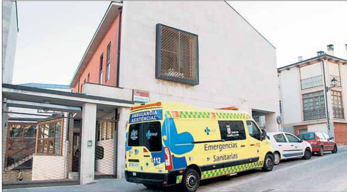
Actual Centro de Salud de la villa de Cuéllar./ C.N.

“En ningún momento se ha dejado”, explicó el alcalde respecto al tema. Habló del compromiso de esta legislatura para que fuera una realidad; “nunca hemos querido decir nada hasta que no hubiese algo muy concreto como es ahora, un proyecto de presu-