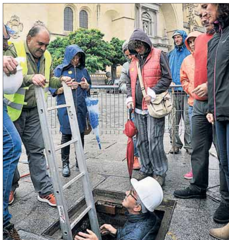
La lluvia no impidió ayer la celebración de la visita ‘El Acueducto por dentro’. / K.

San Gabriel y el registro situado en la Plaza Mayor. Esta actividad se repetirá el jueves y el viernes. La que repite hoy, después de la gran aceptación que tuvo el lunes, es la visita por la muestra ‘Romanorum Vita’, de la Caixa, una exposición que cuenta cómo se vivía en las ciudades romanas. Antes, a la 11.30 horas se realizará el recorrido ‘Conoce el Acueducto’, por su parte monumental, desde el mirador del Postigo a San Antonio el Real (se repetirá el domingo). El sábado se podrá ver el monumento desde 17 metros de altitud.