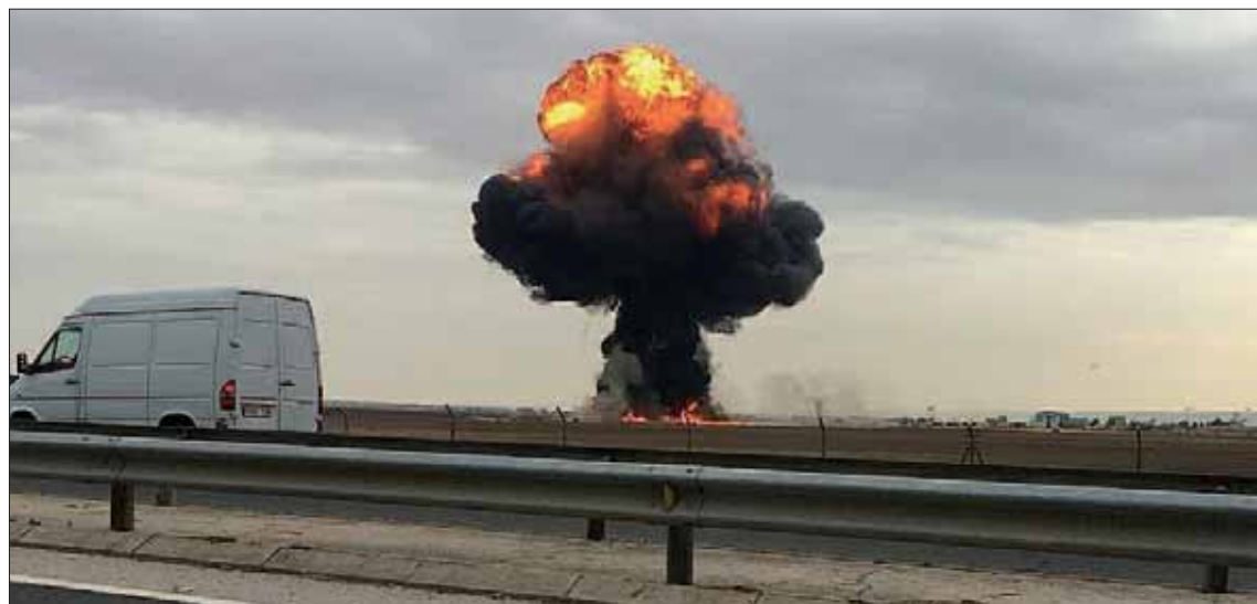
Momento en que el F-18 explota contra el suelo en la base militar de Torrejón de Ardoz.

FATAL COINCIDENCIA “A falta de confirmación del Ministerio de Defensa, sabemos que el piloto ha fallecido y desde este momento dar el pésame a la familia, Fuerzas Armadas, el Ejército del Aire y el conjunto del ejército es-