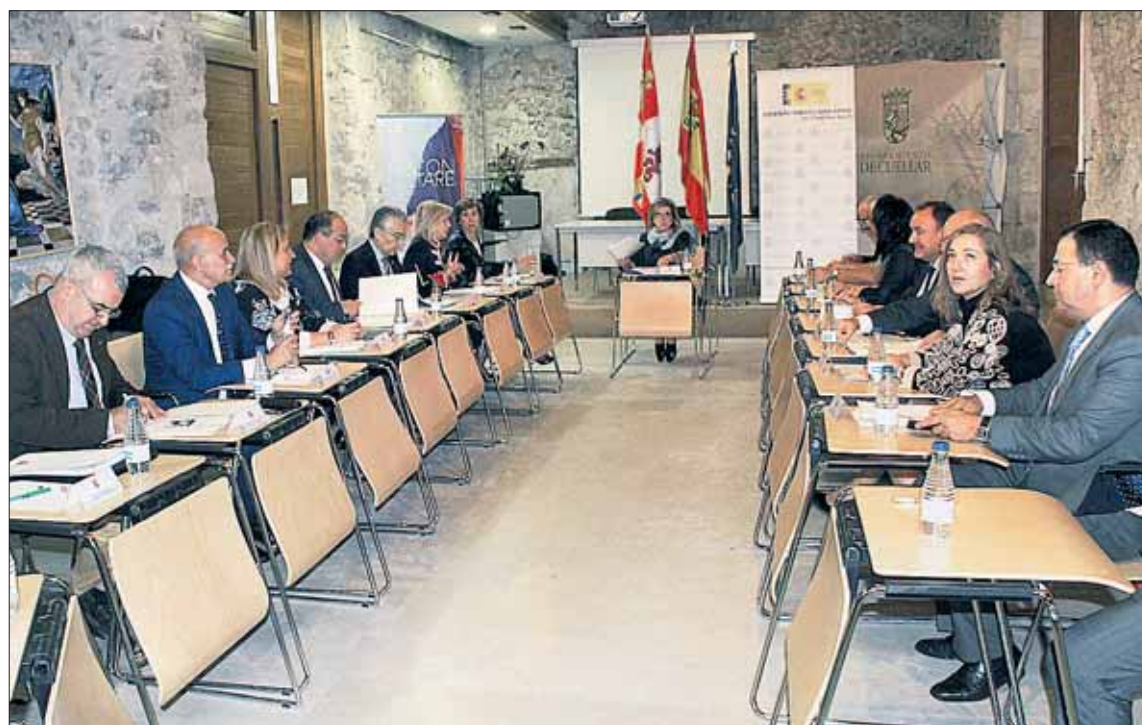
Reunión de trabajo de la Comisión de asistencia a la delegada del Gobierno ayer.