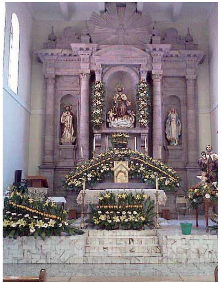
Entraron en la parroquia pidiendo confesión al sacerdote.

Para el tribunal, existe "material incriminatorio suficiente para obtener un pronunciamiento de condena" contra los agresores, basado, sobre todo, en la declaración de la víctima y de testigos que lo vieron después de la agresión. Del mismo modo, también se ha tenido en cuenta la reconstrucción que se hizo de la salida de los agresores desde la Iglesia y hasta que cogieron un taxi, apoyada por grabaciones de las cámaras de seguridad.