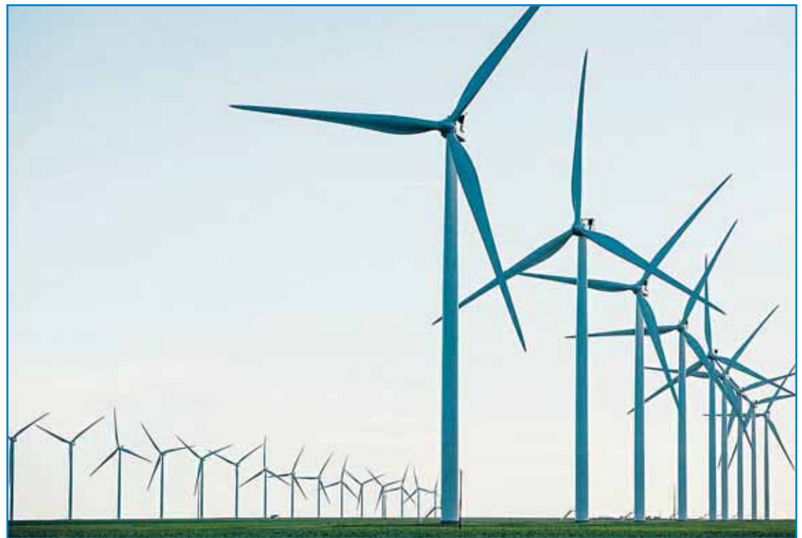
Las instalaciones eólicas constituyen la principal fuente de energía renovable.

Este verano han comenzado las obras para instalar contadores individuales en cada vivienda, lo que permitirá observar por medios telemáticos el comportamiento del consumo en comunidades y poder anticiparse a la demanda de los vecinos y mejorar la eficiencia del sistema de generación y distribución.