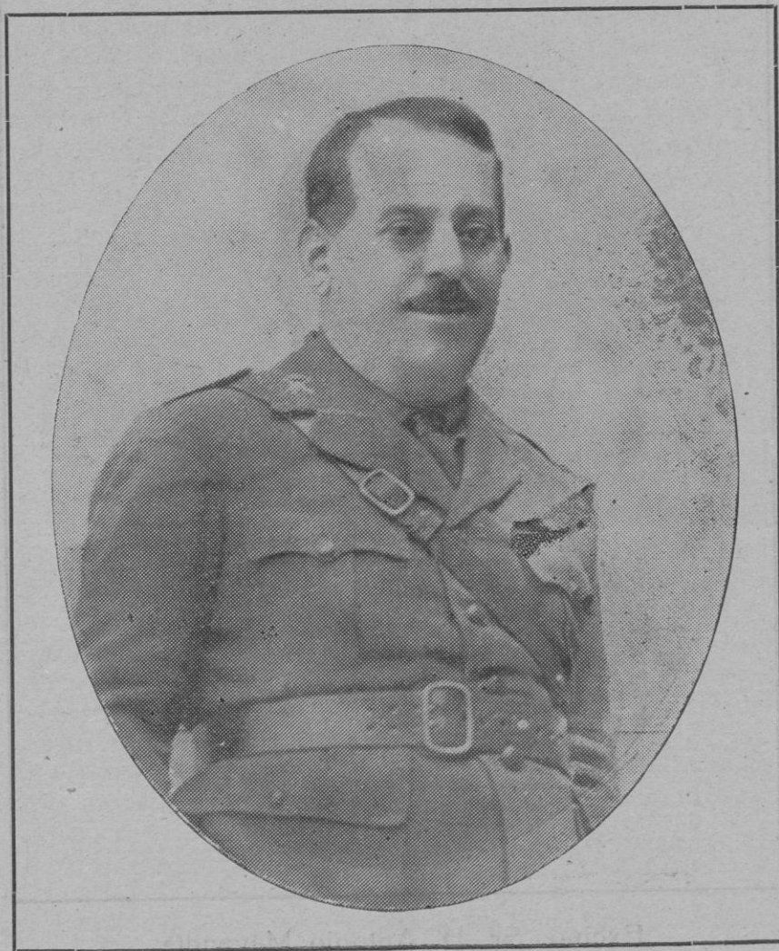
Excmo. Sr. D. José Sanjurjo,

Y sean, para manifestar la íntima satisfacción que me produce ser útil como soldado a mi