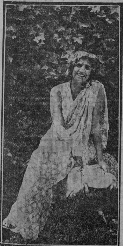
Una de las jóvenes universitarias de la India que han visitado Sevilla, durante su visita al Alcázar.

Recorrido.—Puerta de San Fernando. (Continúa en la página siguiente)