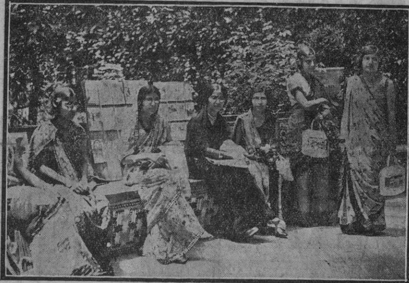
Grupo de jóvenes universitarias posando en los jardines del Alcázar.

—El Cabildo se celebró bajo la presidencia del señor Halcón. Se aprobó, con el voto en contra de los conservadores, la instalación de urinarios en diversos sitios de la capital.