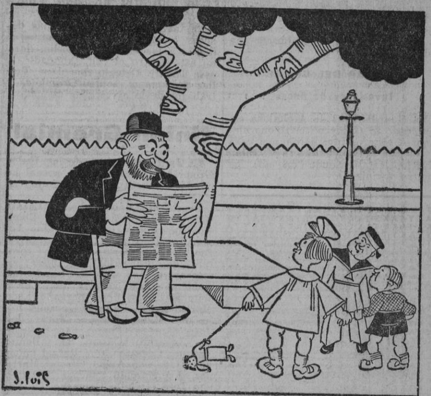
PLATO DEL DIA —Bueno, seguid jugando; pero todas las armas que encontréis me las traéis en seguida, ¿eh?...