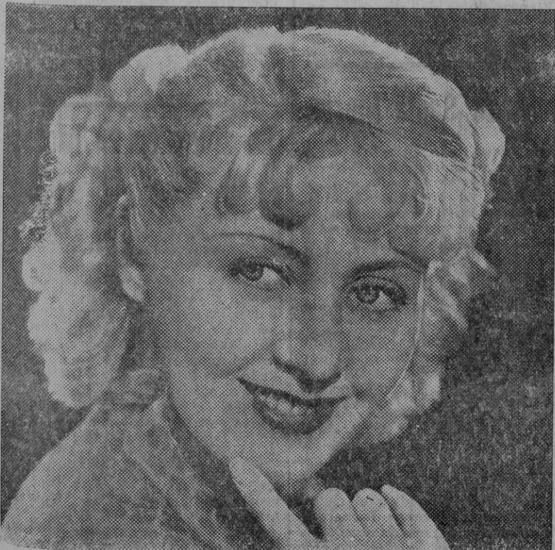
He aquí a la bella Joan Blondell, blonda artista de la pantalla.

robustecer la encarnación del Poder, no cultivando efectos teatrales y de galería con vistas al interés partidista, porque no sólo son contraproducentes, sino que, arma de dos filos, se vuelve contra los que la emplean. Si deberes tiene el Gobierno, también los tienen las oposiciones, y obstaculizar, desviar simplemente la acción fecunda, las hacen reos de un delito público, cuyas consecuencias en los momentos actuales, bien medidas y calculadas, tienen proporciones mayores. Fácil sería dar a estas líneas aire y espíritu de combate, lanzarse de lleno por los caminos de la censura cruda y del apóstrofe airado; pero queremos mantenerlas en los límites que impone la ecuanimidad, porque nunca se tiene más razón, aparte de la que da la razón misma, que cuando ésta se mantiene con serenidad y se extrema el respeto con el adversario. Si las oposiciones siguen teniendo ese viejo concepto de oposición parlamentaria que ayer han ratificado en la Cámara, un porvenir muy mediato les demostrará el error lamentable que padecen. Hoy, servir lealmente a España es servir lealmente a la República. Ambos conceptos son inseparables. Miren y avizoren los opositoristas el porvenir. Y si no están ciegos, ellos verán cuál es la única senda a seguir. Incluso los adversarios del Régimen deben mirar y proceder en consecuencia.