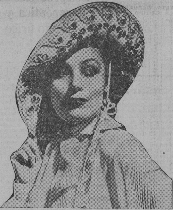
Dolores del Río, la famosa artista del cinema hispanoamericano, que tantas devociones cuenta entre los aficionados á la pantalla.

Deber y obligación moral de todas las personas afectas al Régimen es la de acudir á depositar su sufragio, porque, aun cuando la deserción del adversario del puesto de lucha, que es puesto de honor, asegure el triunfo, se debe tener muy presente que en el recuento cada papeleta significa una voluntad consagrada á la España Republicana y el total de ellas la cifra del ejército de la Democracia á la devoción y al servicio de la República. La abstención acusa un grave daño al Régimen, porque desluciría un acto tan trascendente como la elección del Jefe del Estado.