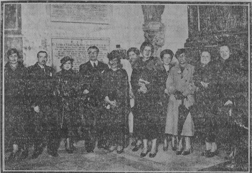
Concurrencia al acto literario de ayer.