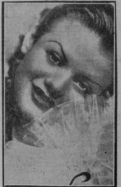
Simone Simon, atrayente estrella del cine.