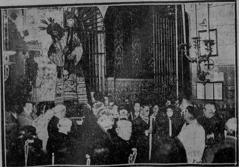
El traslado de la imagen del Gran Poder, desde su capilla, para la celebración de la novena que anualmente le consagra la Hermandad de su nombre.