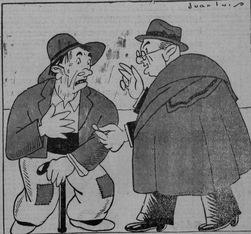
GAMBIO DE SISTEMA