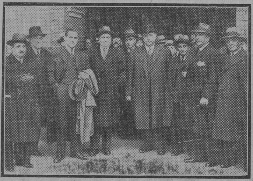
El subsecretario de Agricultura, director general del ramo y director general de Industria y Comercio, a su llegada hoy a Sevilla, con los vocales del Comité Algodonero.