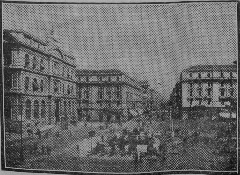
PANORAMAS EUROPEOS.—Nápoles: Ciudad y puerto de actualidad con motivo del conflicto italo-etíope. Vista de la plaza de Trieste y Trento, antes de San Fernando, y la calle Caraccioli, que conduce al célebre barrio de la Mergellina.